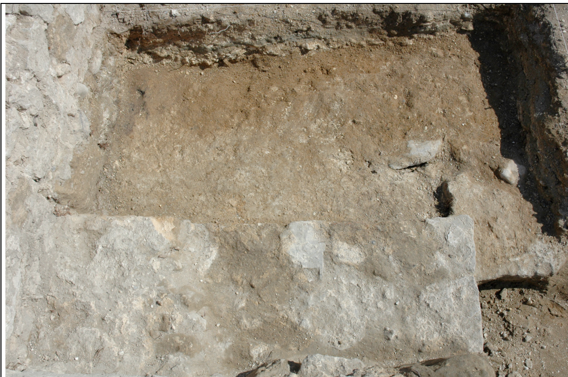
Cliché 5 : sol 3235, maçonnerie 3215, salle 3, vue vers le nord