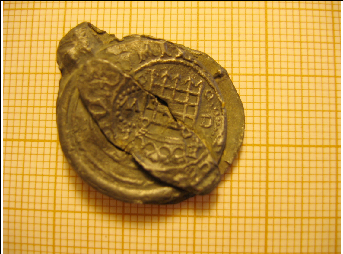
Cliché 25 : Sceau en plomb, n° 64204, US 3172