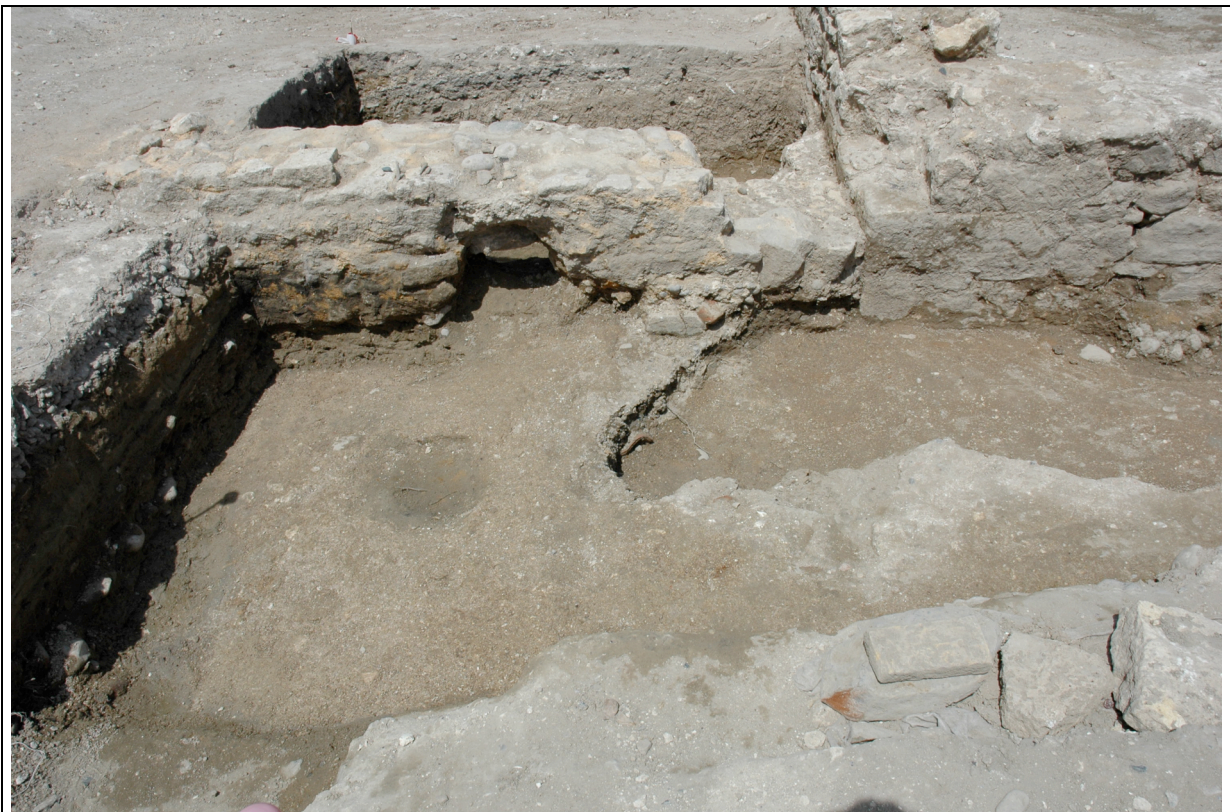
Cliché 8 : sol de sable coquillé 3095 et mur 18, salle 7 vue vers l'ouest