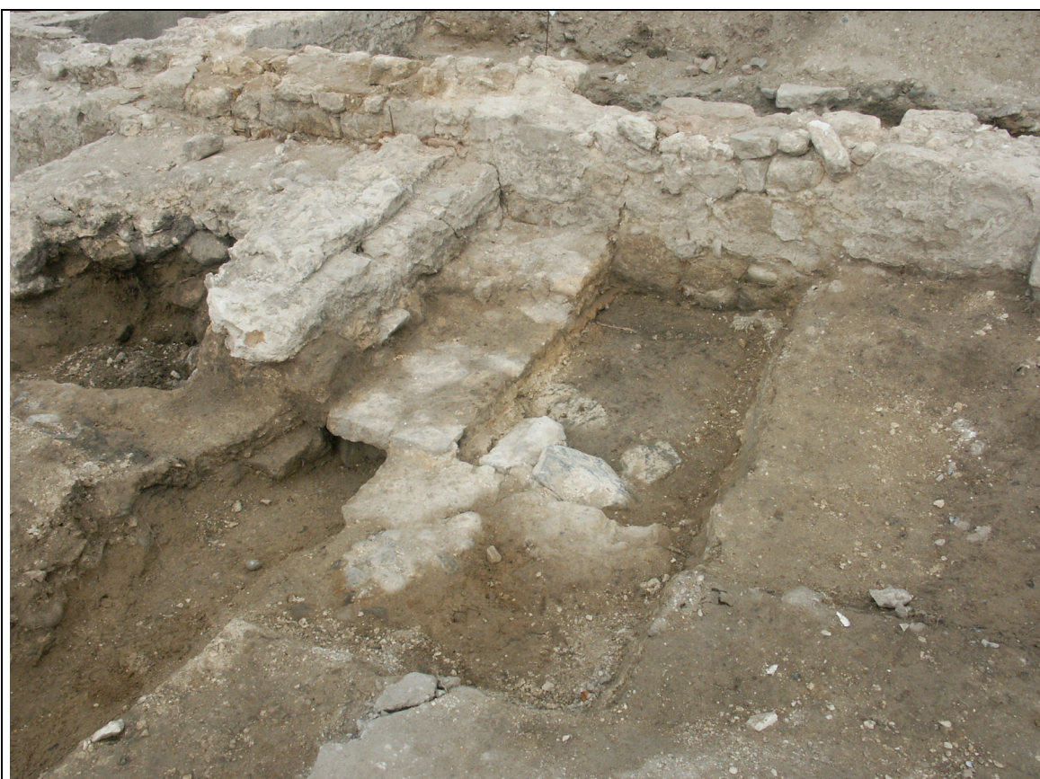
Cliché 6 : dalles 3270, creusement 3216, structure 3/4, mur 8, vue vers l'ouest