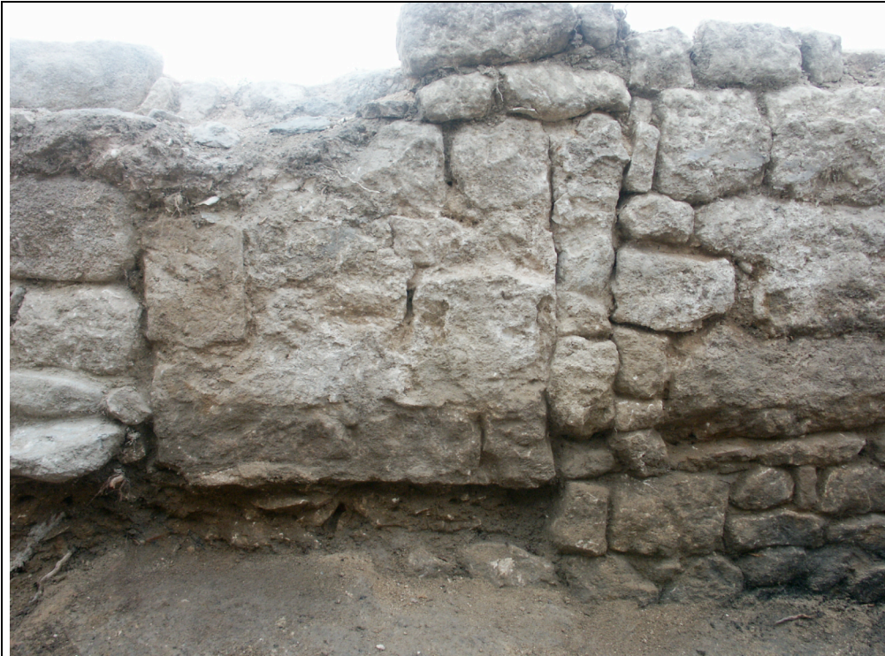
Cliché 9 : mur 8, US 3228/3242, 3252 (emprunte de cloison) et 3256 (rétrécissement de la porte s. 4) (cf. fig. 17)