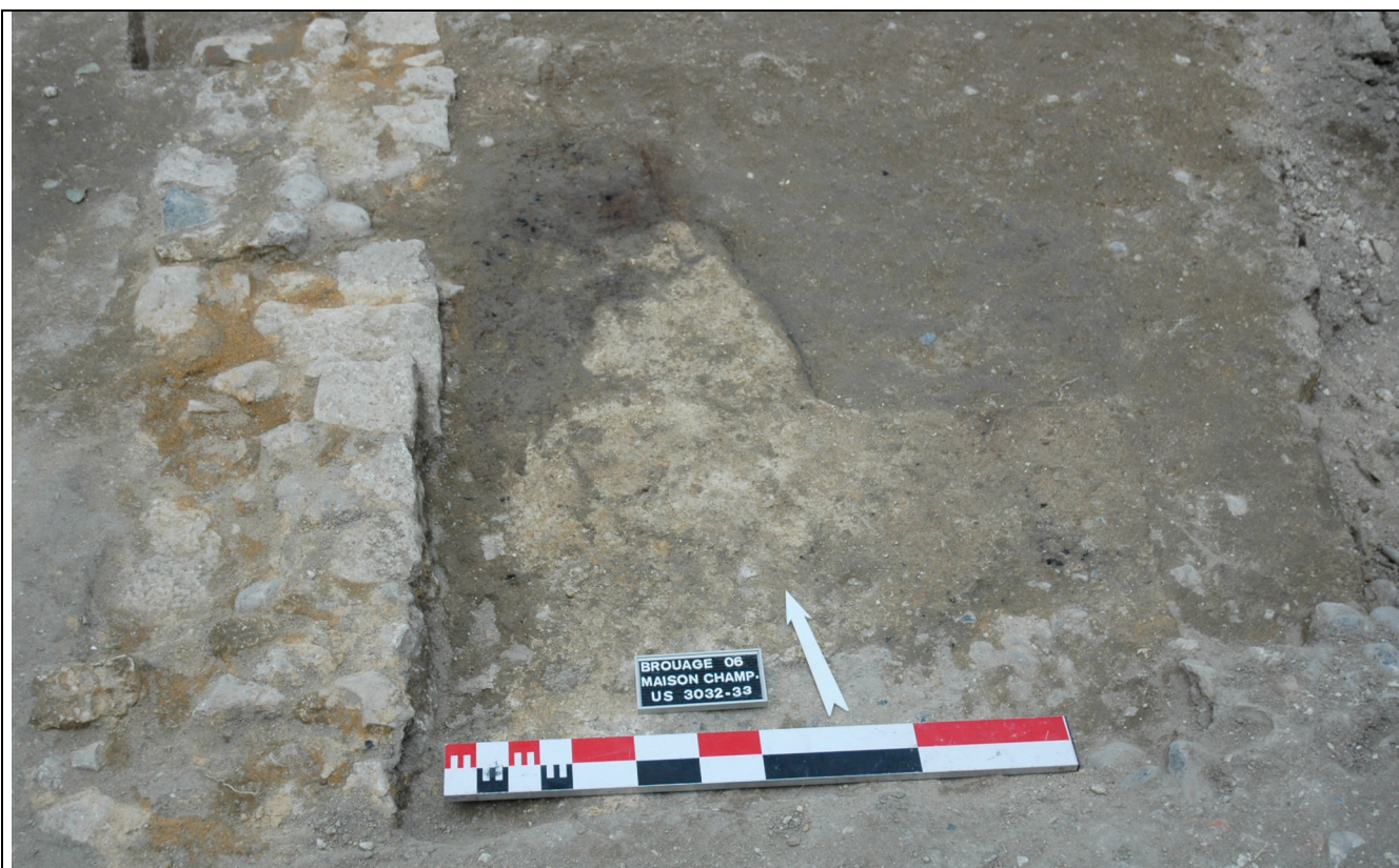
Cliché 13 : sol 3032 et occupation 3033, arase mur 18, salle 7