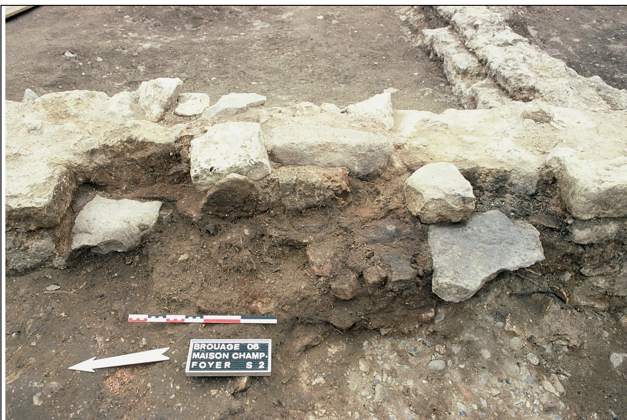
Cliché 16 : cheminée structure 1, 1er état, salle 2, vue vers l'est