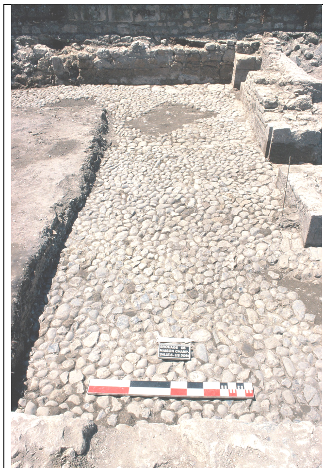
Cliché 20 : sol 3061, salle 5, vue vers l'ouest