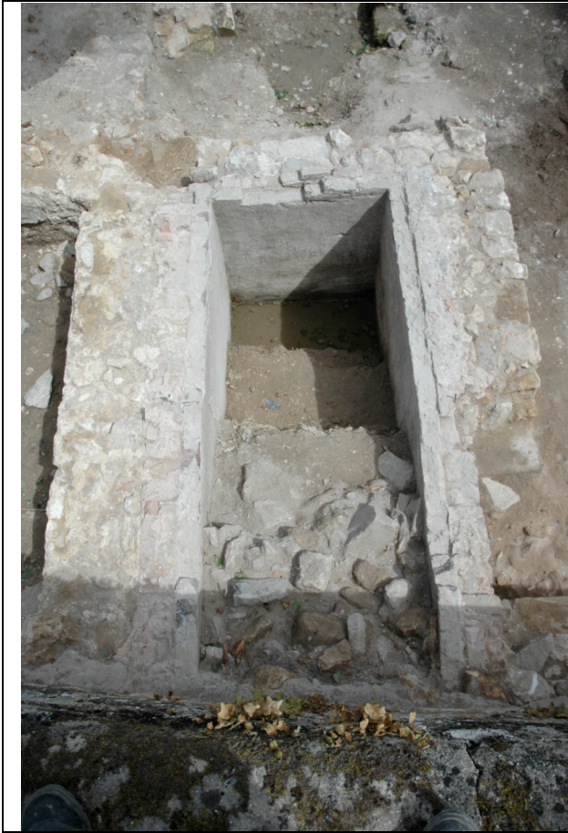
Cliché 21 : salle 1, mur 14, 15 et 16, vue vers l'est