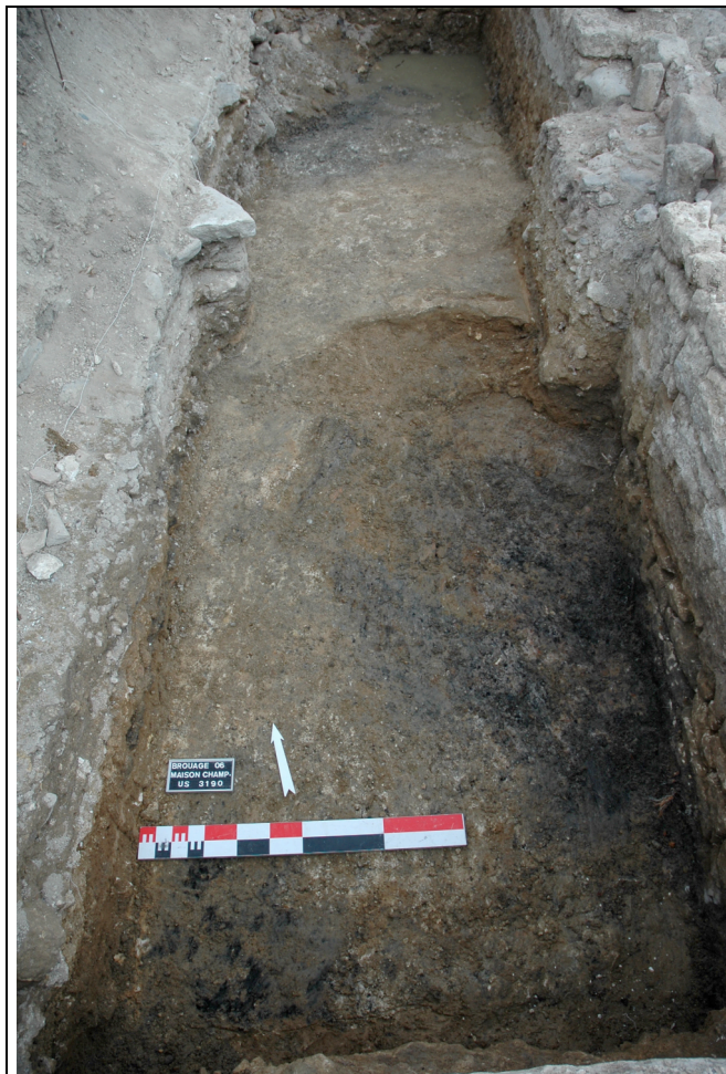
Cliché 4 : sol 3188, occupation 3190, salle 2