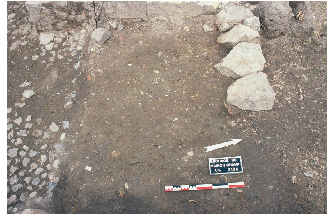
Cliché 19 : niveau induré 3194 et base de la rampe s. 22 et US 3187, salle 8