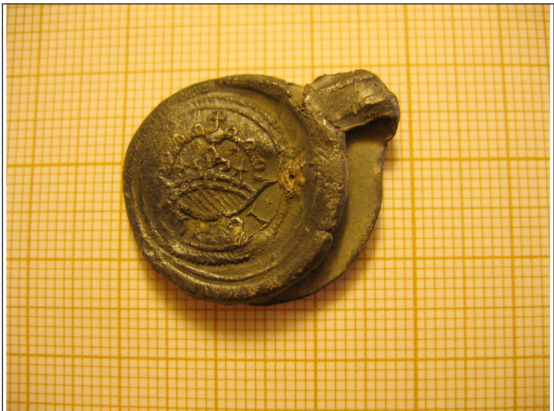
Cliché 26 : Sceau en plomb, n° 64204, US 3172