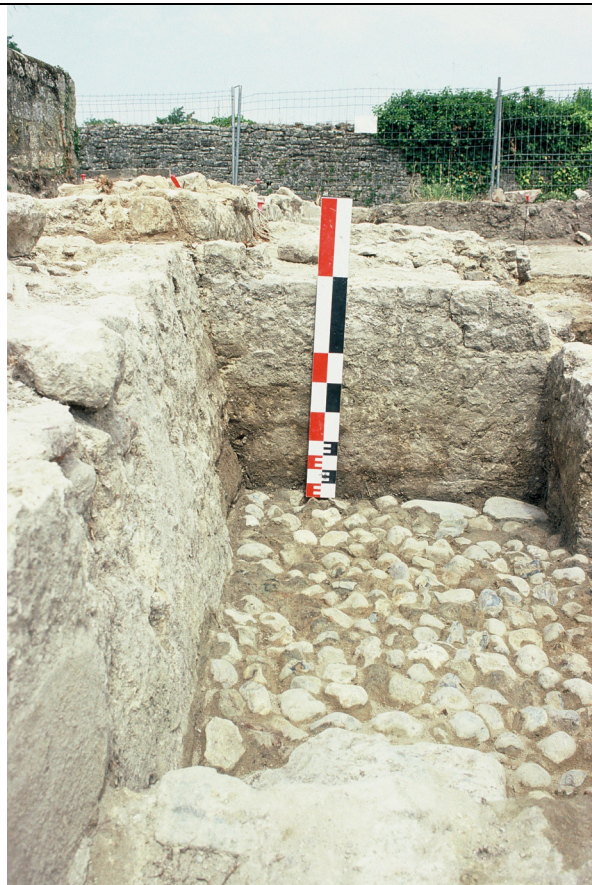
Cliché 10 : glacis du mur 7. Au fond s. \frac{3}{4} (US 3116), salle 4, vue vers le nord