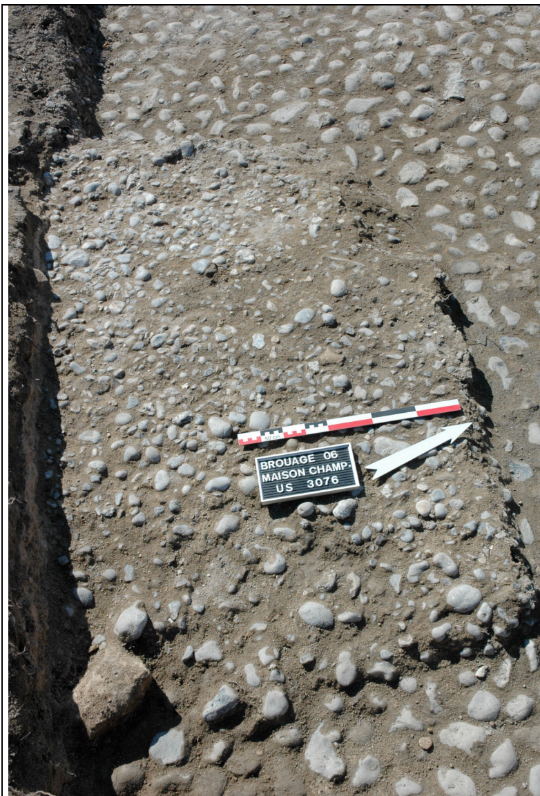
Cliché 24 : sol 3076, salle 5