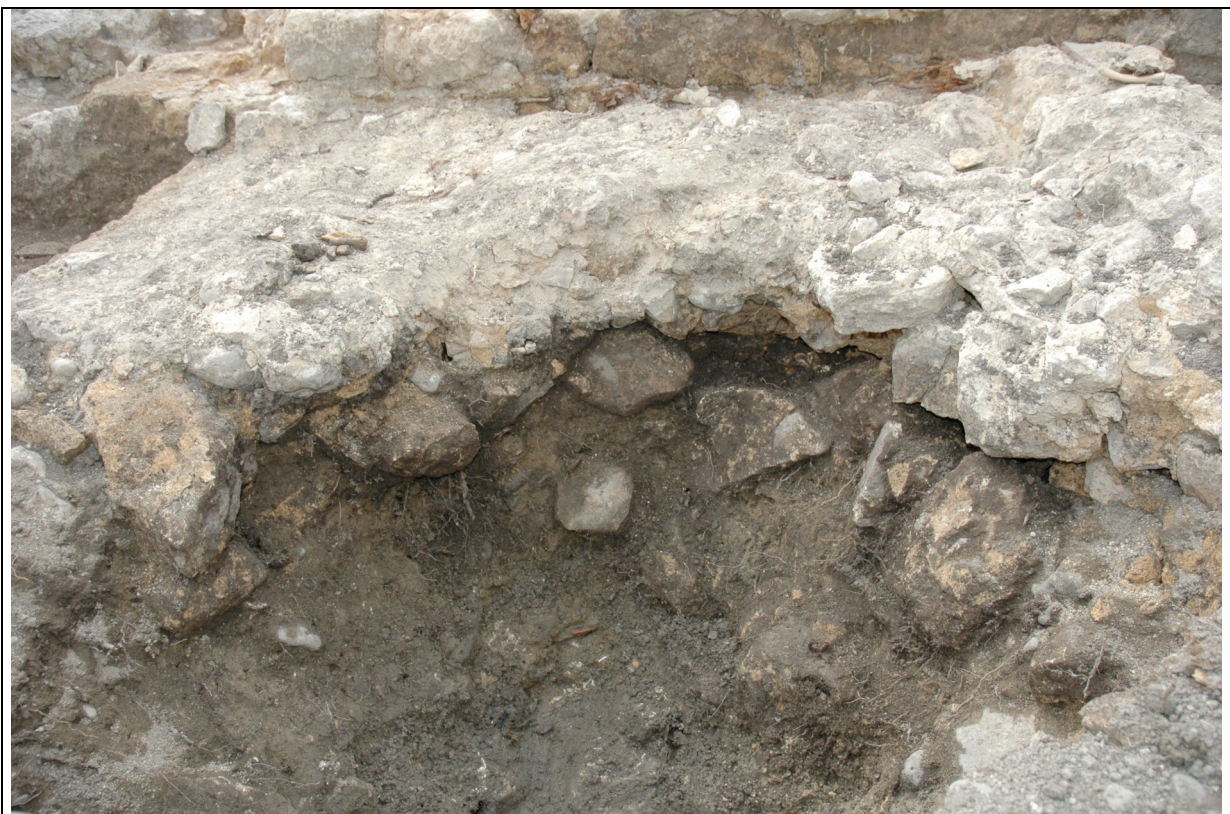
Cliché 12 : structure s. 3/4, maçonnerie 3116/3218, vue vers le nord