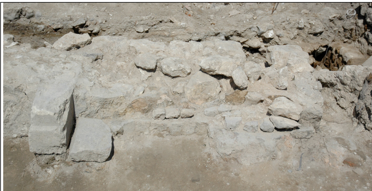
Cliché 14 : cheminée structure 2, salle 3, vue vers l'ouest