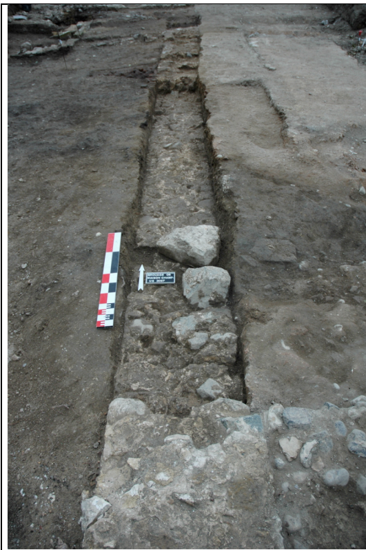
Cliché 22 : tranché de récupération du mur 3