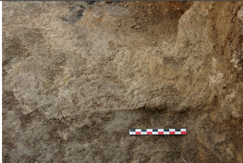
Cliché 23 : cloison 3210, salle 2