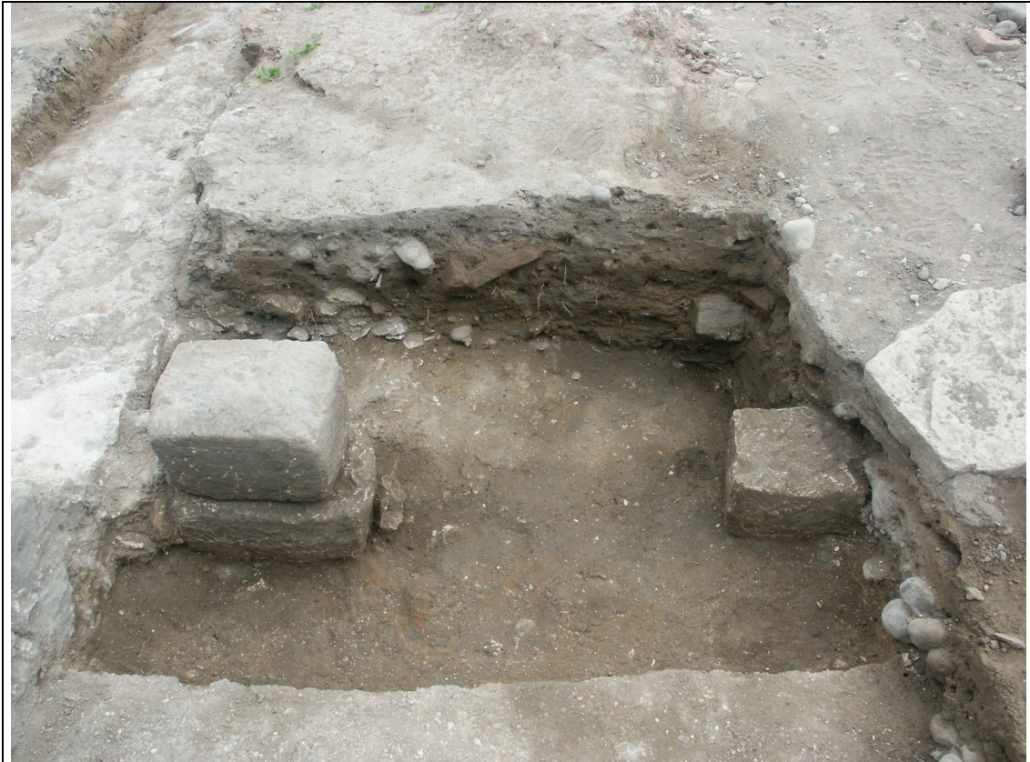
Cliché 7 : blocs 3262, niveau 3099/3257, salle 7, vue vers le nord