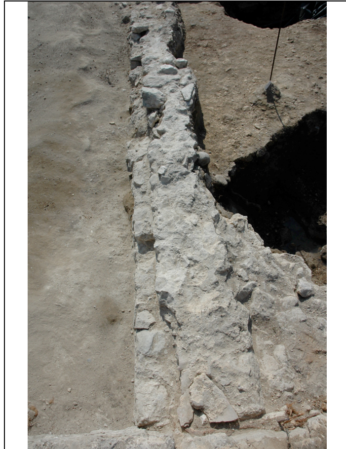
Cliché 17 : muret 9, salle 3 et 8, vue vers l'est