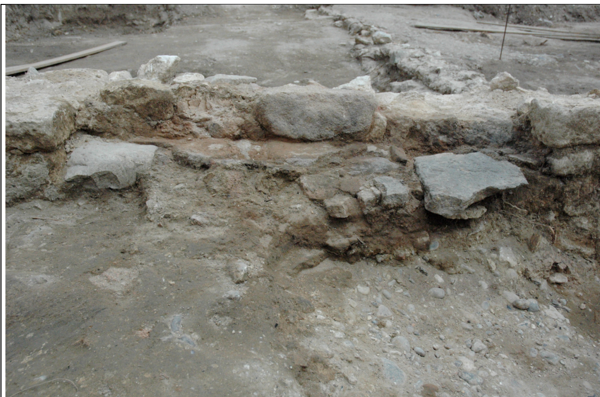
Cliché 15 : cheminée structure 1, 2e état, salle 2, vue vers l'est