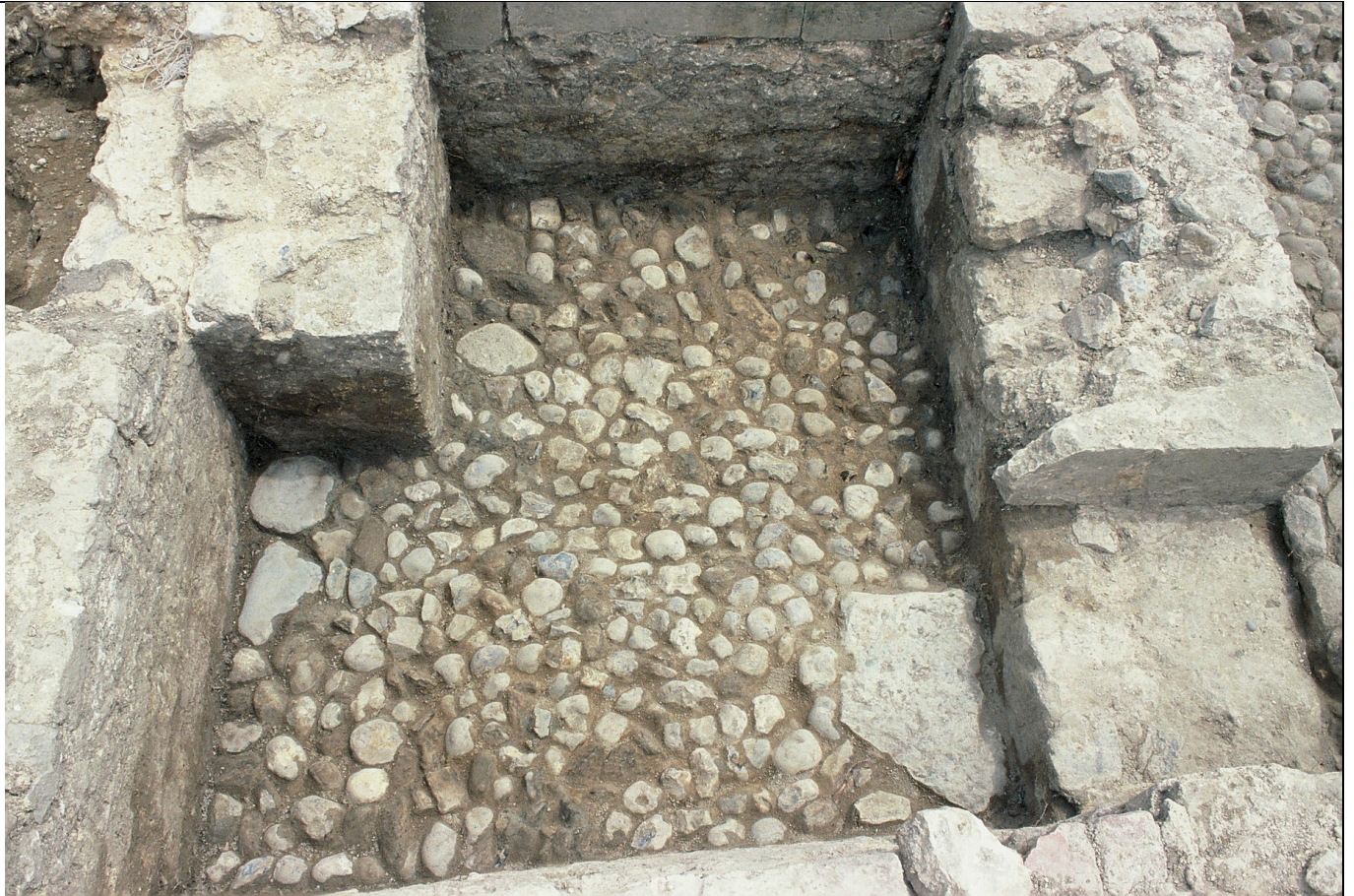
Cliché 11 : sol 3226, salle 4