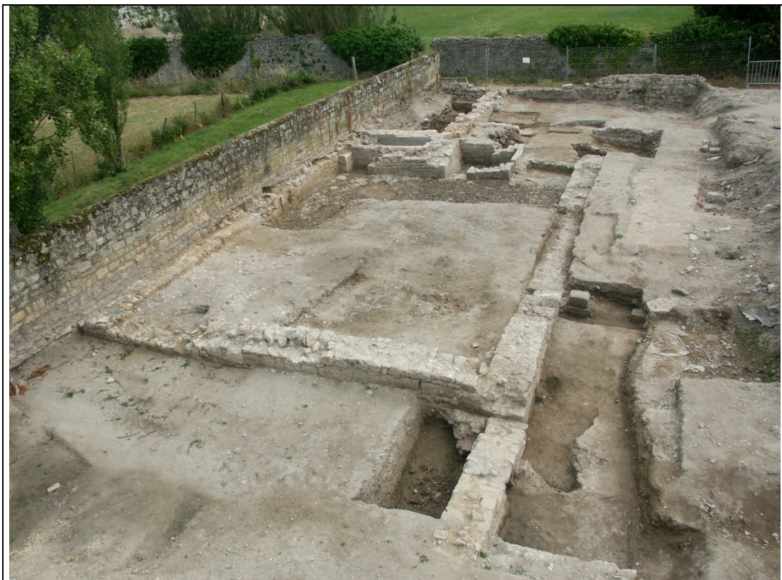
Cliché 2 : Vue générale en fin de chantier, vers le nord