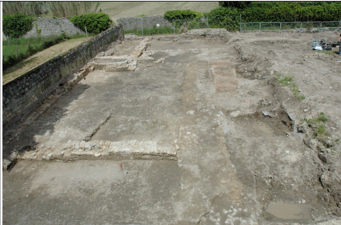
Cliché 1 : Vue générale après décapage, vers le nord