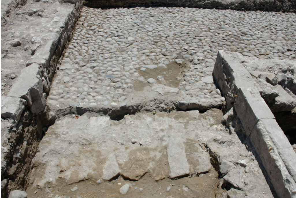
Cliché 3 : porte s. 20, mur 3 et 13, seuil 3200 et sol 3061, vue vers le sud