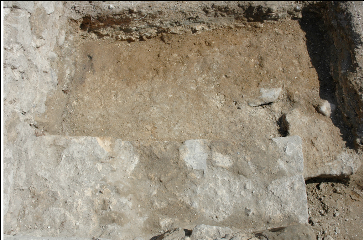
Cliché 5 : sol 3235, maçonnerie 3215, salle 3, vue vers le nord