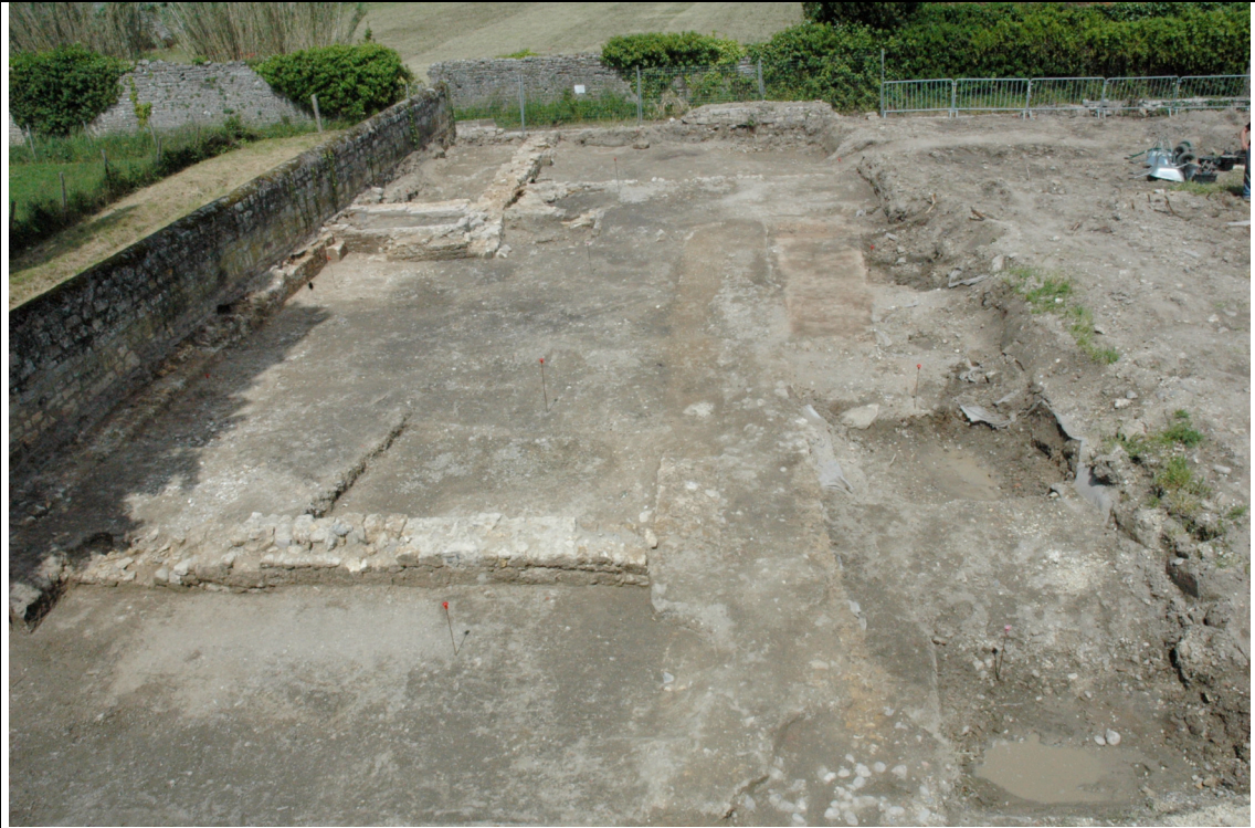
Cliché 1 : Vue générale après décapage, vers le nord