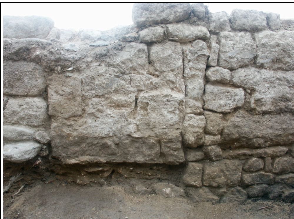
Cliché 9 : mur 8, US 3228/3242, 3252 (emprunte de cloison) et 3256 (rétrécissement de la porte s. 4) (cf. fig. 17)