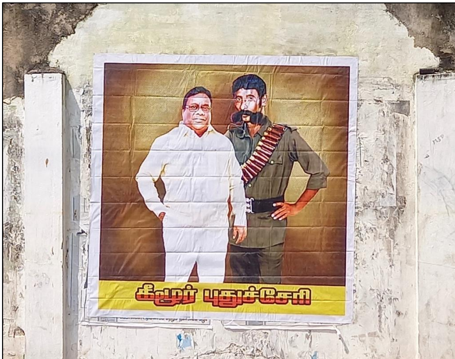
Fig.4. L'image de Veerappan instrumentalisée par un candidat du parti AIDMK aux élections locales (février 2022)

dans la jungle, en menant une vie simple, on dit de lui qu'il faisait montre de compétences exceptionnelles, comme parler aux animaux, reconnaître l'animal au crissement des feuilles jonchées sur le sol : autant de compétences déniées aux agents forestiers. Ces qualités n'empêchent pas qu'il fut aussi un trafiquant soutenu par des politiciens criminels mafieux quoique élus démocratiquement, qui faisaient sortir le bois et l'ivoire de la forêt pour le commercialiser. D'autre part, son engagement régionaliste en faveur du Tamil Nadu, Etat considéré comme victime de la politique fédérale de New Delhi mais aussi de son voisin le Karnataka, a contribué à générer des mémoires antagonistes. D'un côté, Veerappan est « récupéré » encore aujourd'hui par certains politiciens tamouls (fig.4). De l'autre, il avait notamment enlevé la star du cinéma du Karnataka Raj Kumar. Le film Killing Veerappan de 2016, en kannada (la langue du Karnataka), prend clairement position. « Il a fallu 10 ans pour tuer Ben Laden, il en a fallu 20 pour tuer Veerappan », dit la bande-annonce du film hindi qui en sera le remake. Cette figure incarne donc une mémoire environnementale particulièrement conflictuelle, qui permet au chercheur d'explorer les assemblages entre environnement, politique et mafia (Picherit 2019 ; Michelutti et Picherit 2021).