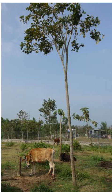
Fig.3. Jeune plantation de santals rouges

Car les mémoires environnementales peuvent être portées par des figures humaines – ou quasi-divines – comme les bandits œuvrant dans les forêts. Figure emblématique du Robin des bois en Inde du sud, Veerappan était un contrebandier spécialisé dans l'ivoire d'éléphant et le bois de santal. Crédité du meurtre d'environ 120 policiers et agents forestiers, il a été assassiné par la police en 2004 après vingt années passées dans la jungle à la frontière du Tamil Nadu et du Karnataka. Il aurait tué plus de 2000 éléphants pour récupérer leurs défenses. Comment un homme dont on dit qu'il a régné sur le trafic d'ivoire, de carrières de pierre et de bois de santal peut-il incarner cette mémoire des forêts, y compris la mémoire de leur protection ?