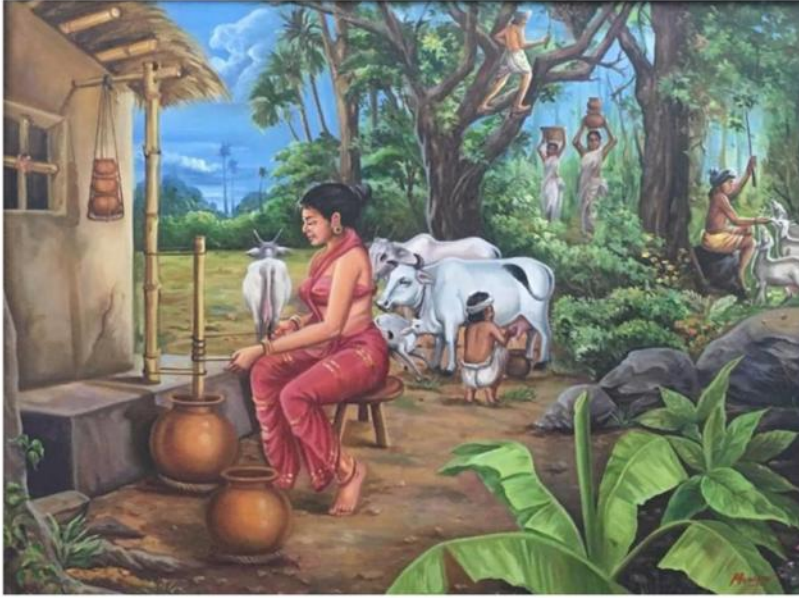
Fig.6 : La poésie du Sangam dans l'imagerie populaire : le tinai forestier appelé mullai (Sangam Art Gallery, Madurai. Photo : C. Rigal)