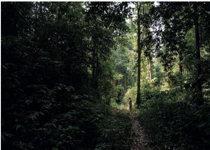
Fig.7 : La poésie du Sangam dans l'œil d'un photographe tamoul contemporain : le mullai vu par G. Sricandane.

Le projet se rapproche de celui du photographe Marc Riboud, parti jadis à la recherche des paysages picturaux du shanshui dans les paysages contemporains des monts Huang (cf. https://fleurdepluieblog.wordpress.com/2016/12/01/peinture-de-montagne-et-deau-peinture-shanshui/ ). Mais le défi ici est encore plus grand, car chez Riboud les paysages des monts Huang ne sont quasiment pas anthropisés, alors que pour notre photographe, Gopinath Sricandane, il s'agit de photographier des milieux transformés, voire industrialisés, et de les confronter avec des paysages décrits par des poètes deux millénaires plus tôt. Le livre, en cours de rédaction, mettra face à face en double page un poème et une photographie contemporaine. Le paysage actuel apparaît alors comme une archive vivante, paysage souvent fonctionnel, mais parfois relique au sens où il a pu être façonné par des activités et des idéologies disparues. Il est alors palimpseste. Mais gardons-nous de prétendre lui faire remonter 2000 ans pour le comparer à ce qui pouvait exister à l'époque des poètes. Dans quelle mesure est-il légitime de mettre en regard des paysages saisis par l'objectif de