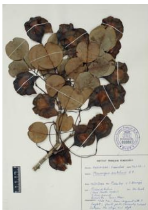
Fig.2. Pterocarpus santalinus dans l'herbier de l'IFP.