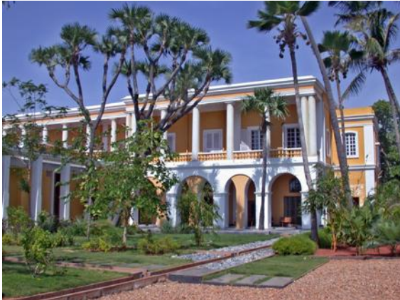
Fig.1. L'Institut Français de Pondichéry

Pourtant, dès son origine en 1955, l'IFP a une origine politique. Il est créé lorsque la France quitte les anciens « comptoirs de l'Inde », notamment Pondichéry, en 1954. Le « traité de cession » signé avec l'Inde laisse à l'ancienne métropole certaines implantations sur le territoire telles que le consulat, le lycée, le monument aux morts... et prévoit la création d'un institut, dans les locaux de ce qui était jusque-là la trésorerie du gouvernement colonial. En 1885, ce petit palais en bord de mer, dont les bases remontent sans doute à la fin du 18 ème siècle, avait été acheté par l'Etat à une famille de négociants d'origine marseillaise, les Amalric, qui avait fait fortune dans le textile puis dans la traite des « travailleurs engagés » vers les îles à sucre (figure 1).