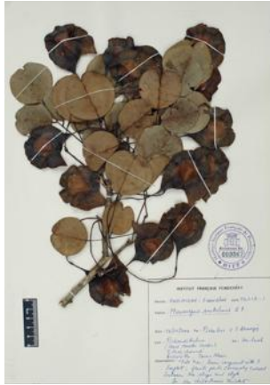
Fig.2. Pterocarpus santalinus dans l'herbier de l'IFP.