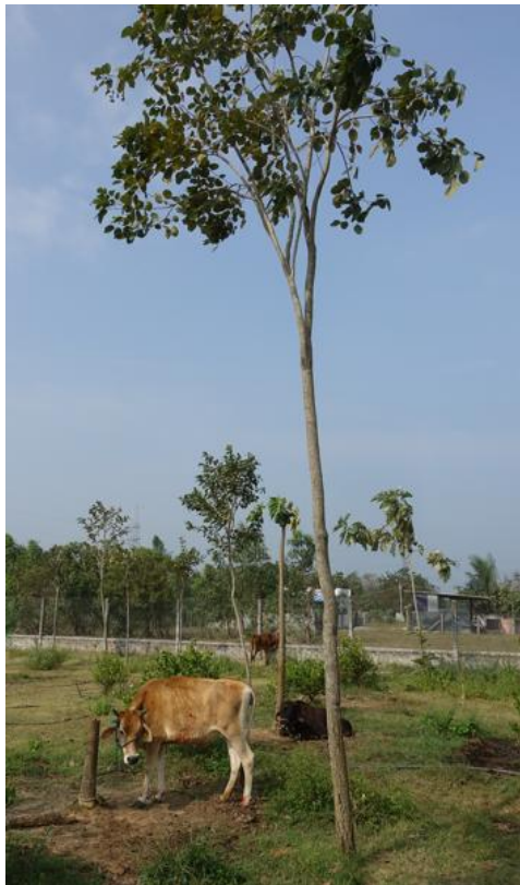
Fig.3. Jeune plantation de santals rouges

Car les mémoires environnementales peuvent être portées par des figures humaines – ou quasi-divines – comme les bandits œuvrant dans les forêts. Figure emblématique du Robin des bois en Inde du sud, Veerappan était un contrebandier spécialisé dans l'ivoire d'éléphant et le bois de santal. Crédité du meurtre d'environ 120 policiers et agents forestiers, il a été assassiné par la police en 2004 après vingt années passées dans la jungle à la frontière du Tamil Nadu et du Karnataka. Il aurait tué plus de 2000 éléphants pour récupérer leurs défenses. Comment un homme dont on dit qu'il a régné sur le trafic d'ivoire, de carrières de pierre et de bois de santal peut-il incarner cette mémoire des forêts, y compris la mémoire de leur protection ?