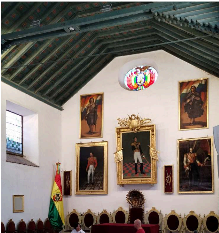
Ana Plaza Roig

Foto 6 – Salón de la independencia, Casa de la Libertad.