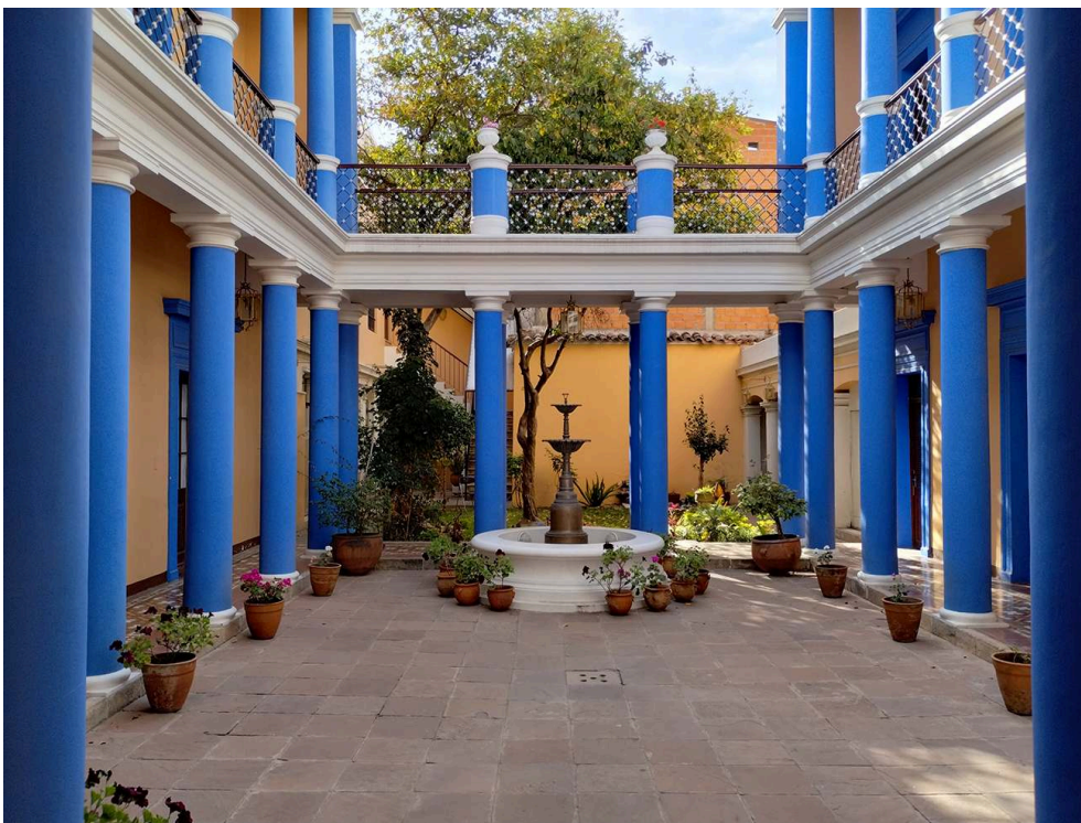
Ana Plaza Roig