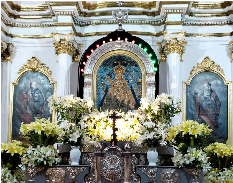
Ana Plaza Roig