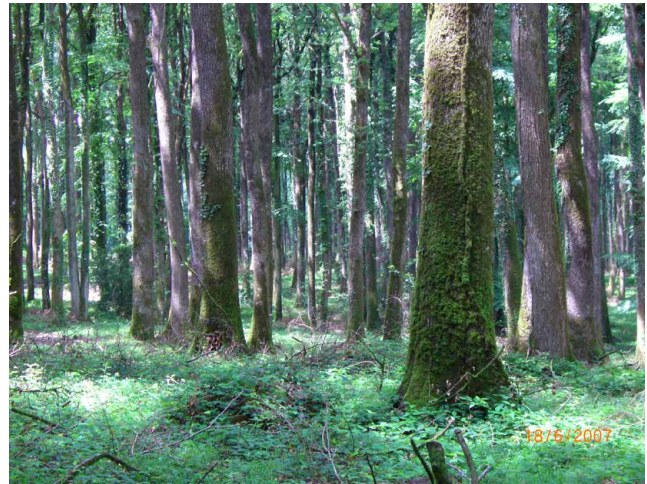
↑ La parcelle 5 en FD de Bellême, avant coupes de régénération : un « mur de bois »

Les contraintes techniques limitant la productivité, avec un effet sur le coût de revient et le prix de prestation potentiel, ont aussi été identifiées, au moins en partie, ainsi que quelques critères techniques ou seuils pour assurer une rentabilité économique. Le détail de cette analyse est paru en 2008 dans le n° 19 des RenDez-Vous techniques (dossier sur l'exploitation respectueuse des sols).