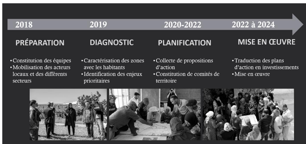
Fig. 1 : Les quatre étapes constitutives de la démarche du programme PACTE

Le programme lui-même, à travers ses coordinateurs et ses financeurs, est porteur d'une double volonté de mettre en place des approches de développement rural plus participatives et plus intégrées, et d'accompagner la dynamique de décentralisation initiée après la révolution tunisienne. D'une manière générale, les territoires ciblés par le PACTE sont des régions marginalisées, tant du point de vue économique que de l'accès aux services publics. Ces territoires sont également confrontés à d'importantes problématiques environnementales (érosion des sols, forte vulnérabilité aux aléas climatiques, etc.). La démarche du programme est organisée suivant une séquence de quatre étapes déployées sur les six territoires cibles.