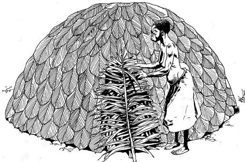
Figure 5. Mongulu à l'état initial

Champolion Miache Evina, Contribution à l'étude de l'habitat traditionnel des populations Baka de la réserve du Dja (Est-Cameroun) du début du XXe au XXIe siècle , Mémoire de Master en Histoire de l'Art, Université de Yaoundé I, 2018, p. 75.