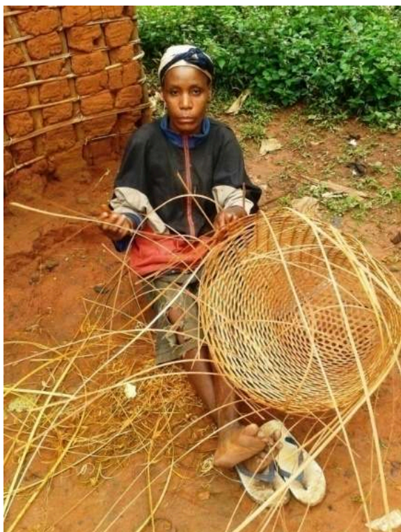
Figure 2. Femme baka à pied d'œuvre

Champolion Miache Evina, Contribution à l'étude de l'habitat traditionnel des populations Baka de la réserve du Dja (Est-Cameroun) du début du XXe au XXIe siècle , Mémoire de Master en Histoire de l'Art, Université de Yaoundé I, 2018, p 38.