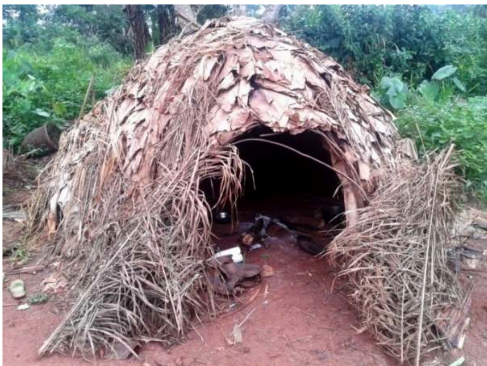
Figure 4. Vue de face d'un Mongulu.

Champolion Miache Evina, Contribution à l'étude de l'habitat traditionnel des populations Baka de la réserve du Dja (Est-Cameroun) du début du XXe au XXIe siècle , Mémoire de Master en Histoire de l'Art, Université de Yaoundé I, 2018, p. 60.