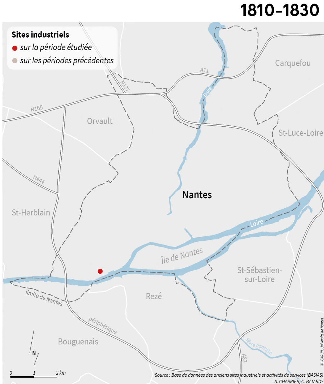
Figure 3 - Évolution de la création des sites industriels sur la commune de Nantes entre 1850 et 2014

Les anciens sites industriels ont pu induire des pollutions des sols. L'inventaire historique national BASIAS (base des anciens sites industriels et activités de service) recense ainsi sur la commune de Nantes la création de 1 935 sites industriels et activités de service entre 1850 et 2014, la période 1951-1990 concentrant les plus nombreuses créations de sites (figure 3). Cet inventaire est complété par la base de données BASOL (Base de données sur les sites et sols pollués), qui recense les sites pollués suivis par les pouvoirs publics. Sur l'île de Nantes, espace central qui a fait l'objet d'un grand projet d'aménagement engendrant de nombreuses opérations d'un projet d'aménagement emblématique, 543 sites ont été recensés sur BASIAS et 4 sur BASOL.