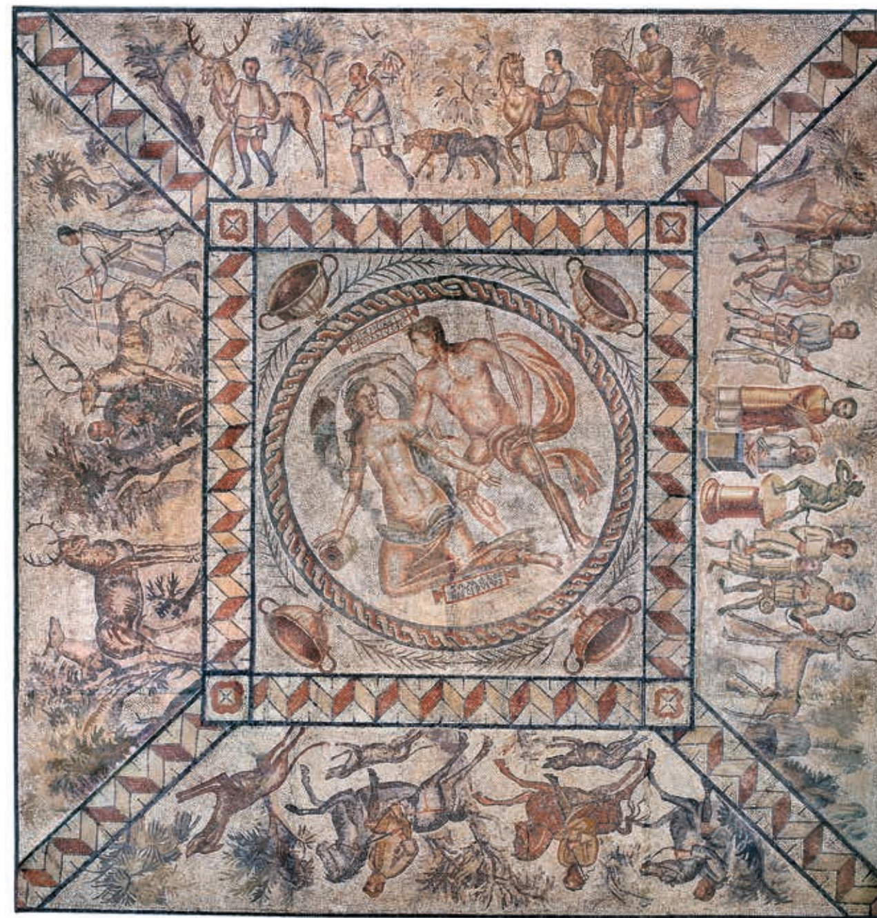
Fig. 5 Mosaïque dite de la chasse aux cerfs, découverte à Lillebonne, III e - IV e siècle, mosaïque, L. 592 x l. 573 cm, Rouen, musée des Antiquités, n° inv. R.90.59.

Cet ambitieux projet de valorisation patrimoniale et touristique du passé romain de Juliobona , centré sur le fleuve, dépasse la simple notion de site archéologique et vise à développer la compréhension d'un territoire organisé. Protéiforme, il associe des actions de recherche 4 , de diffusion des connaissances 5 , de médiation 6 et de rénovation des structures existantes 7 . Cette ambition s'inscrit dans le long terme puisque Caux Seine aggro et ses partenaires se donnent 30 ans pour le voir aboutir dans l'ensemble de ses dimensions. Durant toutes ces années, les actions associeront les habitants du territoire afin de développer l'appropriation du projet par la population et ainsi sa large valorisation 8 .