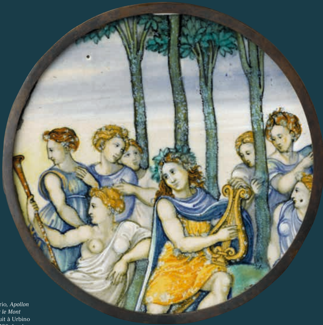
Cat. 39 Nicolas Pellipario, Apollon et les Muses sur le Mont Parnasse , produit à Urbino (Italie), 1525-1528, fond de plat, majolique, h. 5 x diam. 13,6 cm, Paris, musée du Louvre, n° inv. OA1244.