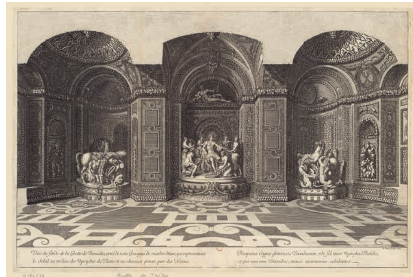
Fig. 54 Jean LePautre, La grotte de Thétis à Versailles , 1676, gravure, eau-forte, Paris, Bibliothèque nationale de France, n° inv. FT 4-VA-423 (1).

La grotte de Thétis* (fig. 54), désormais disparue, représente selon Sabine du Crest, à Versailles, « le plus grand lieu de concentration du signe apollinien [...] non pas tellement par les représentations d'Apollon et des chevaux du soleil dans l'ancre marine de Thétis mais parce qu'elle donnait la possibilité matérielle de percevoir l'harmonie de l'univers » 3 . André Félibien (1619-1695), précieux témoin, confie qu'« il semble qu'on voye une image parfaite du concert de tous les Éléments, et qu'on ait trouvé l'Art de faire entendre dans ce lieu-là cette Harmonie de l'Univers, que les poètes ont représentée par la lyre d'Apollon, comme celui qui règle les Saisons, et qui tempère les Éléments » 4 . Décrivant les jets d'eaux, les globes de cristal et les jeux de miroir, il évoque « un amas confus de gouttes et d'atomes d'eau, qui semblent se mouvoir dans ce lieu-là, comme les atomes de lumière qu'on découvre dans les rayons du soleil »,