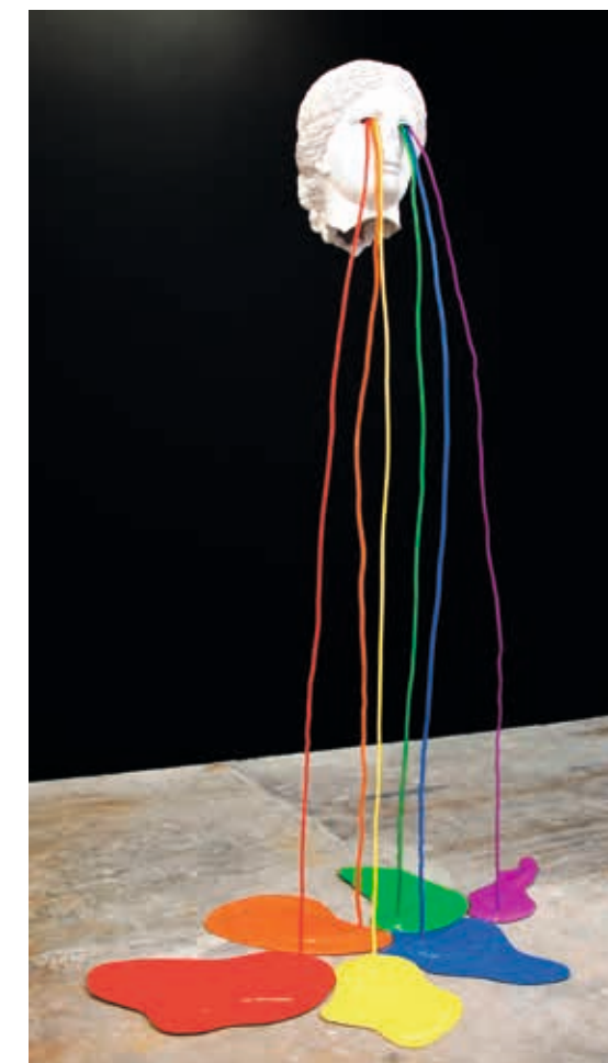
Cat. 118 Laurent Perbos, Niobé , 2013, plâtre polyester, acier thermolaqué, h. 179 cm, Marseille, atelier de l'artiste, avec l'aimable autorisation de la galerie Baudoin Lebon.