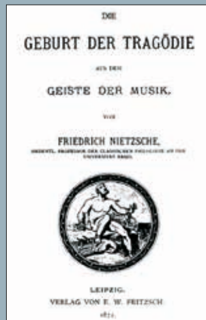
Fig. 171 Friedrich Nietzsche, Die Geburt der Tragödie aus dem Geiste der Musik , Leipzig, Verlag von E.W. Fritsch, 1872, couverture de la première édition.