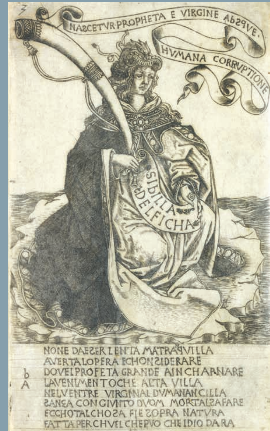
Fig. 82 Baccio Baldini, Sibylle Delphique , vers 1470, gravure, h. 17,8 cm, l. 10,7 cm, Paris, musée du Louvre, collection Rothschild, n° inv. 3752 LR/recto.

tout son corps, lui remplissant le cerveau de fureur devineresse » 2 . De fait, outre ses fonctions de dieu du soleil, de la musique et de la poésie, c'est aussi son rôle oraculaire que véhiculent les textes de la Renaissance. Cette dimension prophétique, si elle est moins prégnante dans l'iconographie d'Apollon à l'époque moderne, est néanmoins diffusée autour de la représentation de quelques lieux : Delphes avec la Pythie et Cumes avec sa Sybille, qui incarnent le pouvoir divinatoire d'Apollon, le mont Parnasse* consacré au dieu et aux neuf Muses*. Apollon est volontiers figuré comme principe d'harmonie : il est celui qui met en relation les arts et les sciences et unit terre et ciel, à l'exemple de la carte XX des tarots dit de Mantegna (fig. 51) 3 . Dans ce tarot, le dieu ferme la série consacrée aux Muses, suivie de celle des arts libéraux et des sciences ; il est assis entre deux cygnes, les pieds posés sur une sphère céleste et terrestre. Outre cette sacralisation des arts attachée à l'iconographie oraculaire, les artistes représentent souvent à des fins exemplaires ou idéologiques un épisode qui symbolise le pouvoir purificateur d'Apollon : son combat contre le serpent Python*.