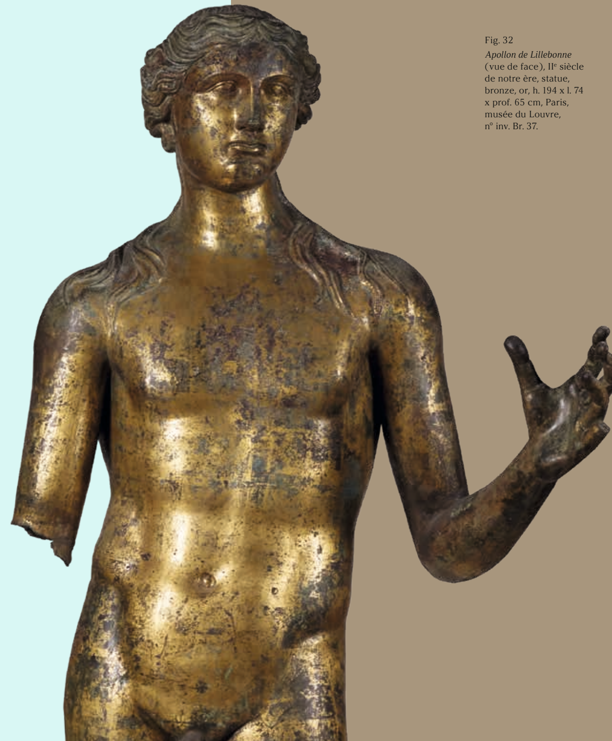
Fig. 32 Apollon de Lillebonne (vue de face), II e siècle de notre ère, statue, bronze, or, h. 194 x l. 74 x prof. 65 cm, Paris, musée du Louvre, n o inv. Br. 37.

L'analyse stylistique de l'œuvre oriente vers une production provinciale du II e siècle de notre ère. En effet, malgré le contrapposto qui évoque les