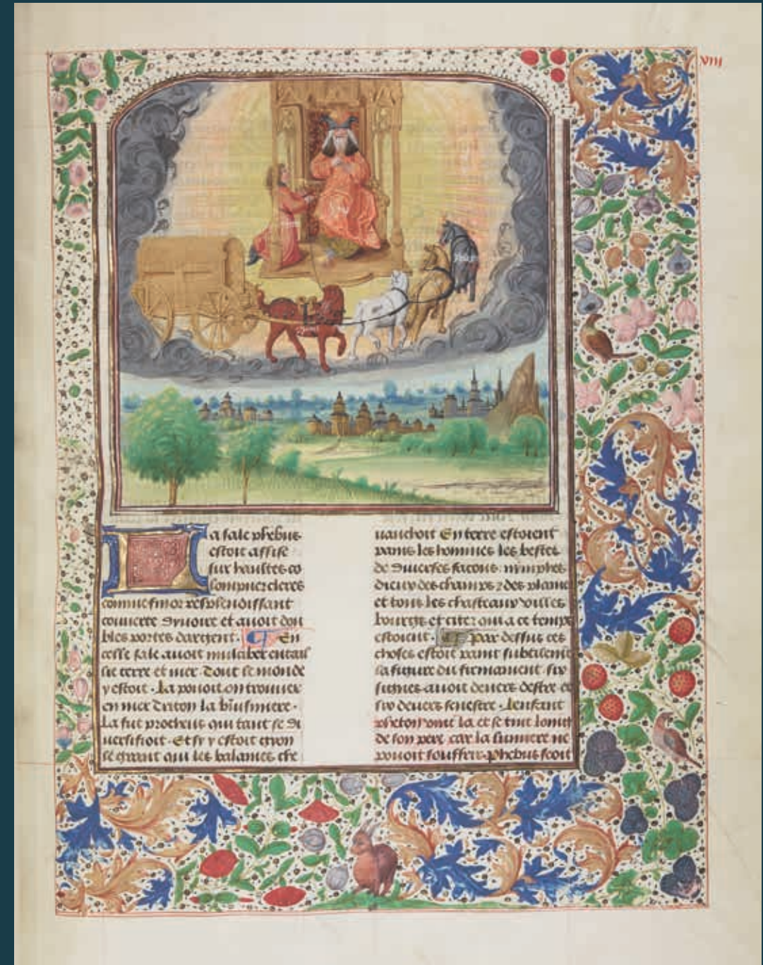
Fig. 130 Maître de Marguerite d'York (enlumineur), Ovide moralisé en prose II , XV e siècle, manuscrit, Paris, Bibliothèque nationale de France, fr. 137, f. 13r: Phébus et Phaéon.

Chez les auteurs médiévaux, le rapprochement entre Apollon et le dieu Soleil souligne souvent la capacité d'Apollon à apporter la lumière sur ce qui est obscur, tant au niveau de la perception visuelle qu'au niveau de la perception intellectuelle. Simon de Hesdin, se rattachant au portrait d'Apollon dressé par Fulgence ( Mitologiarum libri tres , I 12), le souligne dans sa glose à la traduction française de Valère Maxime: I, 1, 18 « Acer etiam [Glose] ... les paiens anciennement avoient entre leur autres diex un qui estoit appelé Appollo, et est a dire le soleil, et le appelloient le dieu de divinacion ou pource, ce dist Fulgence ou premier livre des Mithologies, que le soleil par sa lumiere montre les choses qui estoient obscures, ou pource que l'arc en ciel qui est causés de li a plusieurs significacions et aussi ont les couleurs... » 3 .