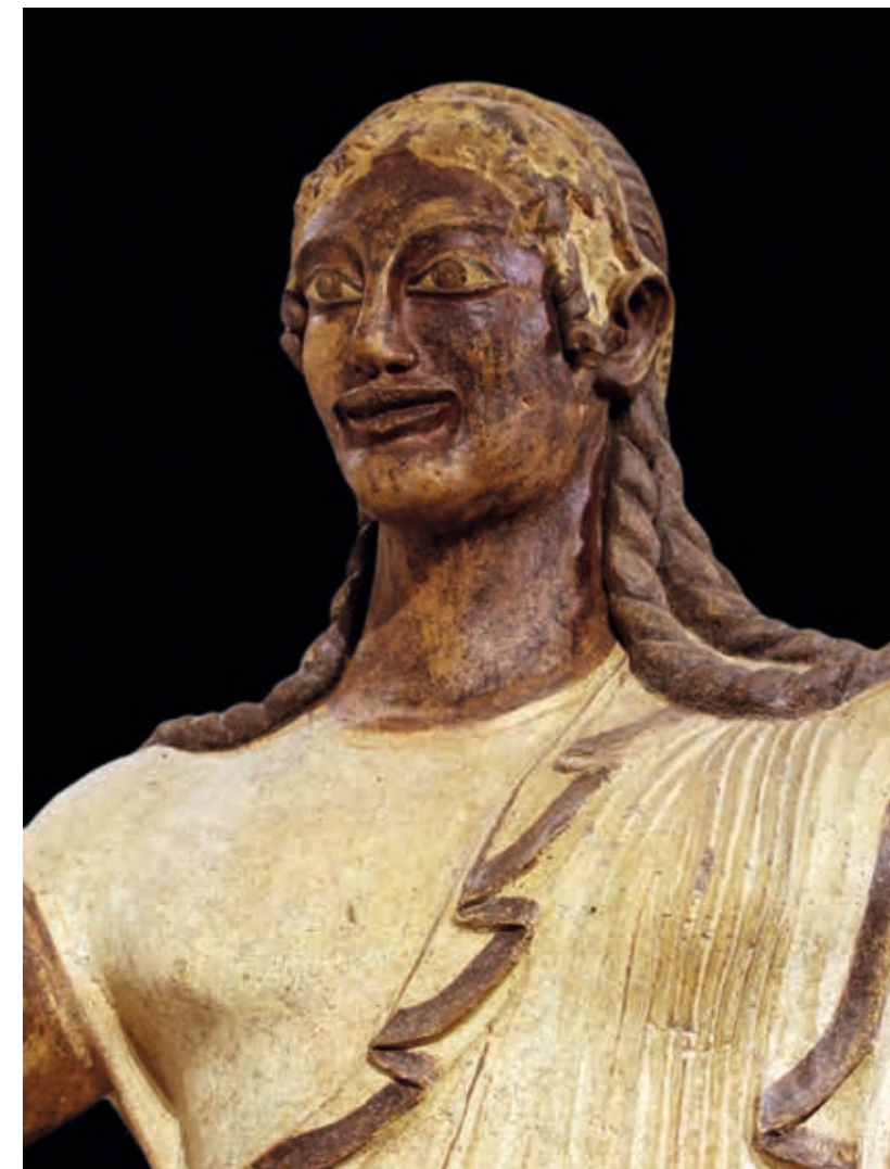
Fig. 7 Attribué à Vulca, L'Apollon étrusque de Véies, VI e siècle av. notre ère, statue acrotère, terre cuite, Rome, Musée national étrusque de la villa Giulia, n° inv. 40702.

Davantage pensé comme un manuel que comme un catalogue, le présent ouvrage a été conçu de manière à accompagner et à compléter l'exposition : les lecteurs et lectrices y trouveront des contributions variées produites par des spécialistes des différentes périodes, alternant synthèses et études de cas. Chacune fait appel aux prêts exceptionnels consentis pour cet événement, mais aussi à de nombreuses œuvres citées à titre de comparaison pour offrir un portrait riche et nuancé du dieu. Elles s'accompagnent d'une riche bibliographie qui fournit autant de pistes pour poursuivre la réflexion.