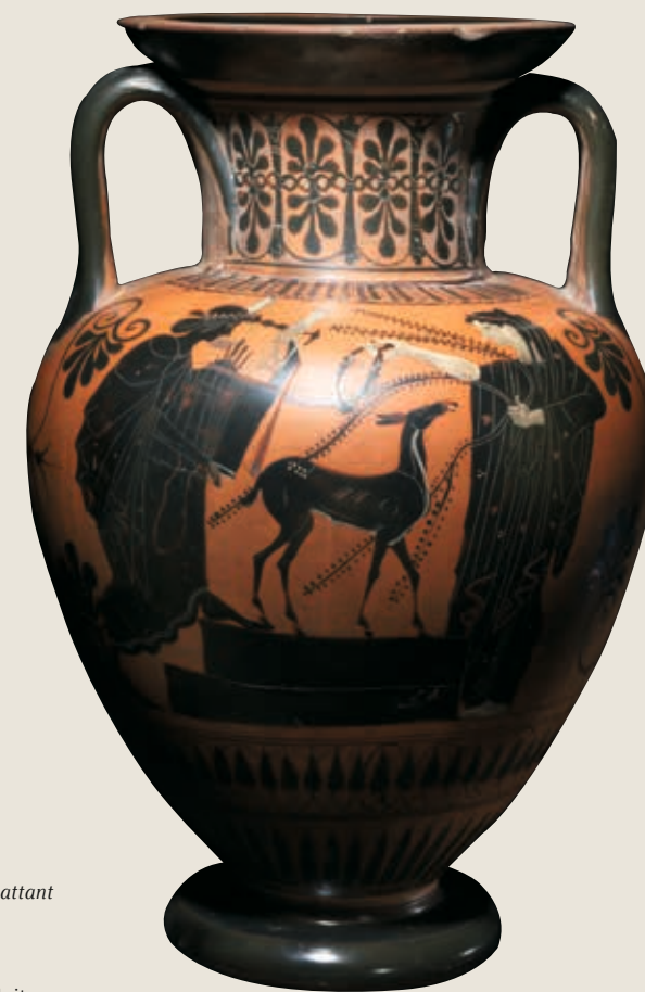
Cat. 42 Face A: Athéna combattant Enkélados / Face B: Apollon citharède et Artémis, découverte à Vulci (Italie), produite à Athènes (Grèce), vers 510 av. notre ère, amphore attique, céramique à figures noires, h. 40,9 cm x diam. 27 cm, Rouen, musée des Antiquités, n° inv. 358 (A).