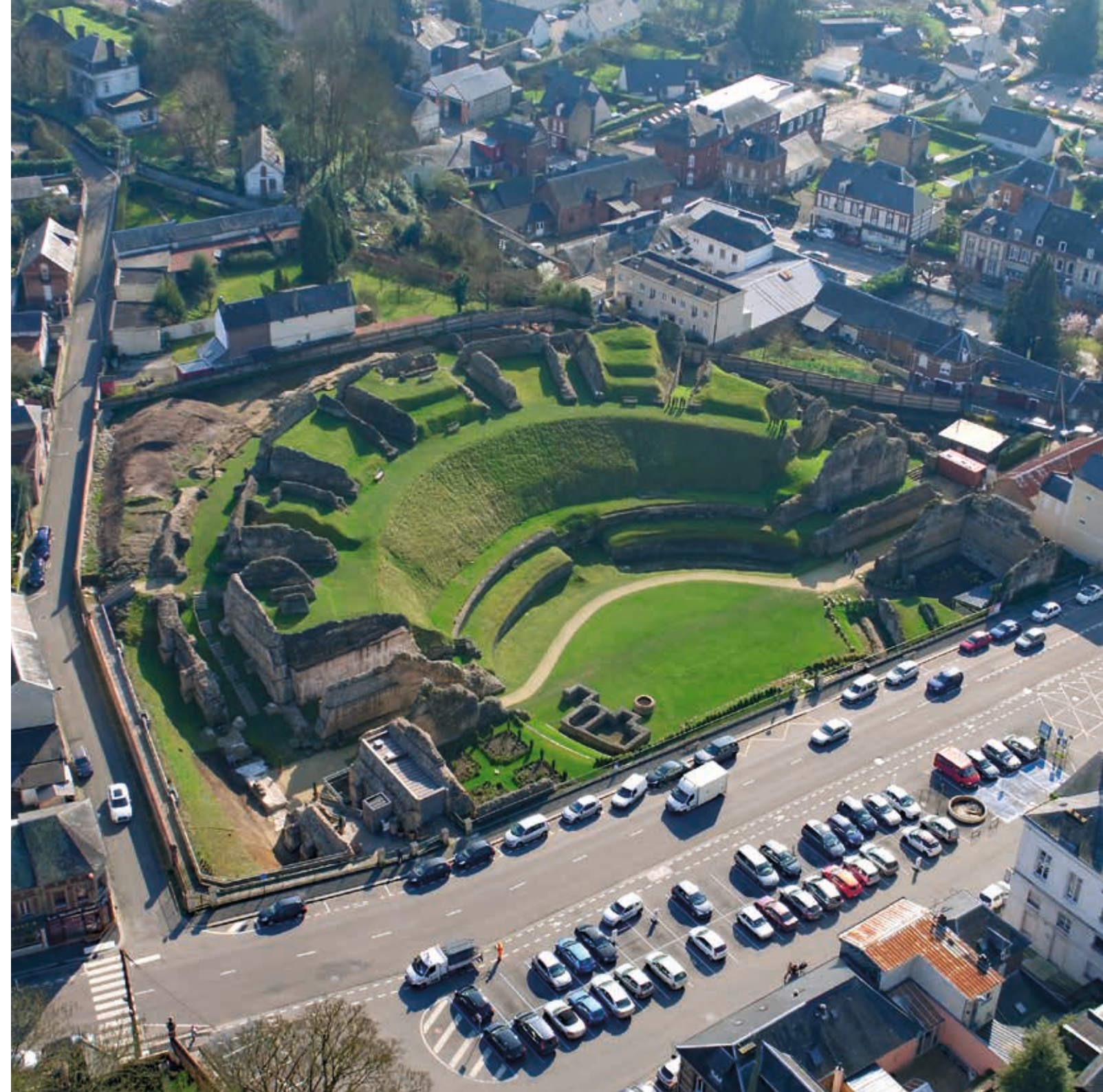
Fig. 3 Le théâtre de Juliobona .