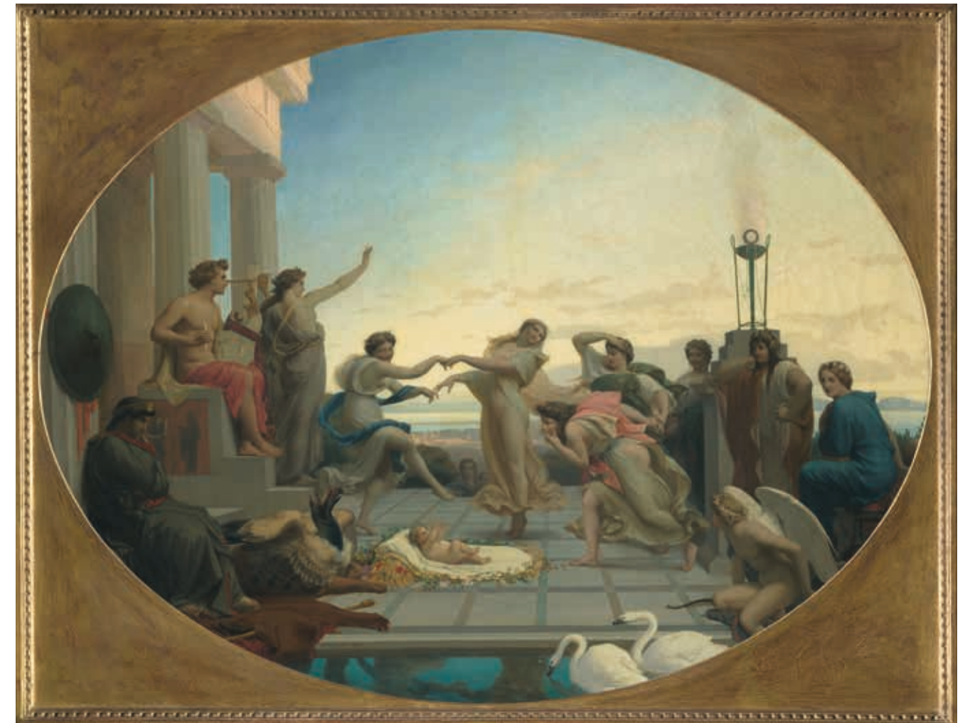
Cat. 63 Henri-Pierre Picou, La Naissance de Pindare , 1848, huile sur toile, h. 114 x L. 146,5 cm, Paris, musée d'Orsay, n° inv. RF 2008 55.

Donc à priori, la figure d'Apollon, même dans son frottement avec Dionysos*, est plutôt une figure dont je me méfie. Apollon, c'est celui qui donne la forme plastique au chaos dionysiaque, il incarnerait la figure du plasticien comme on la conçoit aujourd'hui, mais au-delà de cela, il incarne aussi la raison et un certain idéal qui est à mes yeux aussi dangereux que séduisant. Apollon est aussi le dieu de la clarté, de la vision et de la connaissance, je lui préfère Dionysos et ses excès, dieu du vin, de la folie et de la démesure.