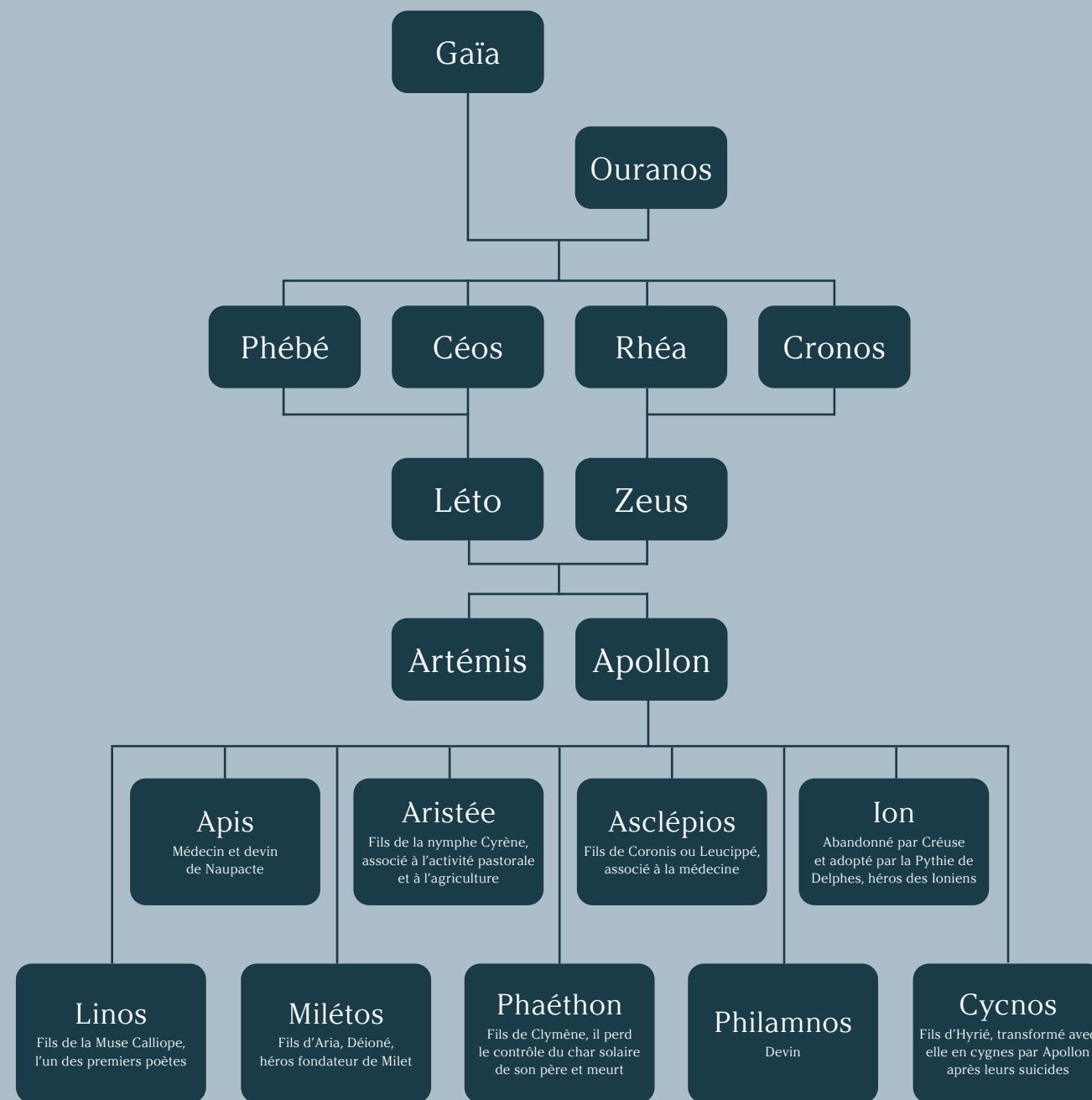
Fig. 8 Proposition d'arbre généalogique d'Apollon. Toutes les versions du mythe n'ont pas été prises en compte.

Afin d'ouvrir cet ouvrage de manière concrète et vivante à la création actuelle, nous avons invité plusieurs artistes à s'exprimer dans la dernière partie afin qu'ils éclairent d'autres visages et d'autres zones d'ombre de leur divin patron. L'artiste Léo Caillard revient sur ce dieu mythique dont il vient puiser les formes et les discours pour produire ses œuvres teintées d'humour. Stephen Chappell construit quant à lui un pont entre art et recherche, combinant les recherches récentes sur la polychromie* antique et ses talents d'artiste pour proposer une vision complète et inédite de l' Apollon du Belvédère , auquel il redonne ses fragments perdus, ses accessoires de bronze et ses couleurs. L'artiste Pascal Lièvre, dont les œuvres pailletées sont aisément reconnaissables, analyse quant à lui sa relation à Apollon et Dionysos autour de son œuvre Voguing Picou . Enfin, Rachel Smythe, autrice de la bande dessinée Lore Olympus revient sur le portrait négatif mais nuancé qu'elle fait d'Apollon, violeur et manipulateur, dans son récit qui entremêle avec brio la mythologie grecque et la société actuelle.