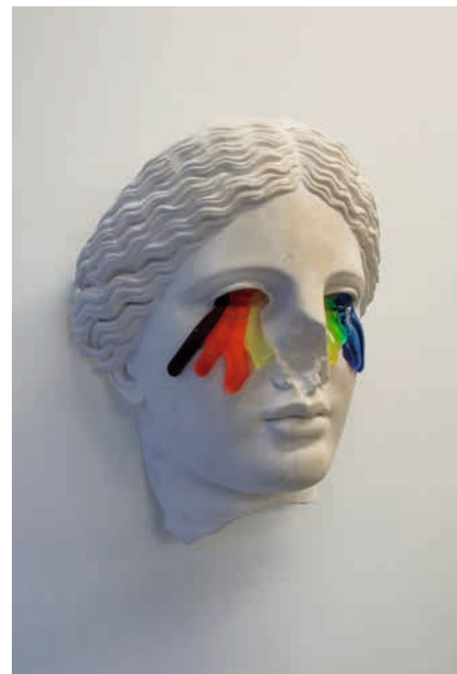
Cat. 117 Laurent Perbos, Niobides , 2013, plâtre polyester, verre, h. 30 x l. 18 cm, Marseille, atelier de l'artiste, vue de l'exposition à la Lambert Gallery, Bruxelles.