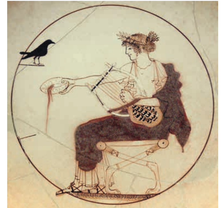
Fig. 6 Attribuée au Peintre de Pistoixénos, Apollon citharède versant une libation , vers 460 av. notre ère, médaillon d'une coupe attique, céramique à fond blanc, diam. 18 cm, Delphes, Musée archéologique, n° inv. 8140.

Au-delà de l'inscription de ce projet dans une tradition artistique pluriséculaire et du caractère original de son approche, dédier une exposition à Apollon pour présenter toute la complexité du dieu, de sa représentation et de sa réception est, à notre connaissance, un projet inédit 11 . Il permet de réunir au sein d'un musée archéologique des objets et des œuvres qui dépassent très largement le cadre de la période romaine. L'exposition vise par là même à attirer un large public, en réunissant en un même lieu néophytes et spécialistes. Présenter la complexité de ce dieu dont la figure n'a cessé d'inspirer l'imaginaire depuis près de 3000 ans sur 160 m 2 d'espace d'exposition représente un grand défi. Sans prétendre à l'exhaustivité – aurait-elle seulement été atteignable tant le sujet est vaste? –, les commissaires de l'exposition ont imaginé un parcours au travers duquel dialoguent près de 70 œuvres dont la variété réside autant dans la nature que dans le style ou la chronologie. Issues d'institutions nationales (la Bibliothèque nationale de France, le musée du Louvre et le musée d'Orsay), d'importantes musées régionaux, mais aussi de galeries d'art ou encore prêtées par des artistes contemporains français et internationaux, toutes offrent des éléments de réponse à la question « Qui es-tu, Apollon? ».