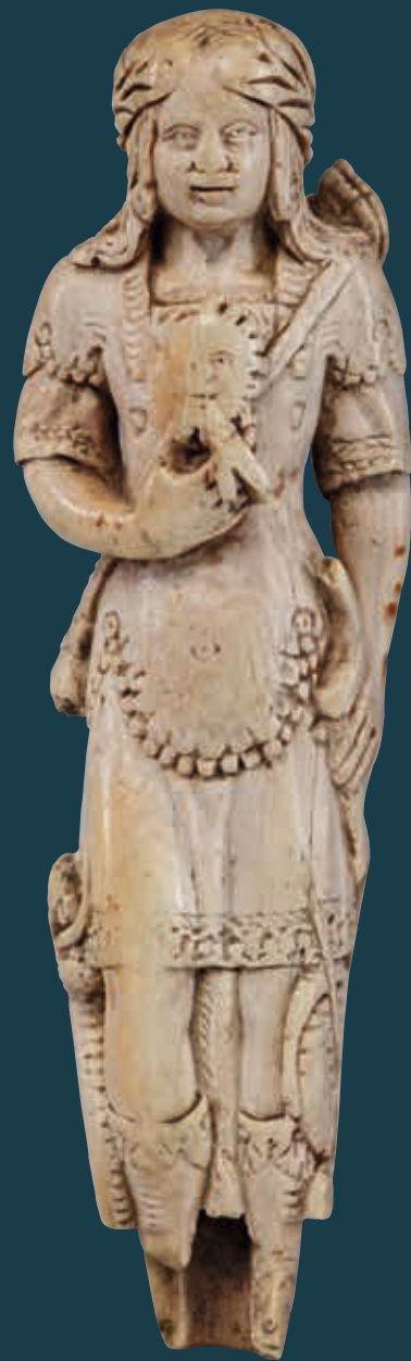
Cat. 70 Apollon tenant un arc avec à ses pieds le serpent Python, XVII e siècle, manche de couteau, ivoire, h. 9 x l. 2,6 x prof. 2 cm, Angers, musée des Beaux-Arts, n° inv. MA 5er 1073.