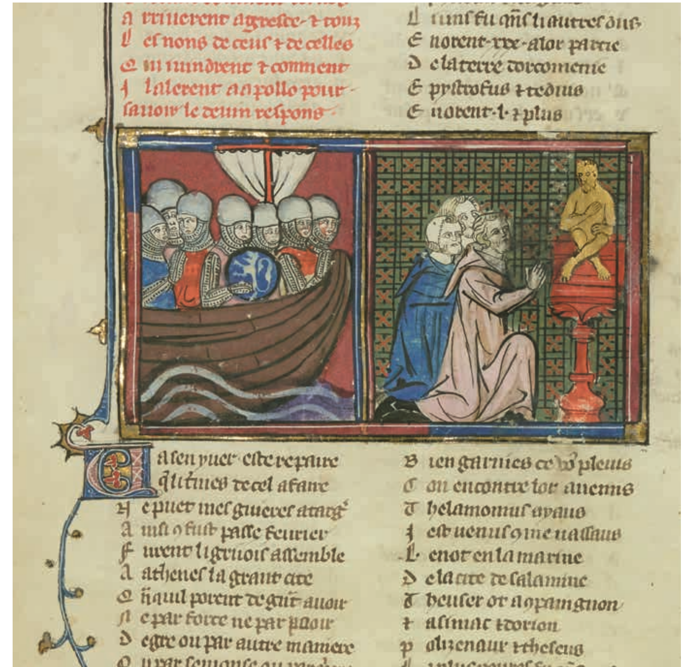
Fig. 77 Benoît de Sainte-Maure, Roman de Troie , « Ci devise comment les nés arriverent a Gresce et touz les nons de ceus et de celles qui vindrent et comment il alerent a Apollo pour savoir le devin respons », vers 5775-5780, 2 e quart du XIV e siècle, manuscrit, Paris, Bibliothèque nationale de France, fr. 60, f. 63r.

Si, jusqu'aux XII e et XIII e siècles, l'accueil réservé aux dieux de l'Antiquité chez les auteurs médiévaux est assez tiède 8 , voire explicitement négatif, progressivement, la perception du mythe antique évolue. Bien que les idoles païennes soient toujours considérées avec méfiance 9 , le culte des Anciens commence à être abordé comme un phénomène de croyance et non plus comme une opposition entre le bien et le mal. C'est dans cette perspective que, à partir du XIV e et surtout du XV e siècle, on assiste à la redécouverte des personnages historiques et mythologiques grecs, qui s'accompagne d'un important effort de traduction en français des textes de l'Antiquité. Les médiévaux donnent alors une nouvelle actualité aux figures mythologiques antiques, dont les exploits fascinent le public savant et offrent un modèle exemplaire aux gouverneurs. Le thème de la translatio studii , c'est-à-dire de la transmission du savoir et de la sagesse depuis l'Orient vers l'Occident, devient un topos