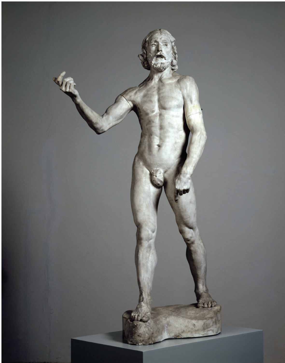
Auguste Rodin, Saint Jean-Baptiste , 1877-1880, plâtre, H. : 203 cm ; l. : 63 cm ; prof. : 122 cm, Dresde, Skulpturensammlung, Staatliche Kunstsammlungen Dresden, Inv.-Nr. Abg.-ZV 2480.