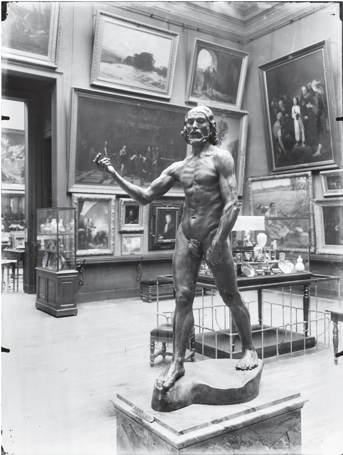
Eugène Druet, Le bronze de Saint-Jean-Baptiste au musée du Luxembourg, vers 1898-1900, épreuve gélino-argentique, H. 39,6 cm ; l. 30 cm, Paris, agence photo RMN-Grand Palais, fonds Druet-Vizzavona.