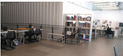
Figure 3. Intérieur d'un entrepôt à Alserkal Avenue.