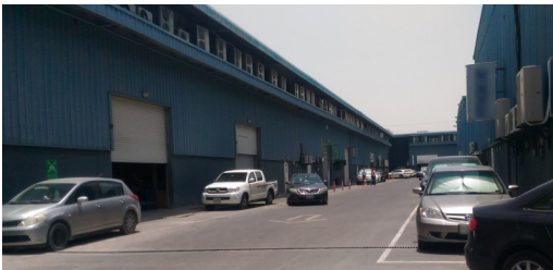
Figure 2. Entrepôts dédiés à la création artistique à Alserkal Avenue.