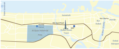
Figure 1. Carte de Dubaï.