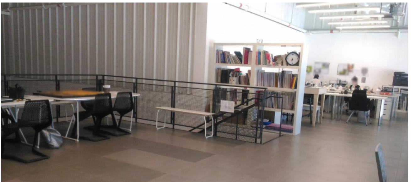
Figure 3. Intérieur d'un entrepôt à Alserkal Avenue.