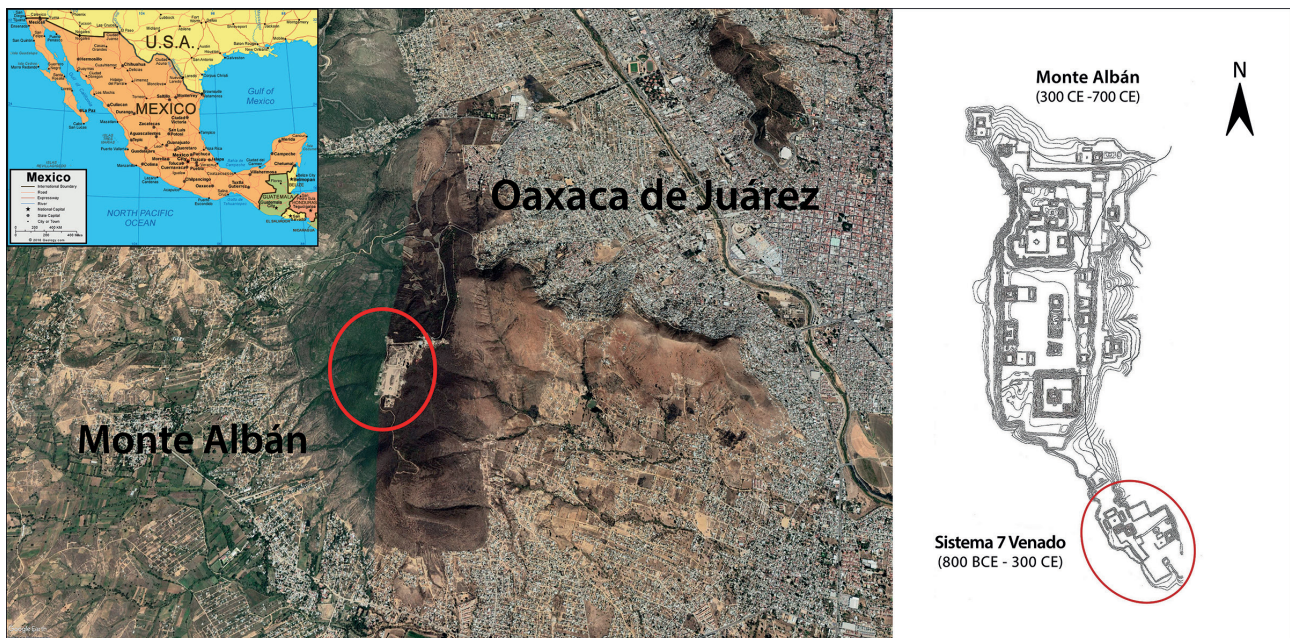
Fig. 1 – a. Carte du Mexique situant l'État d'Oaxaca et le site de Monte Albán, au sommet de la montagne éponyme (F. García à partir de Google Maps 2020).

Le Sistema 7 Venado désigne un ensemble architectural isolé composant la partie extrême sud de la colline, sur un terrain d'un peu plus de trois hectares (fig. 1b). Il fut mentionné pour la première fois durant la seconde moitié du XIX e siècle, d'abord par l'historien allemand J. Von Müller en 1864, puis par l'homme d'État et anthropologue mexicain L. Batrés (1902). Les structures en