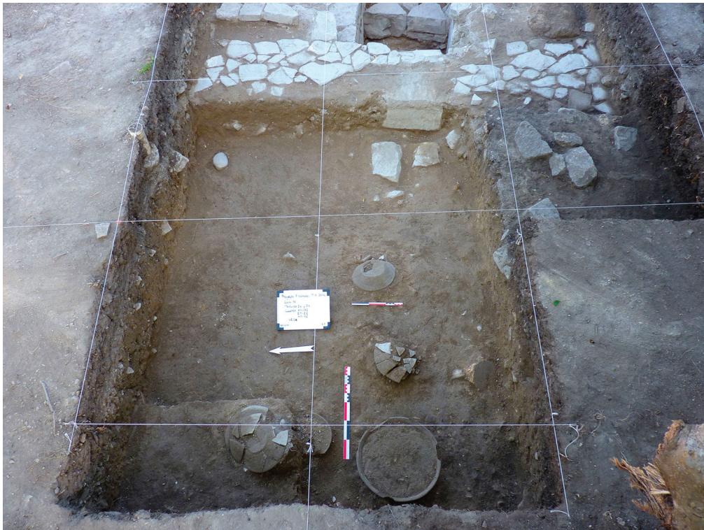
Fig. 6 – Sondage 56, place A : offrande de céramiques déposées dans les couches de scellement (S. Marigo).

Fig. 6 – Test Pit 56, Place A: ceramic offering placed in the sealing layers (S. Marigo).