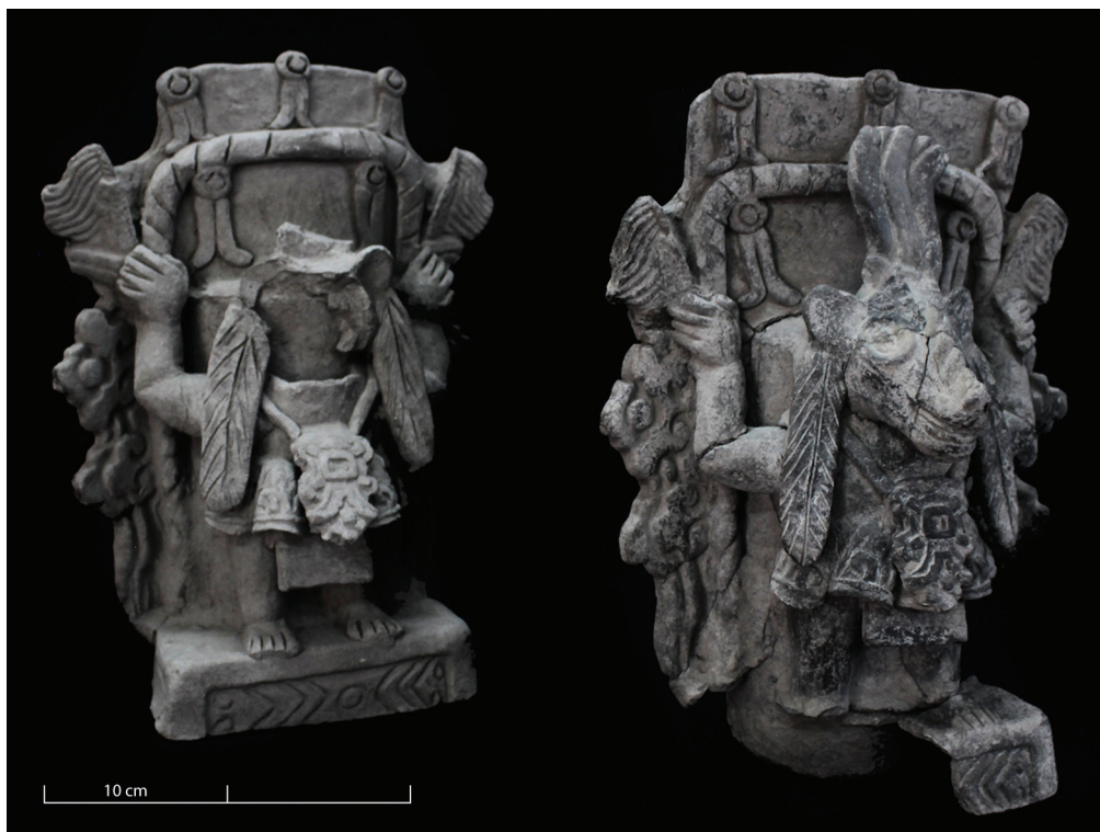
Fig. 7 – Sondage 40, place E : ensemble de deux urnes anthropozoomorphes (h 35,5 cm) représentant la divinité Xolotl avec le visage intentionnellement brisé, retrouvées dans la fosse du sondage (A. Letouzé).

Fig. 6 – Cala 56, Plaza A: ofrenda cerámica colocada en las capas de relleno terminal (S. Marigo).