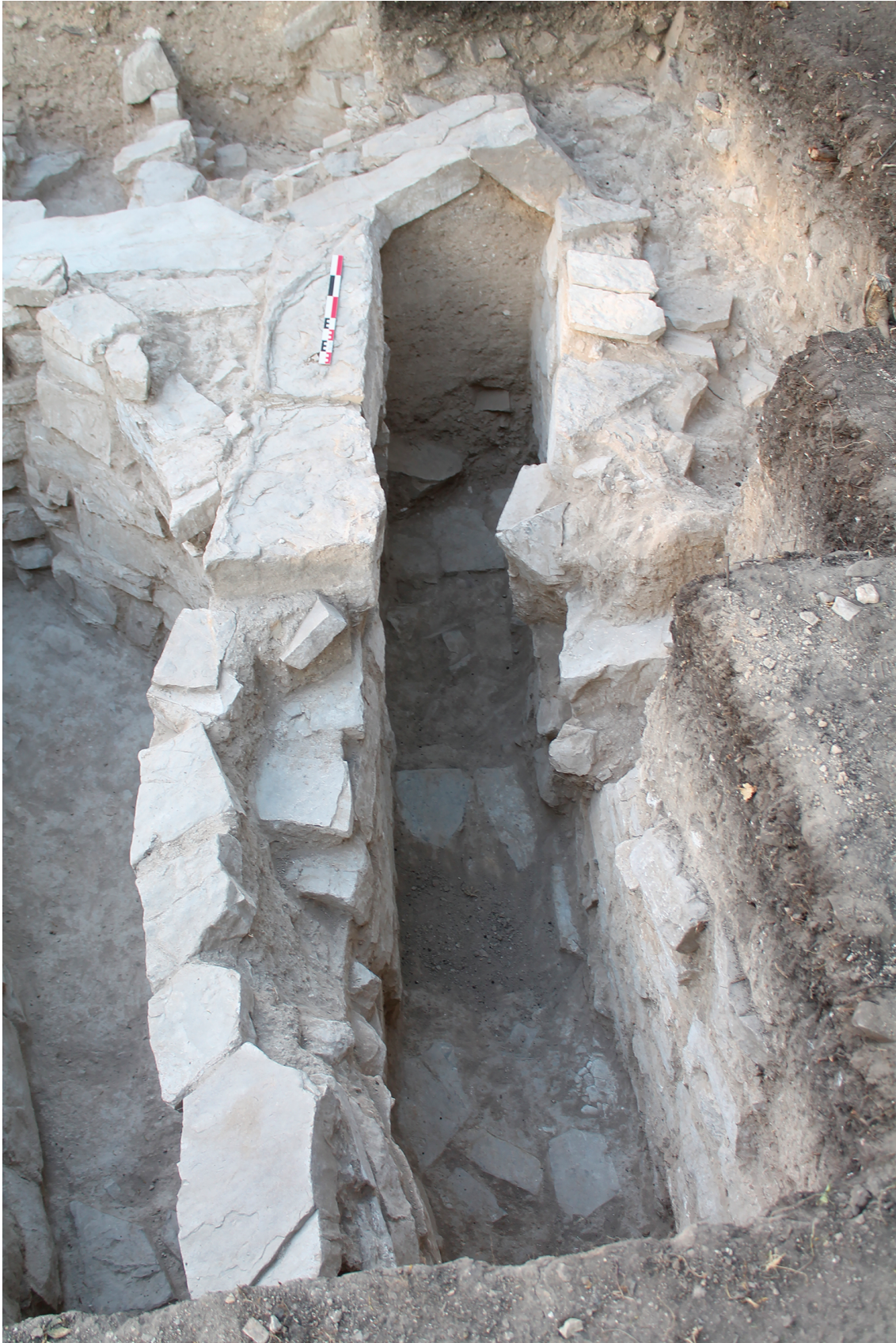
Fig. 5 – Sondage 62/72, au centre du patio sud : tombe maçonnée vidée par le sommet peu avant la fermeture du Sistema 7 Venado (F. García).