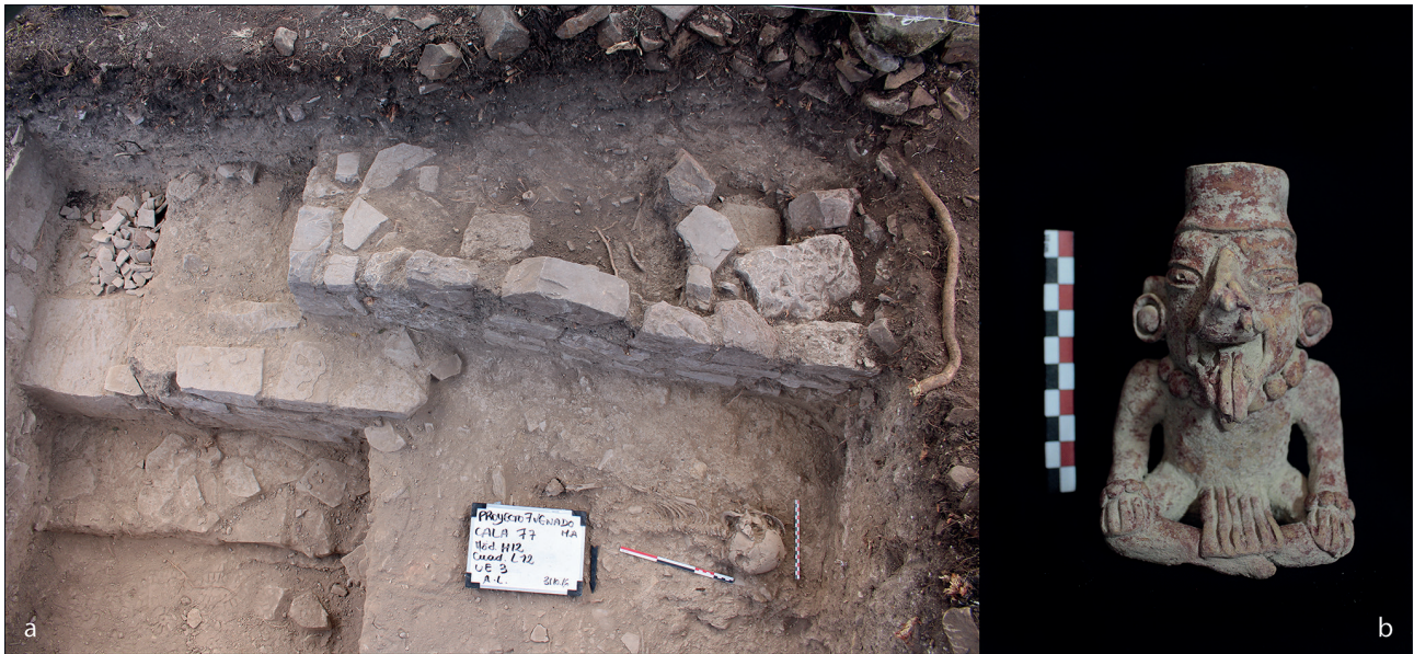
Fig. 8 – Sondage 77, en bordure de la place F : a) deux sépultures composant un ensemble funéraire placé dans le remblai de fermeture du site (A. Letouzé) ; b) urne anthropozoomorphe miniature placée avec le dépôt céramique de l'ensemble funéraire dédicatoire du sondage (A. Letouzé).

Fig. 8 – Test Pit 77, on the edge of Place F: a) two burials forming a large set of funeral deposits placed in the closing backfill site (A. Letouzé); b) anthropozoomorphic miniature urn placed with the ceramic deposit of the dedicatory funerary set from the test pit (A. Letouzé).