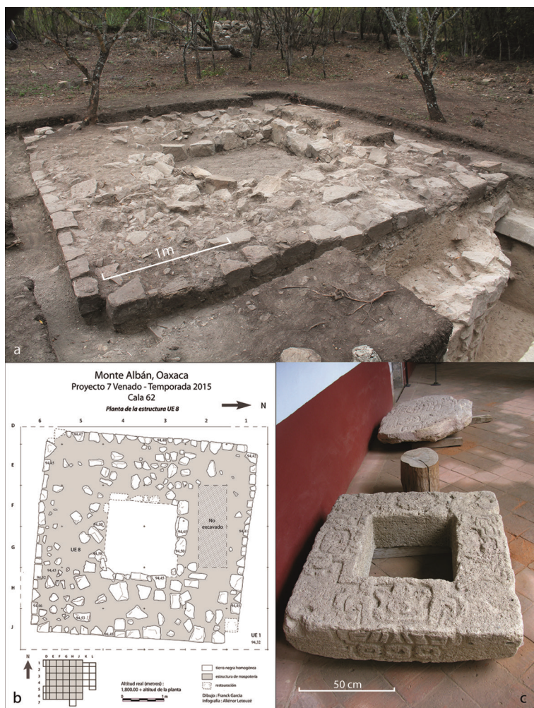
Fig. 10 – Sondage 62/72, au centre du patio sud : a) structure de plan carré aux angles rentrants, sans niveau de fondation, placée dans la couche de scellement de la place (F. García) ; b) illustration de la structure en forme de cosmogramme découverte dans le sondage (F. García et A. Letouzé) ; c) pierre sculptée représentant un cosmogramme, découverte dans les environs de Cuilapan de Guerrero, à quelques kilomètres au sud de Monte Albán, et conservée au Convento de Cuilapan de Guerrero (F. García).

Fig. 10 – Test Pit 62/72, in the center of the South Patio: a) square structure with inside corners, without foundation level, placed in the closing stratum of the patio (F. García); b) illustration of the cosmogram-shaped structure discovered in the test pit (F. García and A. Letouzé); c) carved stone representing a cosmogram discovered in the surroundings of Cuilapan de Guerrero, a few kilometers south of Monte Albán, and kept at the Convento de Cuilapan de Guerrero (F. García).