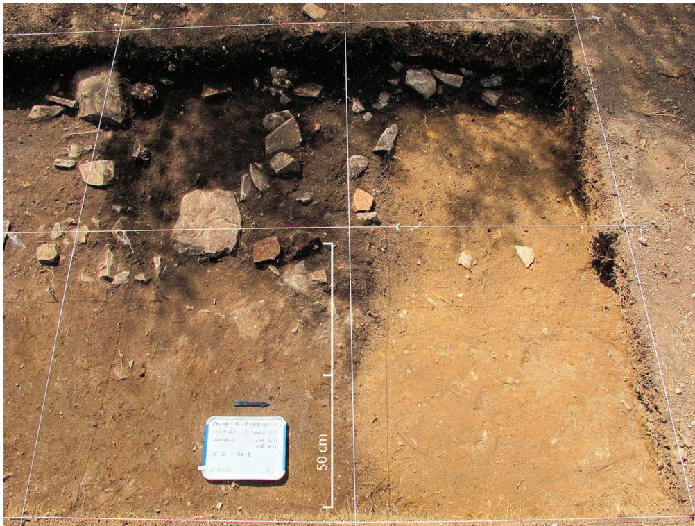
Fig. 9 – Sondage 38, place C : dépôt de petits blocs de terre jaune alignés selon l'axe nord-sud, à l'intérieur du remblai de fermeture du site (A. Letouzé).

Fig. 8 – Cala 77, en el borde de la Plaza F: a) dos entierros que componen un conjunto de depósitos funerarios colocados en el relleno de cierre del sitio (A. Letouzé); b) urna antropozoomorfa miniatura colocada con el depósito cerámico del conjunto funerario dedicatorio de la cala (A. Letouzé).