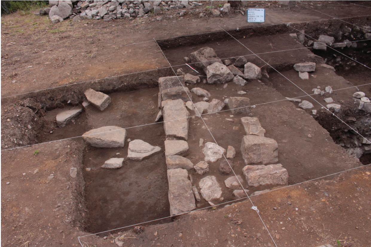
Fig. 4 – Sondage 48/58, place C : vestiges de la première assise d'un bâtiment durant l'abandon (A. Letouzé). Fig. 4 – Test Pit 48/58, Place C: remains of the first foundation of a building during the abandonment (A. Letouzé). Fig. 4 – Cala 48/58, Plaza C: restos de los primeros cimientos de un edificio durante el abandono (A. Letouzé).

(fig. 10c). Du carré central, figurant le point d'origine du monde ou la grotte originelle, émanent les quatre directions de l'univers, qui fondent l'espace et le temps. L'ensemble de ces pratiques spectaculaires, dont les traces étaient probablement vouées à être enterrées ou semi-enterrées, marquent physiquement la terre pour reconstruire un espace signifiant.