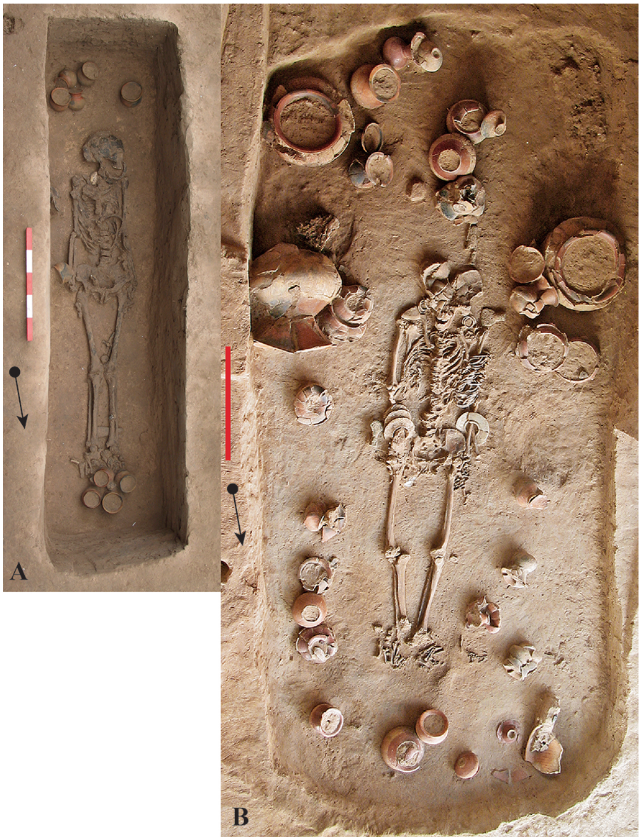
Fig. 2 – Sépulture 446 (A) de la première phase de l'Âge du Bronze du site de Ban Non Wat comparée à la sépulture 197 (B) de la deuxième phase du même site , cette dernière représenterait celle d'un «aggrandizer», les échelles représentent 0,5m

Fig. 2 – Burial 446 (A) from the first phase of the Bronze Age at Ban Non Wat compared to Burial 197 (B) from the second phase of the same site, the latter would represent that of an aggrandizer, scales are 0.5m.