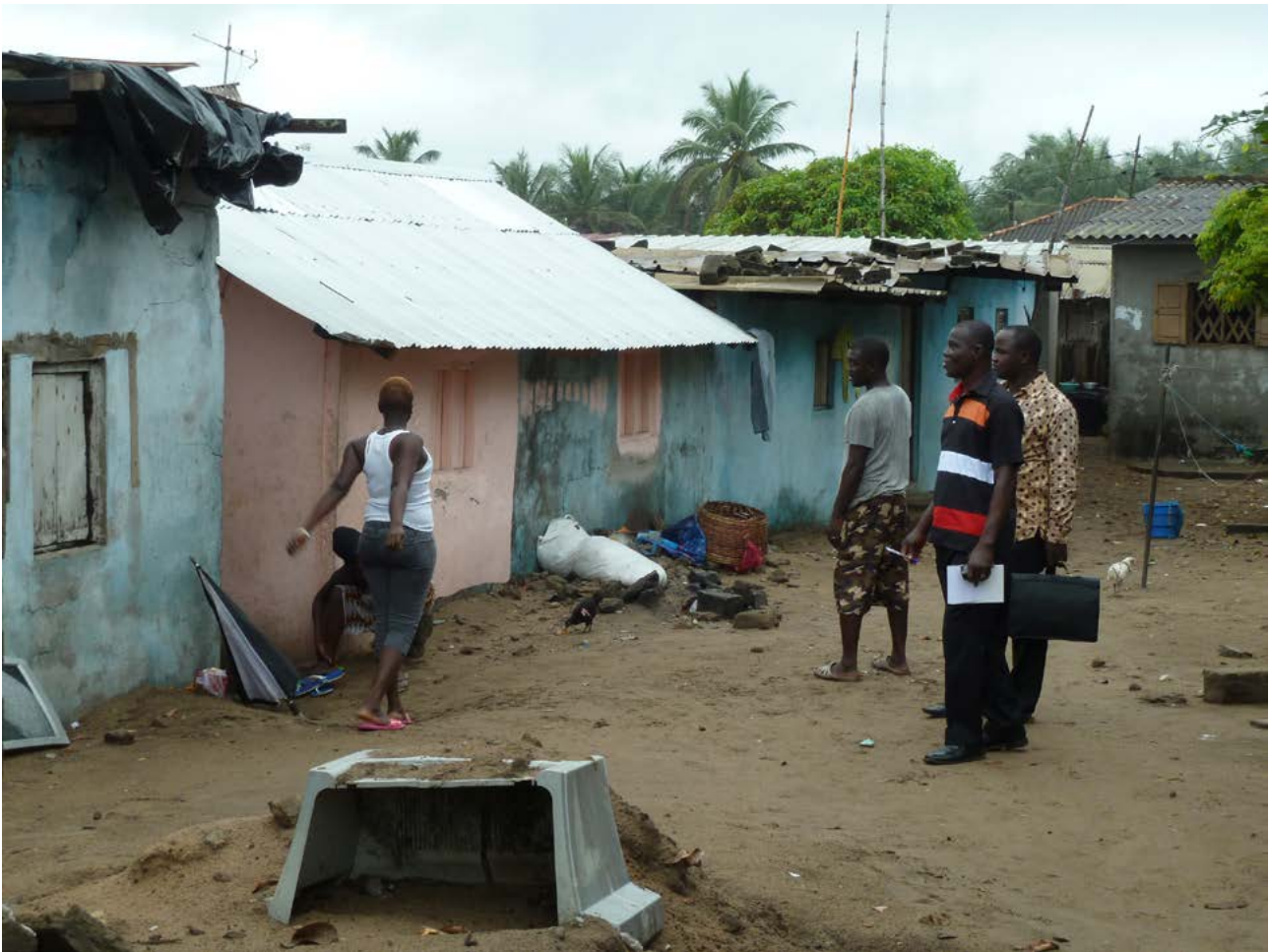
Promenade urbaine effectuée par les participants pour identifier les bonnes et mauvaises pratiques dans la ville historique de Grand-Bassam