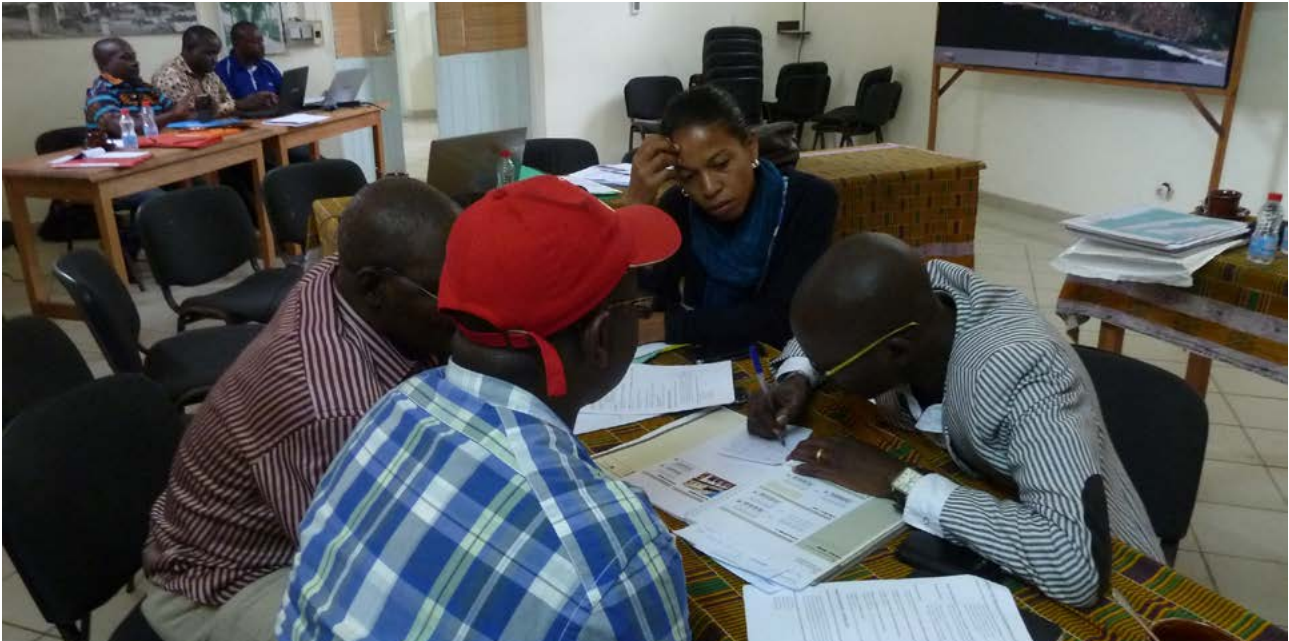
Travaux de groupe entre les participants provenant de Saint Louis, Abomey et Grand-Bassam pour améliorer les guides de bonnes pratiques concernant la conservation du paysage historique urbain de Grand-Bassam