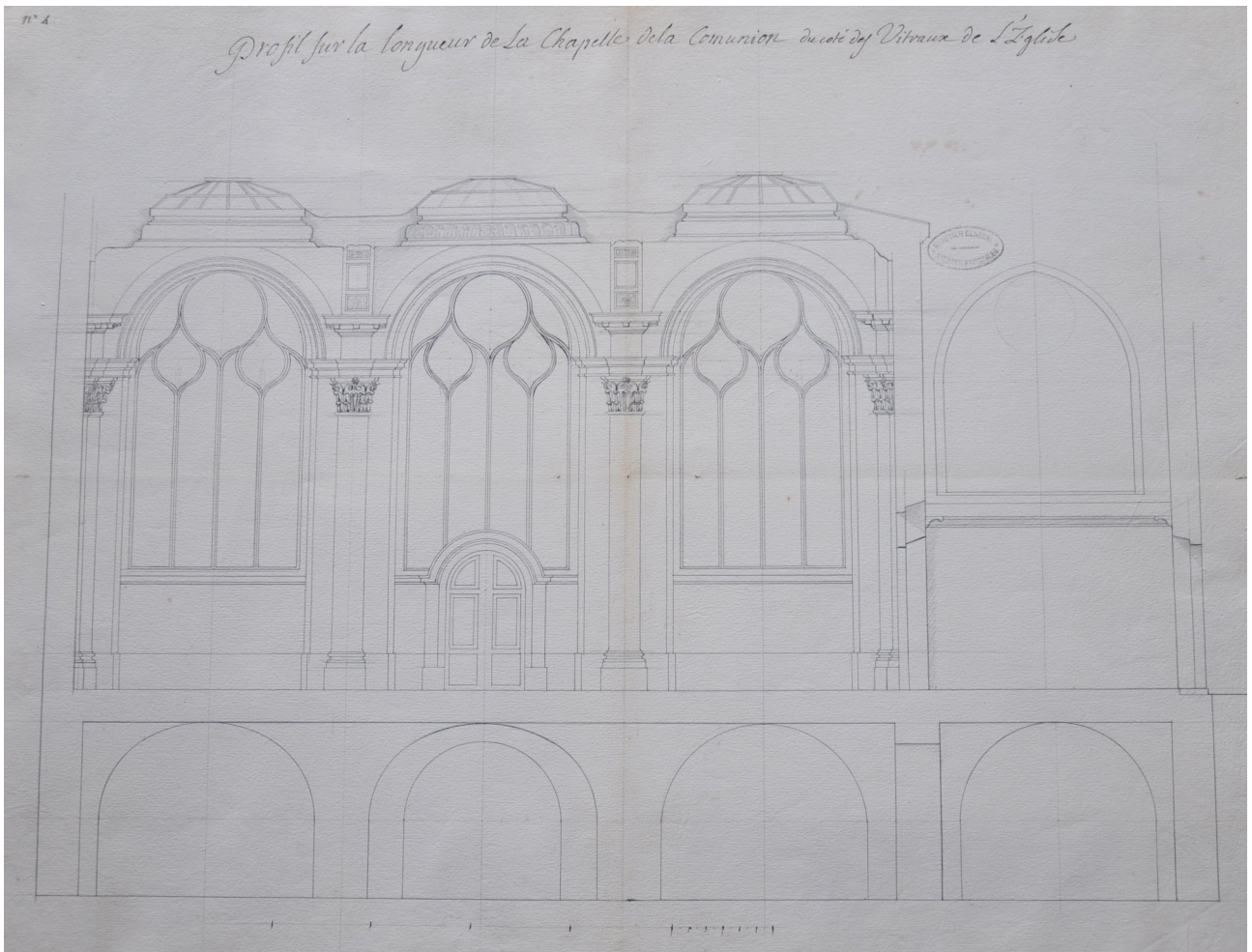
Fig. 3 : Germain Boffrand, Profil sur la longueur du côté des vitraux , 1743, 430 x 590 mm, Paris, Archives nationales, MC/RS//216