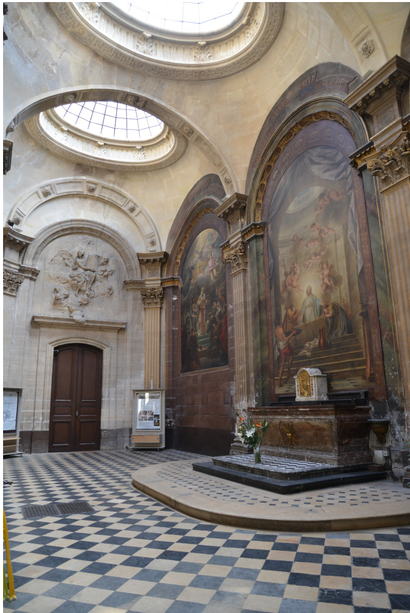
Fig. 2 : Vue de la chapelle de la Communion depuis la nef, avec le retable de Charles-Antoine Coypel, Le Souper d'Emmaüs , 1749, huile sur toile cintrée, 590 x 315 cm