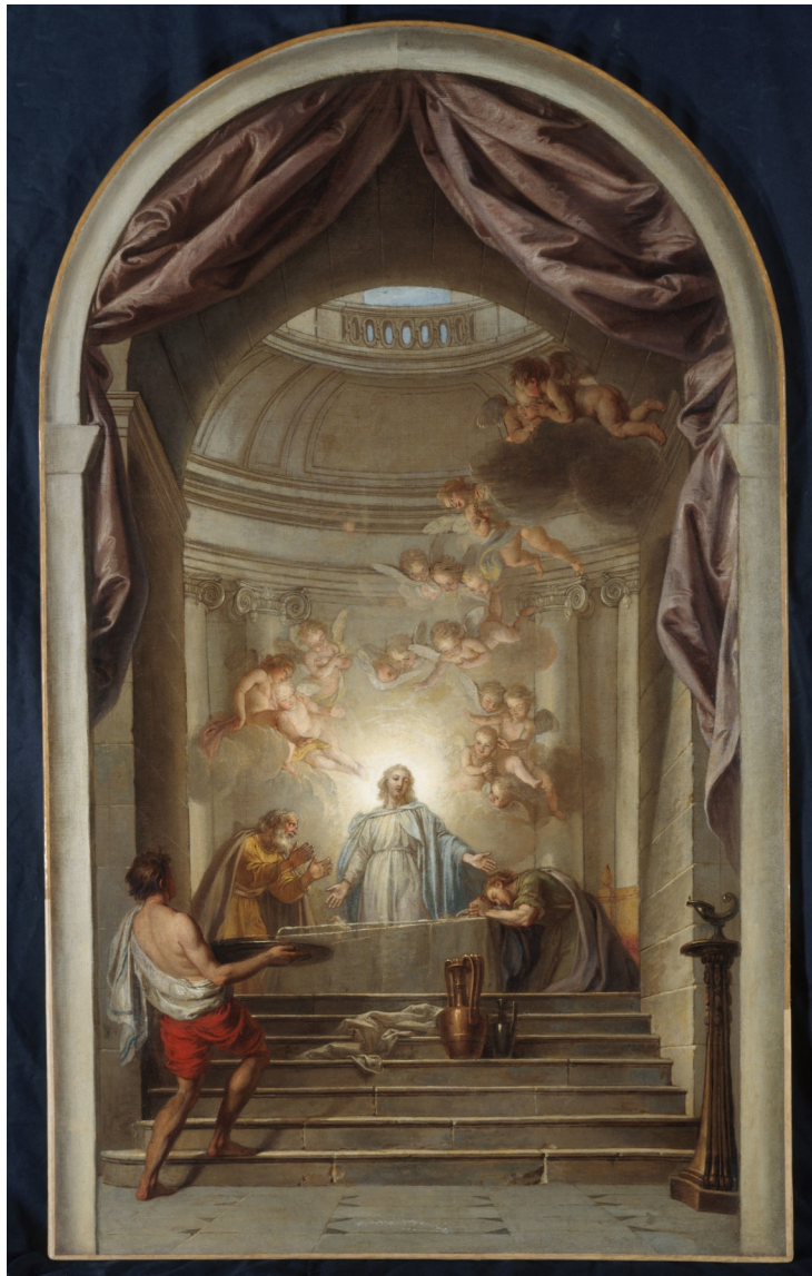
Fig. 7 : Charles-Antoine Coypel, Le Souper d'Emmaüs , v. 1749, huile sur toile, 132 x 78 cm, Paris, musée Carnavalet, inv. P.2545