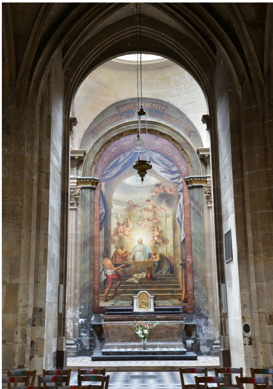
Fig. 1 : La chapelle de la Communion de Saint-Merry