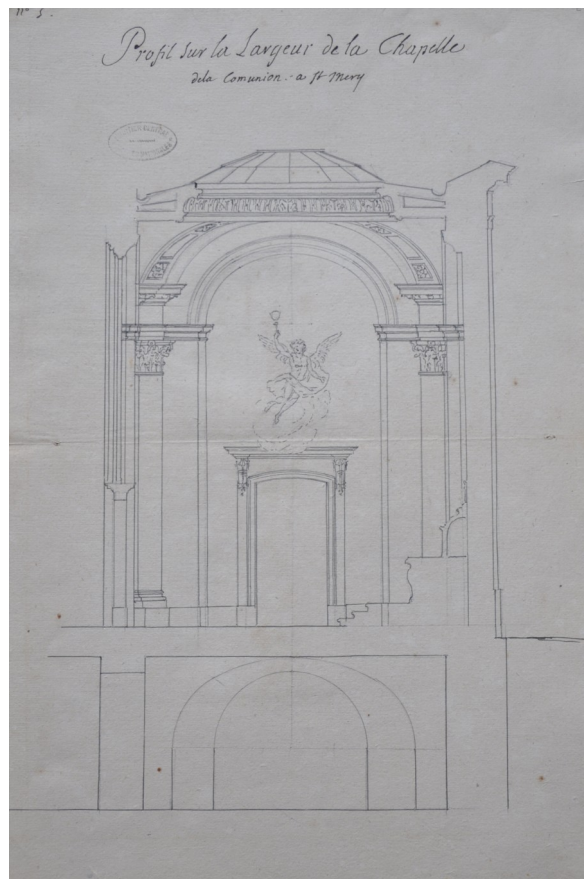
Fig. 5 : Germain Boffrand, Profil sur la largeur de la Chapelle de la la Communion à Saint-Merry , 1743, 430 x 300 mm, Paris, Archives nationales, MC/RS//216