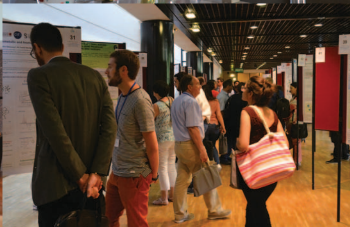
Week-end grand public, session posters et table ronde « Chimie et vivant » avec la participation du RJ-SCF lors de SCF18 (voir aussi SCF18 : retour en images, www.societechimiquedefrance.fr/SCF-18-Retour-en-images.html et en vidéo sur la chaîne YouTube de la SCF), © SCF.

outils informatiques flexibles et accessibles à toutes et à tous, un agenda partagé dans « le nuage », des tâches précises, et surtout de la confiance partagée et réciproque. Pour orchestrer ces actions, Camille, Simon et Nicolas ont assuré le rôle de super bénévole : polyvalent, présent et réactif pour faire en sorte qu'à chaque problème une solution soit apportée en un temps record.