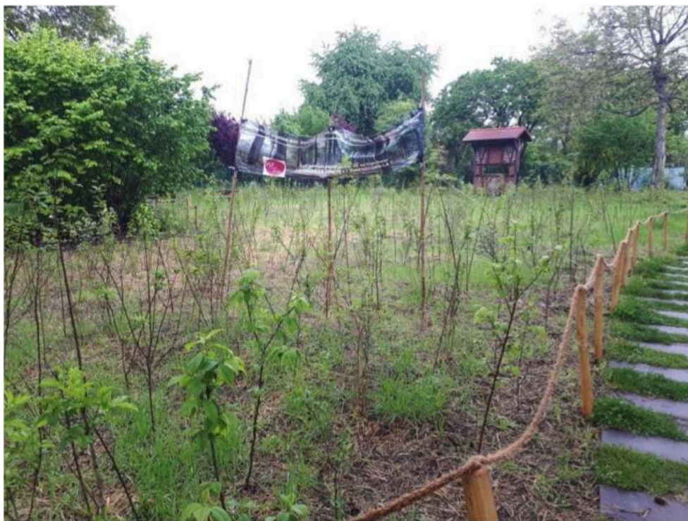
Figure 1. Microforêt dite Miyawaki du parc aux oiseaux de Schiltigheim

Sources : Adrien Baysse-Lainé, Laure Cormier et Kevin Gaulier, 2022.