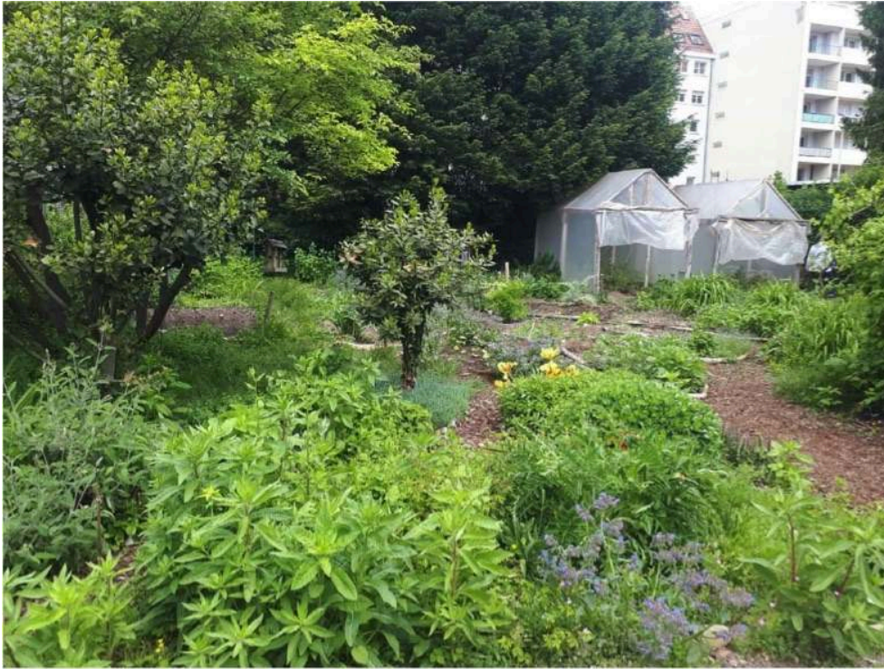
Figure 4. Broyat de bois des arbres du jardin Fridolin utilisé pour couvrir le sol non cultivé