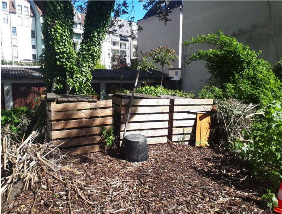
Figure 3. Bacs à compost Compostra au jardin de l'arrosoir