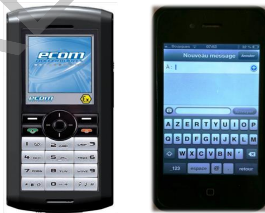
Figure 1. Exemples de clavier alphanumérique (à gauche) et de clavier azerty (à droite)