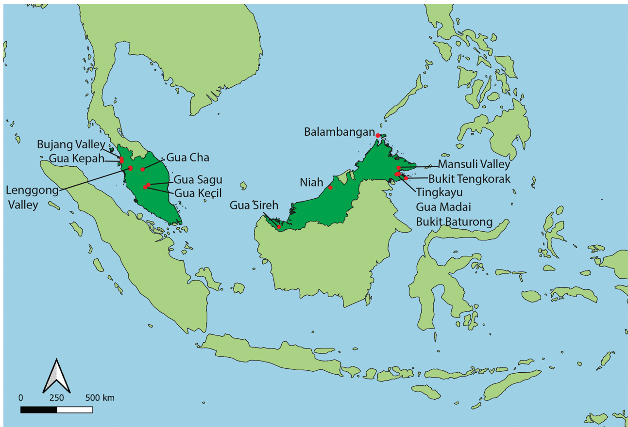
Fig. 1 – Principaux gisements archéologiques en Malaisie (D. Codeluppi). Fig. 1 – Main archaeological areas in Malaysia (D. Codeluppi).