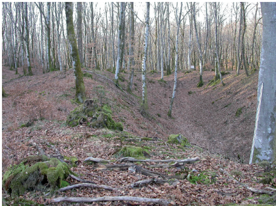
Mines de la Loutière, commune d'Ouroux-en-Morvan.

sur l'ensemble du Morvan, des études paléoenvironnementales ont été engagées. Celles-ci consistent en l'analyse conjointe de palynologie et de géochimie sur des séquences prélevées en tourbière. L'analyse des grains de pollen et des spores conservés dans la tourbe permet de suivre l'impact des activités métallurgiques sur le couvert végétal. En effet, les différentes phases du travail métallurgique, extraction, réduction, transformation, sont particulièrement consommatrices de bois et donc à l'origine de phases de déforestation perceptibles dans les enregistrements polliniques. Par ailleurs, les activités de réduction et de transformation du minerai ont émis dans l'atmosphère des micropolluants métalliques qui se sont ensuite redéposés au sol. Aujourd'hui, l'analyse géochimique des tourbes permet de retrouver ces traces et en particulier celles du plomb. L'analyse de la composition isotopique de ce dernier va permettre de différencier un plomb issu de l'érosion du substrat géologique de celui remobilisé lors des activités paléométallurgiques, et cela grâce à sa signature isotopique, issue du rapport de deux isotopes radiogéniques : ^{206}\text{Pb}/^{207}\text{Pb} . Cette signature fonctionne comme une véritable empreinte digitale et apporte une information quant à l'origine du plomb intégré au système. Présent dans de nombreuses minéralisations, le plomb permet de mettre en évidence une large gamme