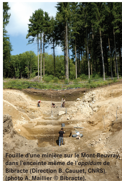
Fouille d'une minière sur le Mont-Beuvray, dans l'enceinte même de l'oppidum de Bibracte (Direction B. Cauuet, CNRS).

Trois carottes prélevées dans le massif du Morvan ont fait l'objet de ce protocole d'analyse. La première située au Port-des-Lamberts, sur la commune de Glux-en-Glenne (Nièvre), a été choisie parce qu'elle se situe à proximité du site de Bibracte, à environ 5 km à vol d'oiseau. La deuxième tourbière est localisée dans le même secteur géographique du Haut-Morvan, sur le massif du Grand-Montarnu, à quelques kilomètres seulement de celle du Port-des-Lamberts. La tourbière du Grand-Montarnu présente la particularité de s'inscrire dans un secteur très riche minéralogiquement, dans un lieu où des vestiges d'activités minières sont encore visibles. En l'absence de fouilles, la chronologie des exploitations antérieures au XIX e siècle reste aujourd'hui