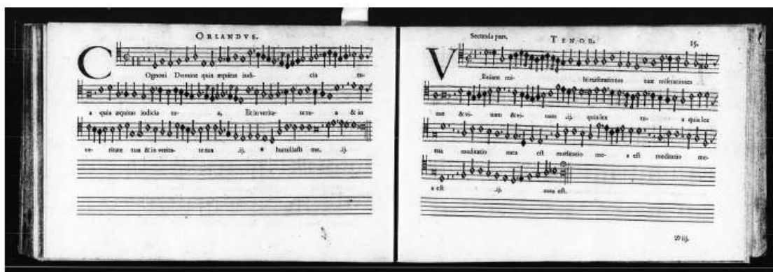
FIG. 1 et 2 – Mise en page des Moduli quatuor et octo vocum d'Orlande de Lassus. En haut : Paris, Adrian Le Roy et Robert Ballard, 1572 (gallica.bnf.fr / Bibliothèque nationale de France). En bas : La Rochelle, Pierre Haultin, 1576 (Bibliothèque municipale de Bordeaux).

Source: gallica.bnf.fr / Bibliothèque nationale de France