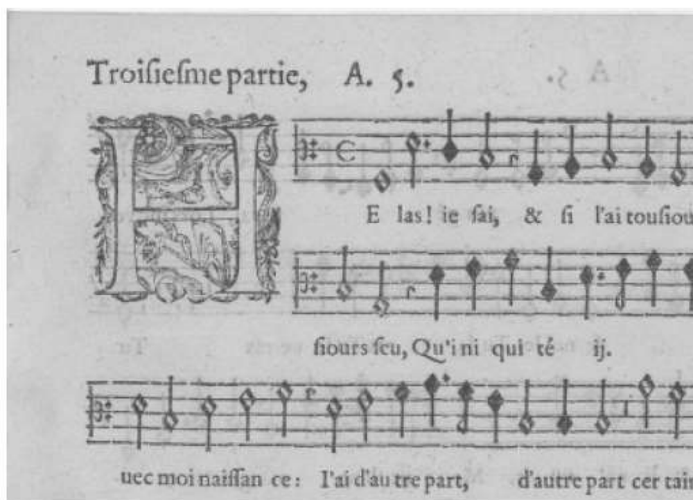
FIG. 3 et 4 – En haut : lettrines utilisées par Jérôme Haultin pour le Dodécacorde de Claude Le Jeune (1598). – En bas : lettrines employées par Le Roy et Ballard pour le Mellange d’Orlande de Lassus (Le Roy et Ballard, 1570).

Initiale H employée à l’envers par le compositeur-typographe du Dodécacorde. La symétrie horizontale et verticale de la lettre explique cette erreur, qui peut aussi être le signe d’une utilisation récente de cette lettre historiée dans l’atelier.