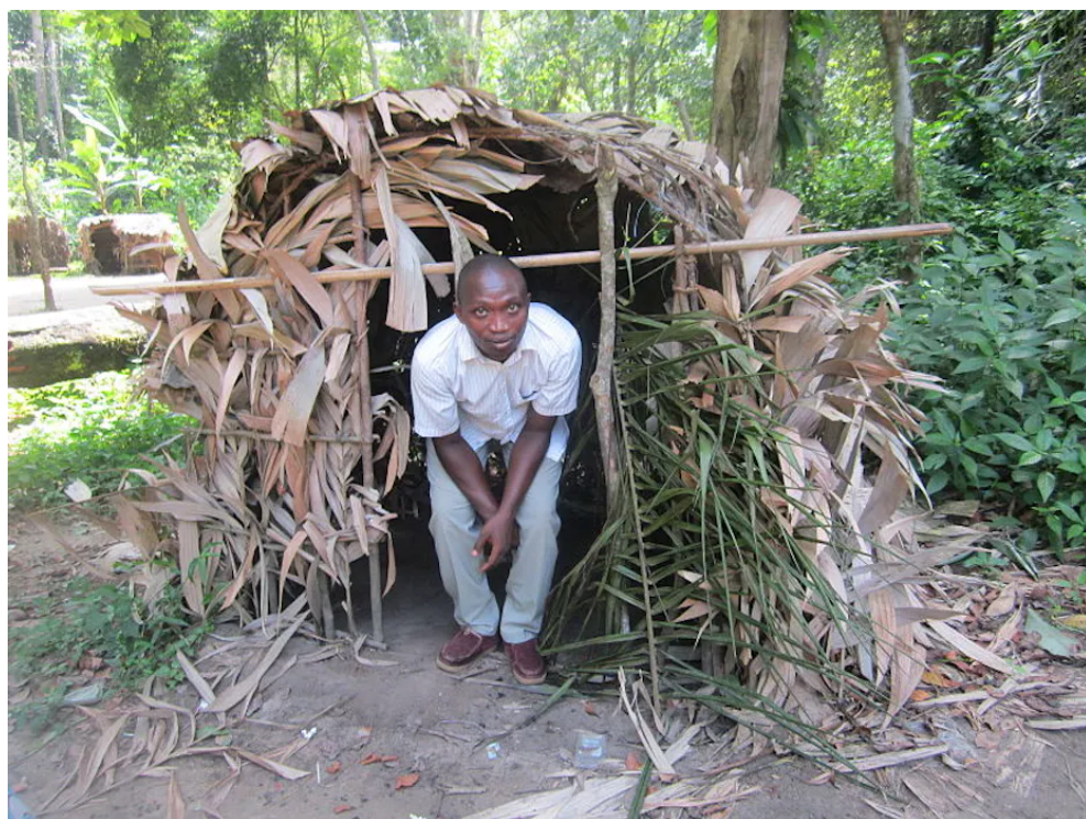
Une construction des pygmées Baka.

Chercheur, spécialiste de la croissance chez l'homme moderne, Centre national de la recherche scientifique (CNRS)