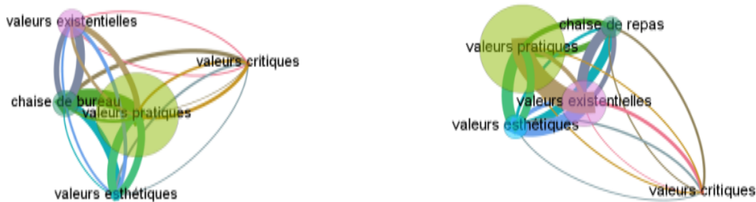
Figure 1. - Taille relative des valeurs de consommation chez les vendeurs en fonction du type de chaise

D'après la figure 1 qui illustre nos résultats, les chaises de bureau et les chaises de repas connaissent des modes de valorisation similaires. Nous pouvons constater que les caractéristiques techniques telles que les fonctionnalités sont mises en avant par les vendeurs particuliers pour les deux produits.