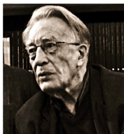
Jean Oury (1924-2014) Psychiatre et psychanalyste français

Oury parle, en 1984, depuis le champs disciplinaire de la psychiatrie, à un moment où certains de ses praticiens tentent d'échapper à la tentation de la nomenclature, incarnée par le DSM III ainsi défini par le même Jean Oury :