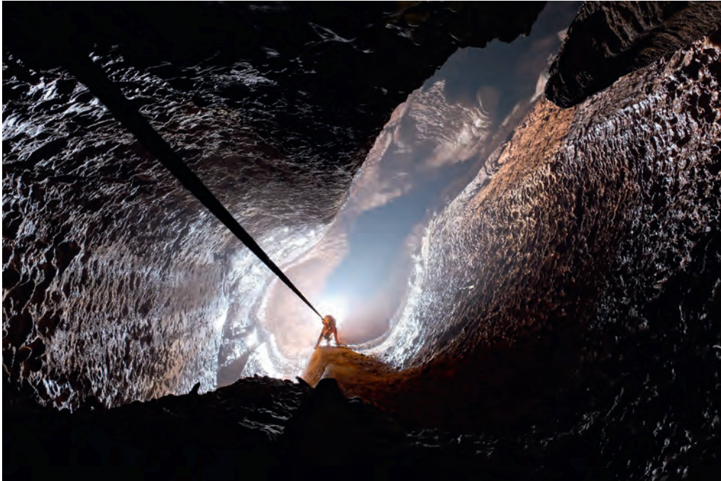
Photo 7 : Le Trou souffleur est l'unique voie d'accès naturelle à la zone saturée de la Fontaine de Vaucluse. La descente débute par le puits des 3 Agénors (P36). Trou souffleur is the only cave that reaches the saturated zone of fontaine de Vaucluse hydrosystem. Descent starts with the 36 m deep "3 Agenor" shaft.

les processus d'infiltration et de stockage de l'eau dans la zone vadose du karst ont également pu être identifiés au moyen de diverses approches hydrogéophysiques [Jardani et al., 2007 ; Carriere et al., 2016]. Des méthodes géophysiques d'inversion ont par ailleurs été mises en œuvre pour reconstruire le champ de transmissivité du karst, et des méthodes de tomographie hydraulique ont été développées en utilisant comme support un site expérimental constitué de 21 forages recoupant l'aquifère fracturé et karstifié associé à la source du Lez [Fischer et al. 2017 ; Wang et al., 2016].