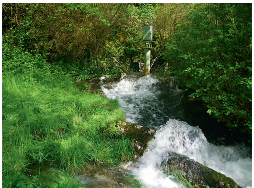
Karstic exsurgence of the Hillère on the Baget system. This exsurgence only functions during episodes of intense precipitation (around 50 days per year) and this phenomenon is quite specific to karstic systems. This exsurgence is related to the Peyrère annex system on which high-flow pumping was carried out in 1991.