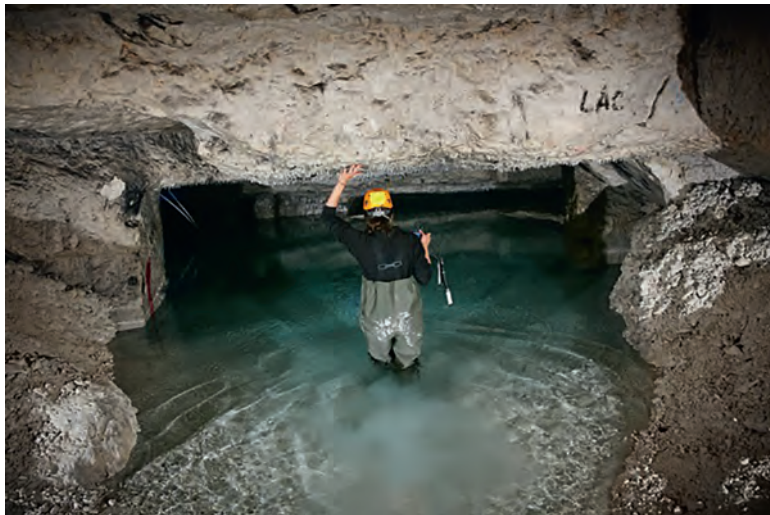
Photo 5: Carrière souterraine dans la craie de Saint-Martin-le-Nœud (Oise). Dans les parties basses, la nappe de la craie affleure, donnant naissance à des lacs souterrains ; au plafond, de l'eau de percolation s'écoule après avoir traversé la zone non saturée de la craie formant par endroits des stalactites comment illustré dans l'encadré.

Chalk underground quarry of Saint-Martin-le-Noeud (Oise). The water table is intercepted in the deeper parts of the quarry, in the form of underground lakes; Water coming from the unsaturated zone is percolating at the ceiling of the quarry forming stalactites as seen in the box.