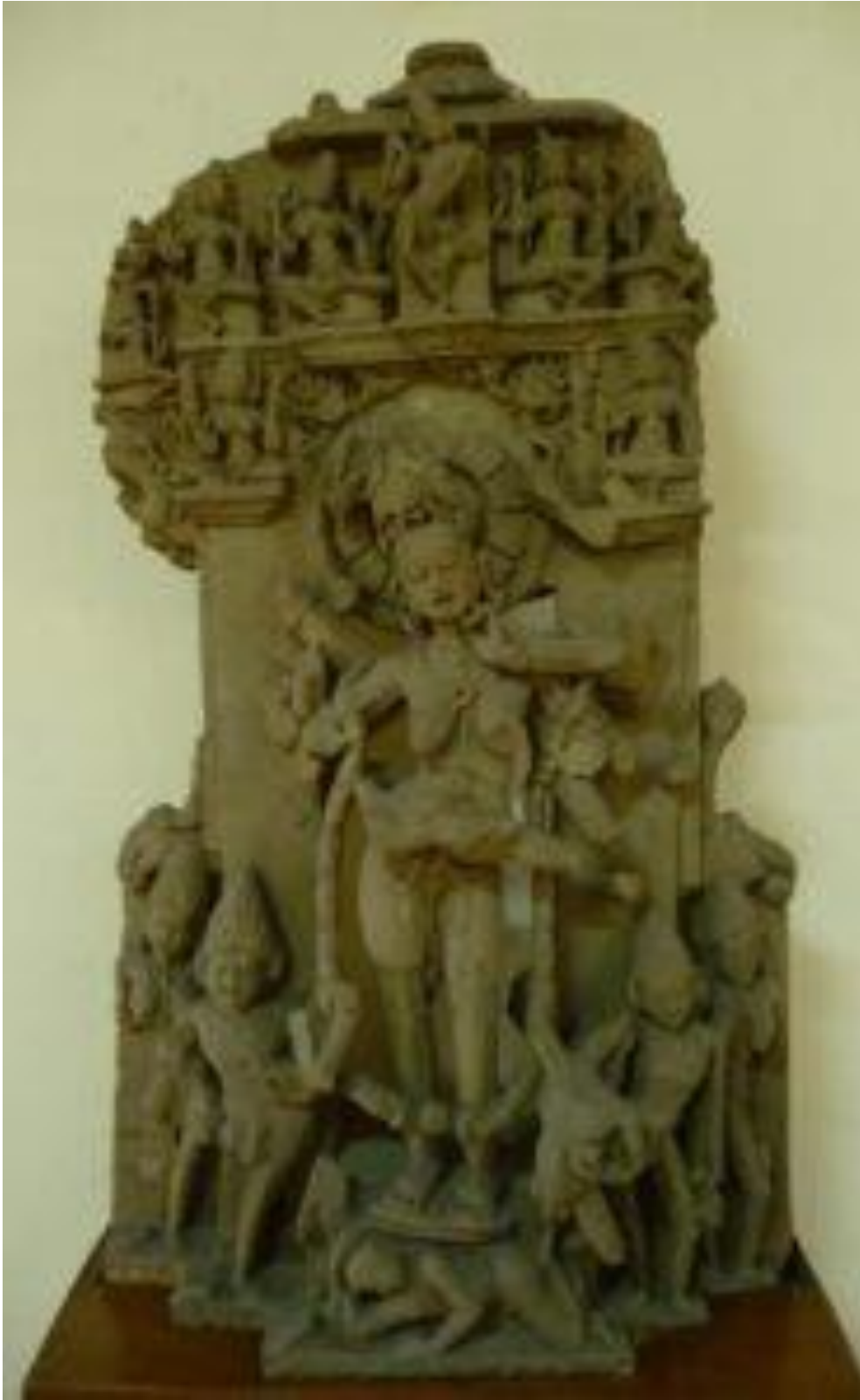
Fig. 1 Cāmuṇḍā, prov. Hinglajgarh, Madhya Pradesh, XIe siècle, Musée d'Indore, photo Lauriane Lecat.