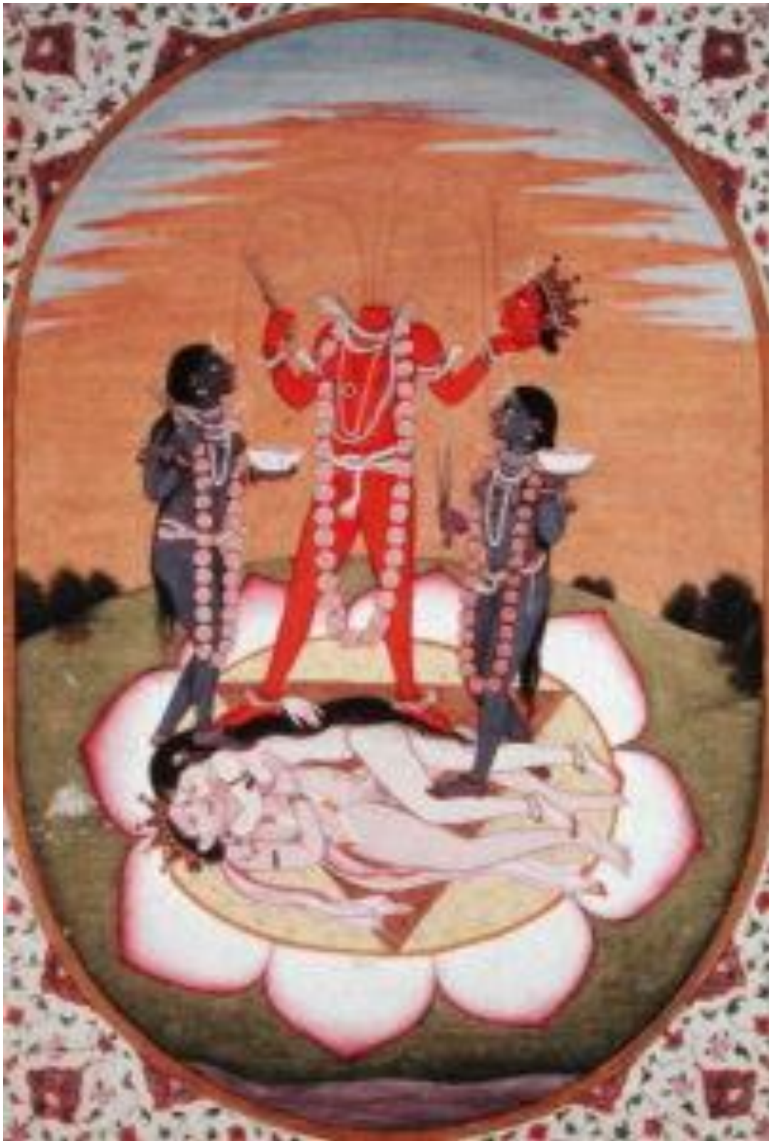
fig. 14 Chinnamastā, Himachal Pradesh, vers 1800, dimensions inconnues, collection particulière.