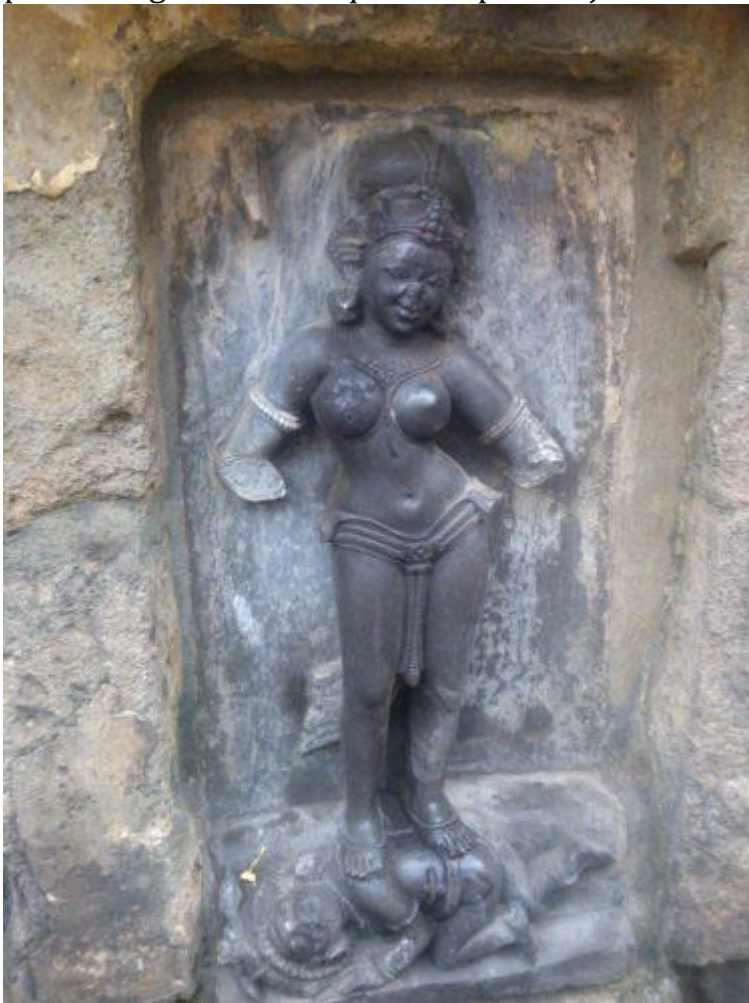
Fig. 2 Yoginī, Hirapur, Orissa, Xe siècle, photo MMohanty, Wikimedia Commons.

Au VIe siècle déjà, certaines sculptures montrent Cāmuṇḍā assise sur un corps masculin[7], et ce trait devient de plus en plus courant par la suite : au Xe siècle il s'étend quasiment à la totalité de ses représentations dans le nord de l'Inde. Dans la plupart des images il s'agit d'un cadavre, mais, comme l'a montré T.E. Donaldson[8], dans certaines représentations, ce corps est animé. Cette iconographie constituerait ainsi une étape vers la transformation du cadavre en une figure du dieu Śiva. Cette étape s'illustre aussi dans la série des Yoginī, apparue vers la fin du Xe siècle, parmi lesquelles on trouve plusieurs figures ayant pour véhicule ( vāhana ) un personnage masculin qui n'est pas toujours un cadavre (fig.3).