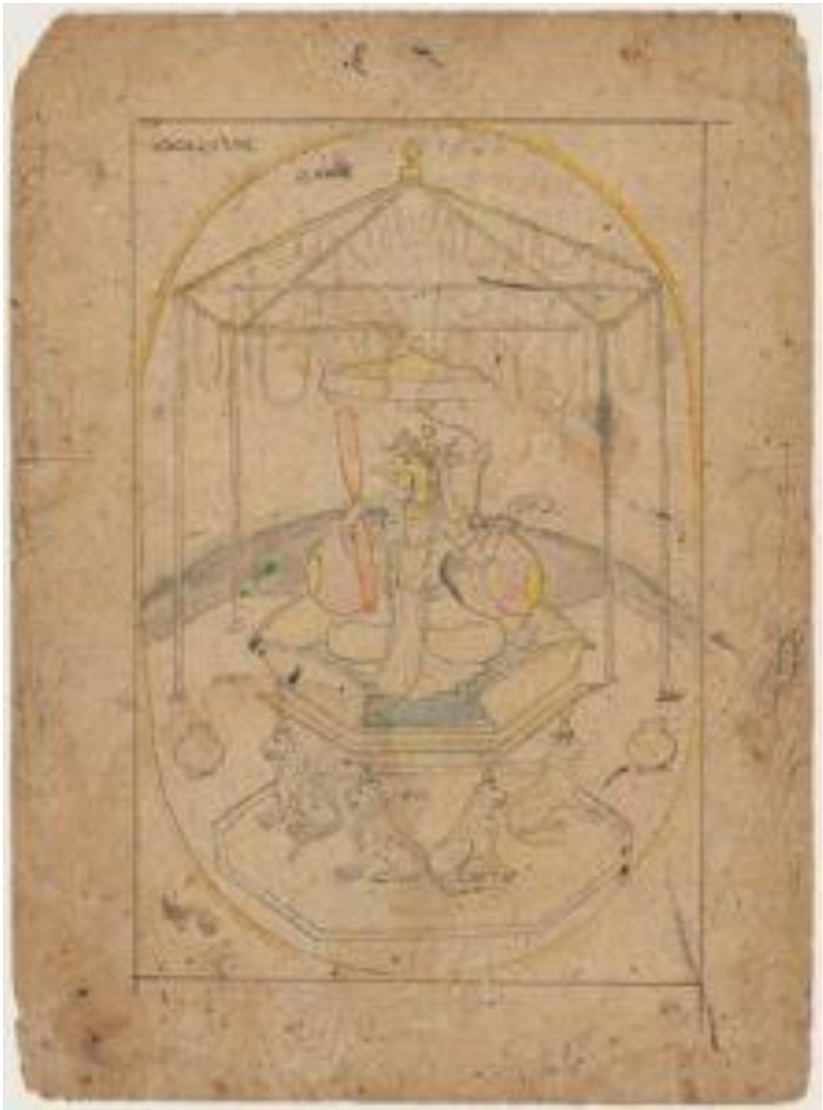
fig. 20 Bagalāmukhī, Himachal Pradesh, vers 1825, 20.7 x 13.7 cm, Museum of Fine Arts, Boston, acc.n. 17.2573.

Bagalāmukhī ( fig.19 ) [55] , qui la suit, est la seule Mahāvidyā qui ait une tête animale, à l'instar des yoginī de la sculpture indienne des Xème ou