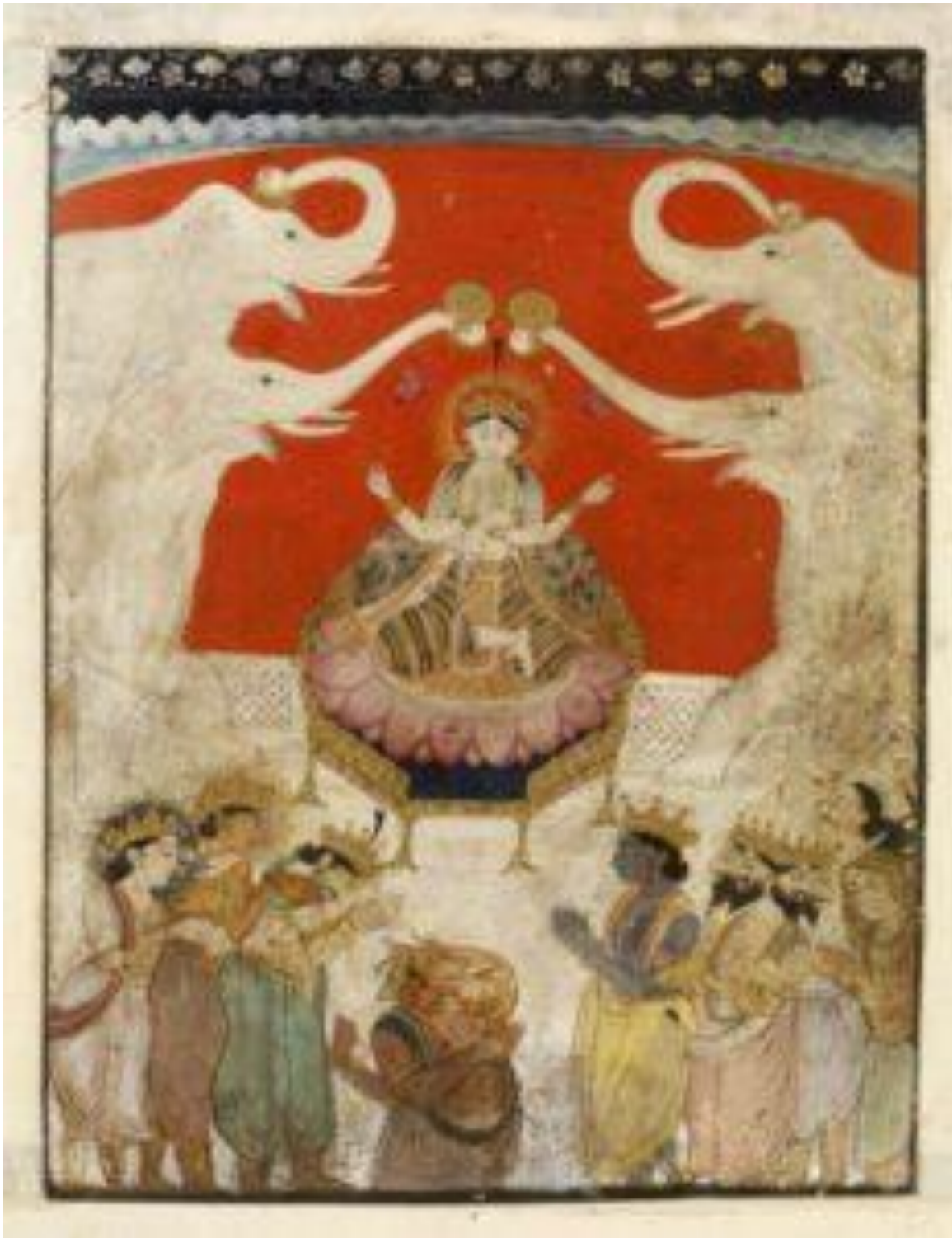
fig. 23 Kamalā, Guler, Himachal Pradesh, 22,4 x 17 cm, vers 1760, Victoria and Albert Museum, acc. n. IS 229-1950.

C'est, enfin, la représentation classique de la déesse épouse de Viṣṇu ondoyée par les éléphants, figure bien connue de la royauté plus communément désignée sous le nom de Gajalakṣmī, qui clôt la série. Elle