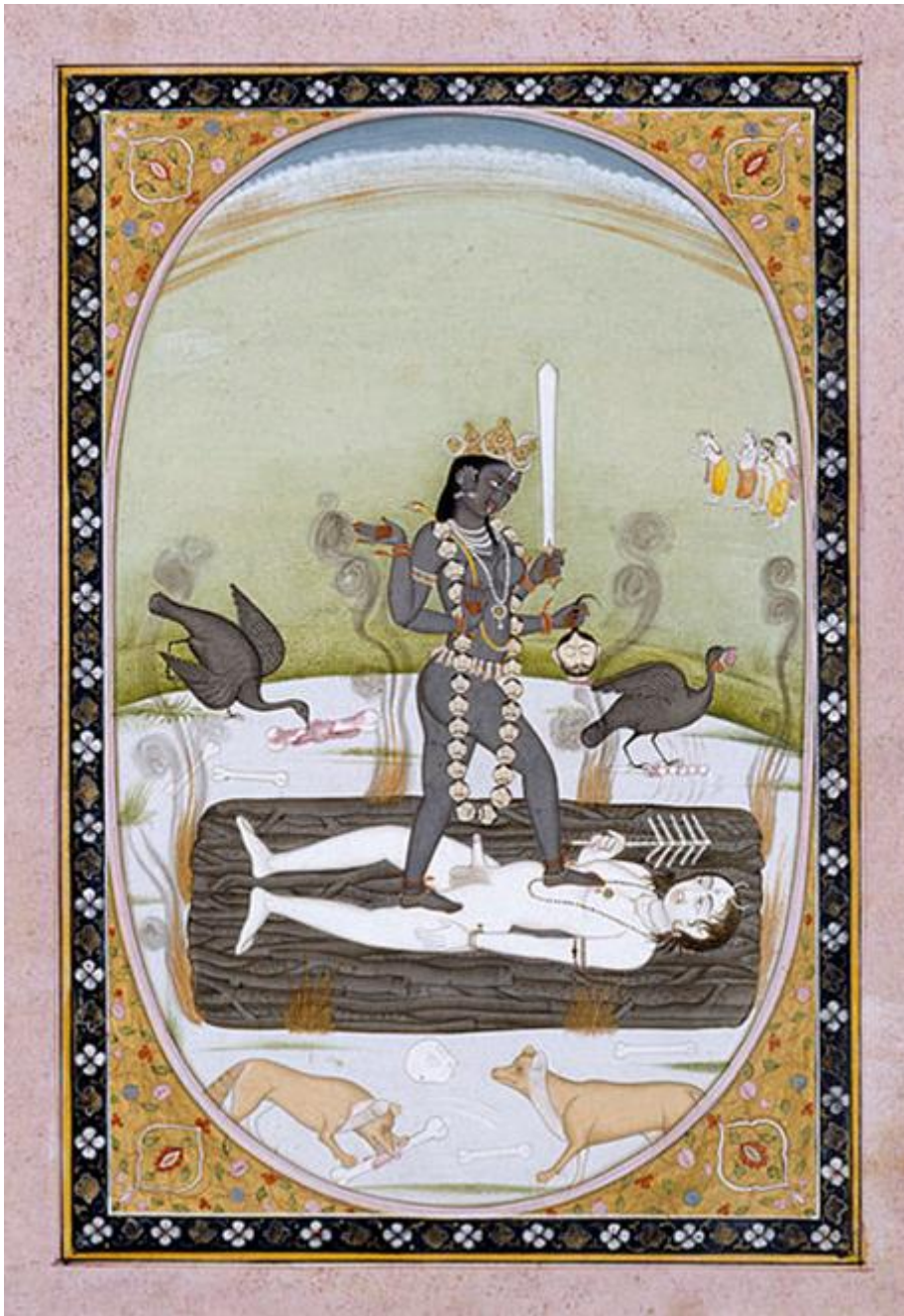
fig. 6 Kālī, Kangra, Himachal Pradesh, 1800-1825, 27 x 19.1 cm, The Walters Art Museum, Baltimore, acc. n. W.891.

Sur l'étoffe brodée la rangée horizontale supérieure commence par Kālī ( fig.5 ): la déesse nue, au teint très sombre, tient une épée et une tête coupée, elle est parée d'une longue guirlande de têtes coupées et piétine un corps inanimé au teint clair, dans un terrain de crémation hanté de chiens et d'oiseaux qui se repaissent de restes humains, caractéristiques qui correspondent à la description du Śāktapramoda [27] et du Tantrasāra [28], et que l'on retrouve sur une miniature conservée au