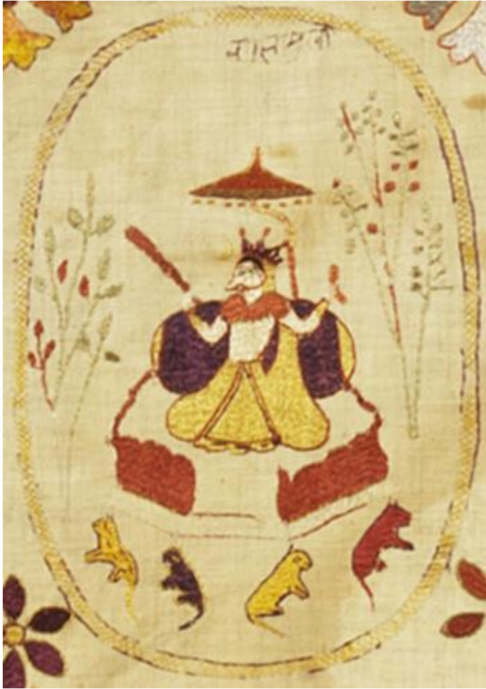
fig. 19 Bagalāmukhī, étoffe brodée, Chamba, Himachal Pradesh, vers 1800, 82.5 x 142.2 cm, Los Angeles County Museum of Art, detail.