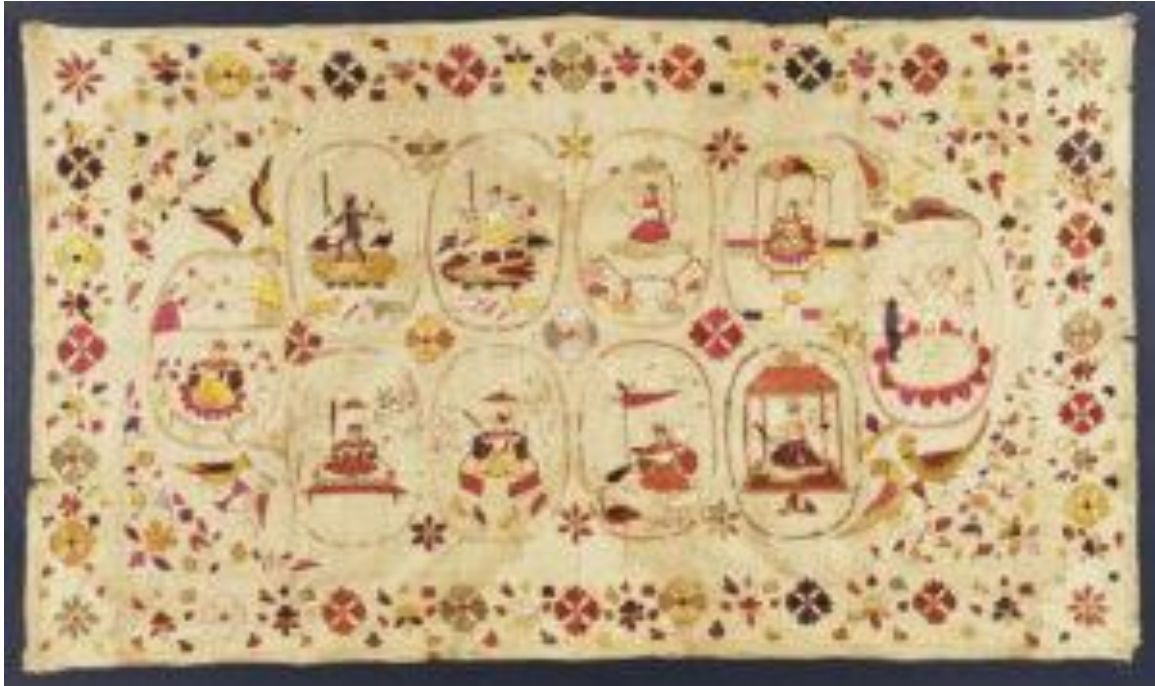
fig. 4 La série des Mahāvidyā, étoffe brodée ( rumal ), 82.5 x 142.2 cm, Chamba, Himachal Pradesh, vers 1800, Los Angeles County Museum of Art.