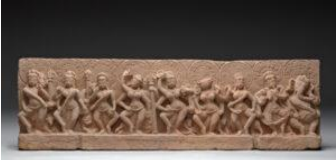
fig. 24 La série des Mātṛkā, entre Śiva et Gaṇeśa, 26.67 x 89.53 cm, Madhya Pradesh, IXe siècle, Los Angeles County Museum of Art.