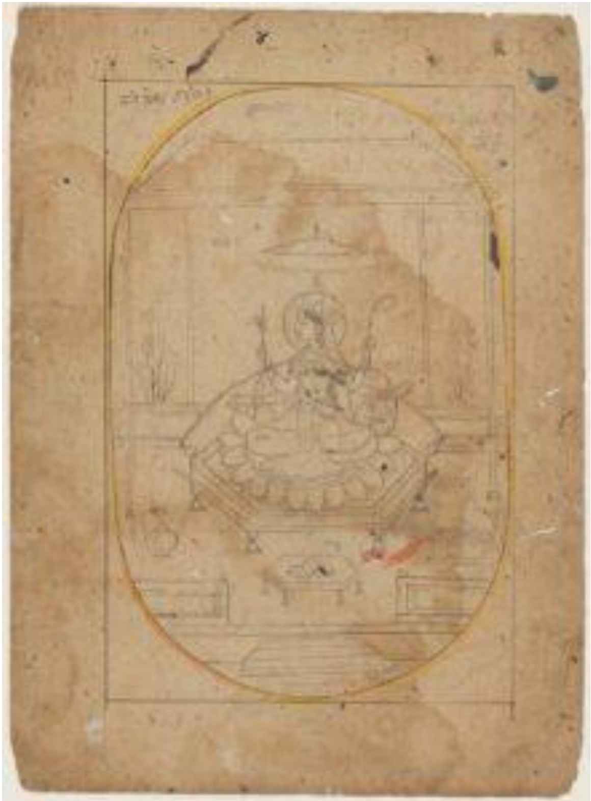
fig. 12 Bhūvaneśvarī, dessin, Himachal Pradesh, vers 1825, 21 x 13.8 cm, Museum of Fine Arts, Boston, acc. N. 17.2572.

Bhūvaneśvarī occupe sur l'étoffe peinte la quatrième position sur la rangée supérieure. Comme la précédente, elle est vêtue, couronnée et assise de