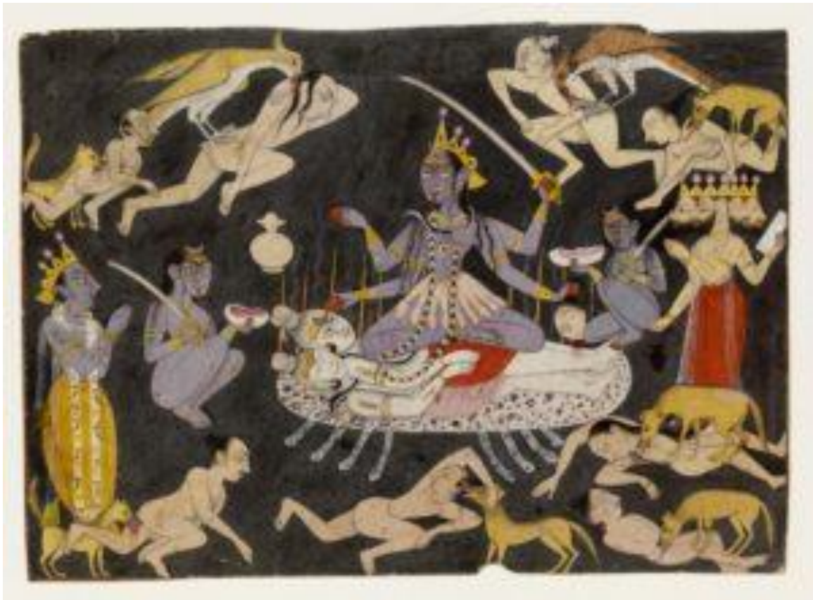
Fig.3 Kālī et Śiva (Śiva-Śava), Chamba, vers 1710, 13,3 x 18,8 cm, Victoria and Albert Museum, Londres, acc. n. IS.126-1951.

Cette mutation accompagne aussi celle de la déesse : alors que la Cāmuṇḍā des sculptures est décharnée et laide, ce n'est pas le cas des Yoginī, ni de la Kālī des Mahāvidyā ( fig.6 ), ni des autres Mahāvidyā debout ou assises sur Śiva, telles Tārā ( fig. 9 ), Tripurasundarī ( fig. 11 ) et Bhairavī ( fig.15 ). En passant du statut de Mātṛkā à celui de Mahāvidyā, la déesse macabre devient aussi une figure érotique, et le cadavre prend vie pour devenir son partenaire masculin. Ces quatre Mahāvidyā peuvent apparaître comme des variantes d'un thème iconographique bien connu dans la peinture pahārī : le rapport sexuel « inversé » du couple formé par Kālī et Śiva au sein d'un terrain de crémation ( fig.4 ). Dans ces images la figure masculine est souvent dédoublée. Le Śiva animé, uni à la déesse, repose sur un corps inanimé, qui parfois ne présente aucune caractéristique du dieu et se confond avec un cadavre sans identité : c'est le contact avec sa parèdre qui donne vie au dieu, et qui lui permet de passer de l'inconscience à la