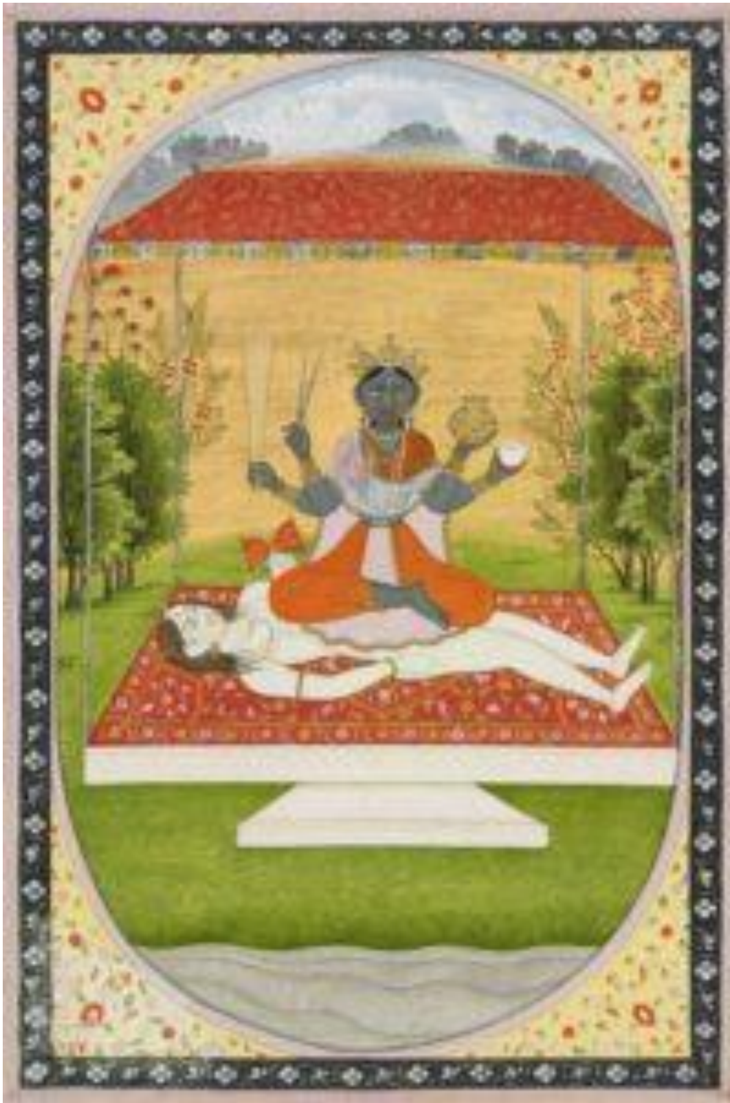
fig. 16 Bhairavī, Kangra ou Mandi, Himachal Pradesh, vers 1800, 21.6 × 13.4 cm, Arthur M. Sackler Gallery, Smithsonian Institution, Washington, acc.n. S2018.1.65