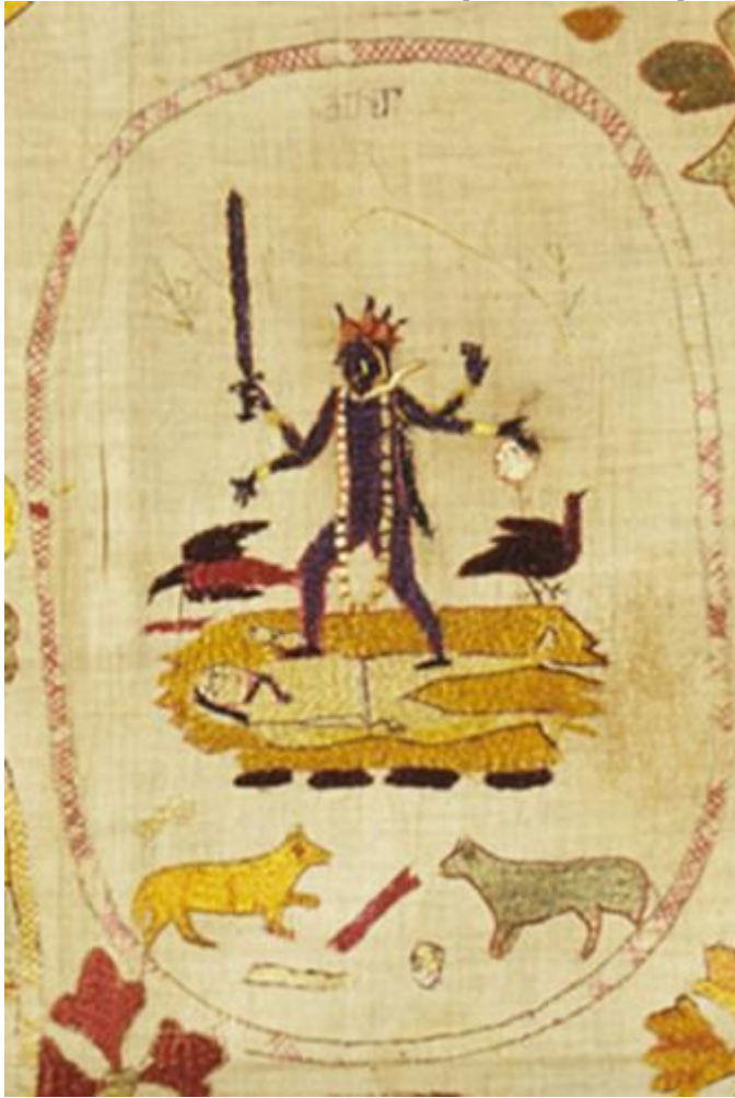
fig. 5 Kālī, étoffe brodée, 82.5 x 142.2 cm, Chamba, Himachal Pradesh, vers 1800, Los Angeles County Museum of Art, detail.