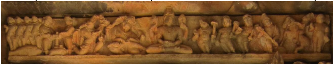
fig. 25 La série des Dix Avatars de Viṣṇu, linteau de porte, Xe siècle, Kadwaha, Madhya Pradesh.

Si Chinnamastā renvoie au kulayāga , la déesse Śrī (Kamalā) ondoyée par les éléphants pourrait bien illustrer la consécration de l'adepte tantrique, où le rituel de l'aspersion ( abhiśeka ) [68], identique à celui de l'onction royale, occupe une place importante. Cette consécration a lieu au terme d'une confrontation avec les puissances de la mort et de l'Éros, comme avec l'impureté et le manque. La parèdre de Viṣṇu représente non pas, comme dans la série des Sept Mères, le moment médian de la préservation, mais le point d'aboutissement du processus de transformation de l'adepte.