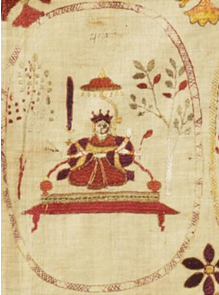
fig. 21 Mātangī, étoffe brodée, Chamba, Himachal Pradesh, vers 1800, 82.5 x 142.2 cm, Los Angeles County Museum of Art, detail.

Mātangī ( fig.21 ) est l'avant-dernière Mahāvidyā[63]. Son nom la désigne comme une hors-caste, une figure impure, qui se nourrit de restes. On sait que dans le tantrisme, la partenaire désignée pour les rites sexuels de « la main gauche » ( vamācāra ), qui reposent sur la transgression des interdits, peut porter un nom la présentant comme une hors-caste, tels caṇḍālī ou dhombī [64]. Nous n'avons pu trouver aucune miniature pahārī qui correspondrait à la figure de l'étoffe brodée, sur laquelle cette déesse est pourvue de quatre bras et tient des objets qui semblent correspondre à la description du Tantrasāra [65], et non au luth qu'on lui donne dans l'iconographie tardive comme dans le Mahodadhi Tantra [66] : le croc à éléphant et une épée dans ses mains droites, le lien dans une main gauche. Ces attributs peu spécifiques n'ont pas de rapport avec son statut de hors-caste.