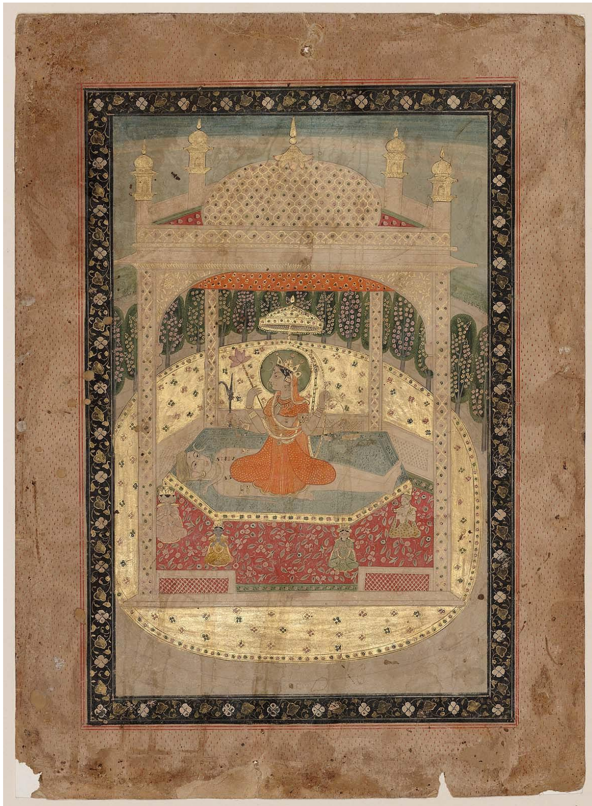
fig. 10 Tripurasundarī, Himachal Pradesh, 1825-1850, 28.8 x 21 cm, Museum of Fine arts Boston, acc. n.17.2598.