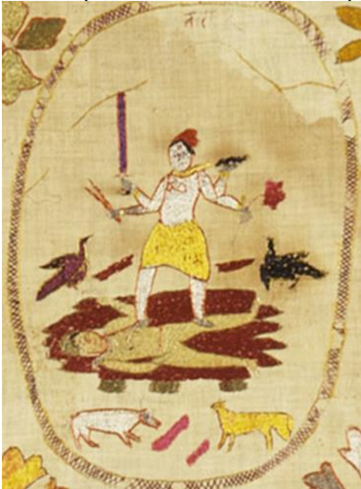
fig. 7 Tārā, étoffe brodée, Chamba, Himachal Pradesh, vers 1800, 82.5 x 142.2 cm, Los Angeles County Museum of Art, detail.

Walters Art Museum de Baltimore ( fig.6 ). Le personnage masculin qui tient dans sa main, à la place de son habituel trident, un fragment de colonne vertébrale auquel sont encore attachées des côtes est bien défini comme Śiva puisqu'il porte au front un croissant de lune et un troisième œil. Son sexe dressé souligne la connotation érotique de cette scène funèbre. La déesse est figurée de trois quarts, de façon à mettre en valeur les formes pleines et harmonieuses de son corps[29].