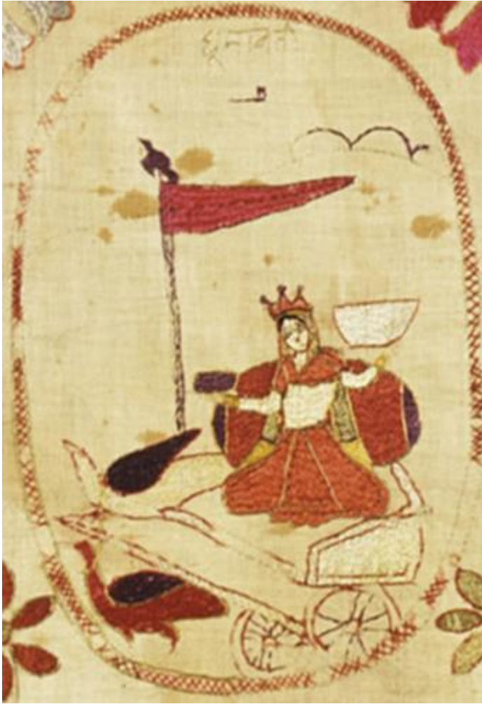
fig. 17 Dhūmavati, étoffe brodée, Chamba, Himachal Pradesh, vers 1800, 82.5 x 142.2 cm, Los Angeles County Museum of Art, detail.