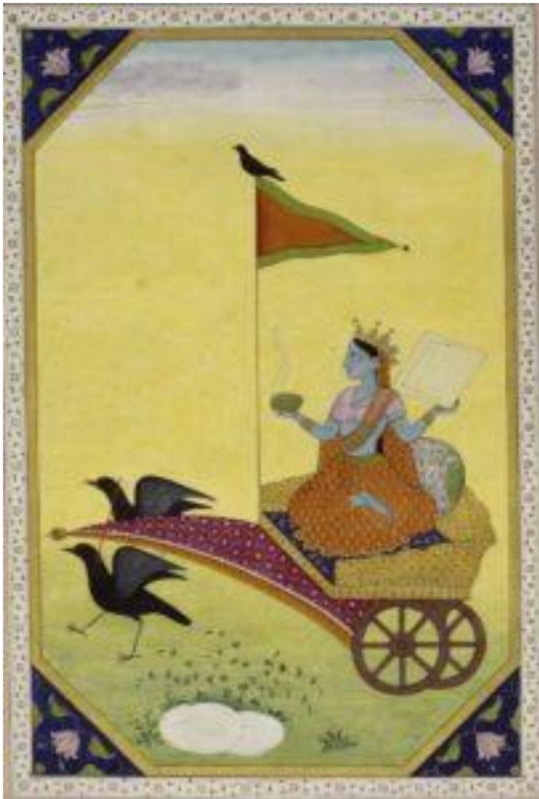
fig. 18 Dhūmavati, Himachal Pradesh, 1800- 1825, 27 x 20 cm, Musée Rietberg, Zürich.