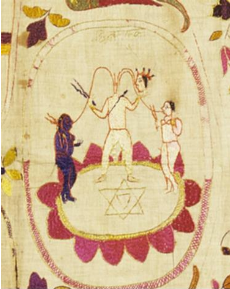
fig. 13 Chinnamastā, étoffe brodée, Chamba, Himachal Pradesh, vers 1800, 82.5 x 142.2 cm, Los Angeles County Museum of Art, detail.