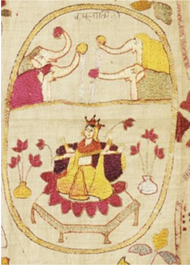
fig. 22 Kamalā, étoffe brodée, Chamba, Himachal Pradesh, vers 1800, 82.5 x 142.2 cm, Los Angeles County Museum of Art, detail.