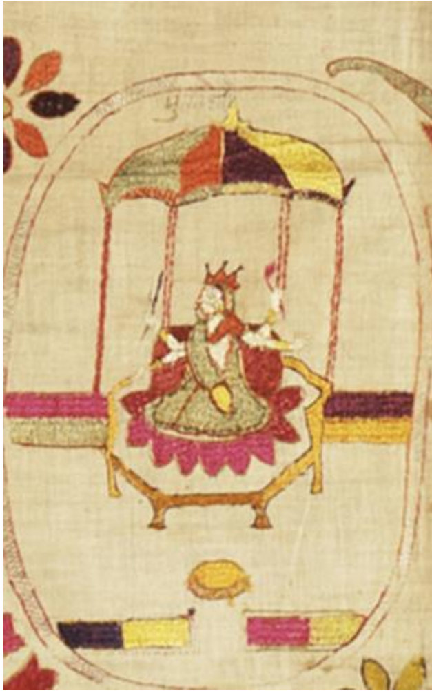
fig. 11 Bhūvaneśvarī, étoffe brodée, Chamba, Himachal Pradesh, vers 1800, 82.5 x 142.2 cm, Los Angeles County Museum of Art, detail.