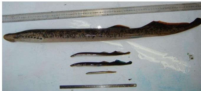
Photographie des trois espèces de lamproie présentes en France, de bas en haut : lamproie marine, lamproie de rivière (x2) et lamproie de Planer

Ensuite, nous avons développé un protocole de PCR quantitative, c'est-à-dire d'amplification ciblée et quantifiée d'une zone du génome, pour analyser en routine ce SNP diagnostique de L. fluviatilis et L. planeri . Ce marqueur nommé diagLpf a été testé sur 270 échantillons comprenant des larves et des adultes des deux espèces issus de 17 sites de France, mais aussi d'Irlande et du Royaume-Uni. Ces échantillons archivés au laboratoire proviennent pour la plupart d'études précédentes, et ont été collectés grâce au soutien de nombreuses fédérations de pêche et associations migrateurs. Nous avons aussi sollicité des collègues chercheurs du Royaume-Uni et d'Irlande pour avoir des échantillons à une large échelle spatiale afin de tester la validité de diagLpf au-delà des cours d'eau Français. En particulier, nous avons pu avoir des échantillons de la population de lamproies du Loch Lomond en Ecosse, qui possède la particularité d'abriter trois 'formes' de lamproies qui s'hybrident : la lamproie fluviatile (parasite-anadrome), la lamproie de Planer (non parasite-résident en eau douce), et une forme lacustre de la lamproie fluviatile qui parasite des poissons en eau douce.