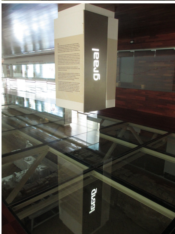
Figures 4 et 5

San Juan de la Peña, monasterio nuevo, centre d'interprétation, 26 août 2019. Sous le sol de dalles de verre, on distingue les pièces du monastère, reconstituées dans une visée didactique. Au plafond sont accrochés des blocs sur des thématiques diverses, qui apparaissent en lettres lumineuses. Parmi les blocs, un est dédié au « Graal ».