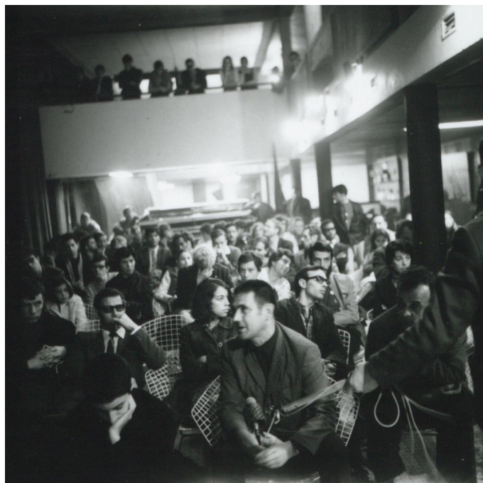
Photographie prise lors de la projection d' À bientôt j'espère dans les locaux du CCPO, Besançon, 27 avril 1968.

Dans un climat de colère palpable dans l'enregistrement sonore fait ce soir-là, une partie des ouvriers et des ouvrières de l'usine rejette le film qui, selon eux, élude de nombreuses dimensions de la vie ouvrière : la discipline imposée à l'usine, la surveillance, le sexisme, etc. En un mot, pour beaucoup, la « réalité » ne serait pas filmée : ils ne se reconnaissent pas 18 .