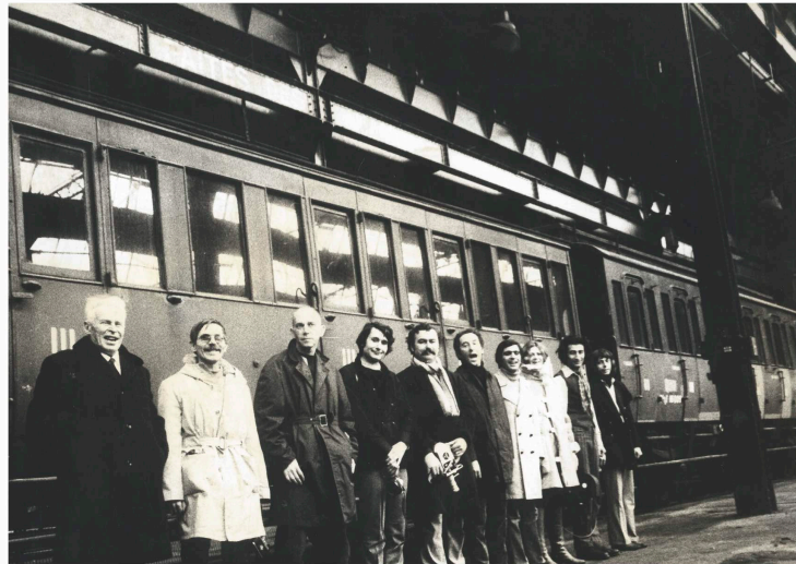
Équipe de tournage du Train en marche , Noisy-le-Sec, janvier 1971.

Marker profitera également de cette visite pour le filmer, et tourner avec le collectif SLON la seule interview de lui évoquant l'expérience du Ciné-train. Ce film, intitulé Le Train en marche , tourné à la gare de Noisy-le-Sec, reste aujourd'hui inédit et d'une grande valeur documentaire 81 .