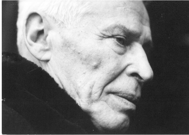
Alexandre Medvedkine sur le tournage du Train en marche. Noisy-le-Sec, 1971.

On souhaiterait en savoir davantage sur leurs points de concordance, ou, au contraire, sur leurs divergences, tout comme nous manquons des informations sur le regard rétrospectif de Medvedkine sur son Ciné-train dans les années 1960, son regard sur les luttes françaises, l'évolution de l'URSS... Ces questions font naître le souhait d'analyser leur correspondance, conservée au musée du Cinéma de Moscou, et susceptible de lever le voile sur ces aspects, comme de nous révéler les pans les plus sensibles de leur relation, dans leur rapport à la condition humaine, aux idées et au monde.