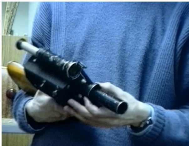
Caméra-fusil mise au point par Medvedkine en 1942. Photogramme extrait du film Le tombeau d'Alexandre, de Chris Marker.

Cette période représente pour Marker l'occasion d'approfondir plusieurs aspects de son cinéma : le sens de son engagement politique, la place à donner au cinéma dans le système de production et de distribution capitaliste, le rôle idéologique du cinéma.