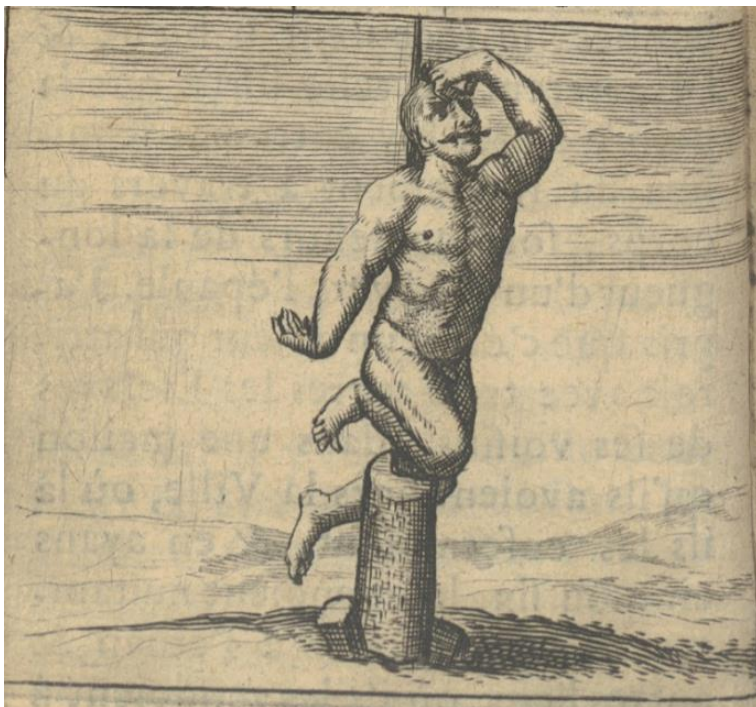
Fig. 1 : Le supplice de l'empalement, Pierre-Martin de La Martinière, L'heureux esclave , Paris, Olivier de Varennes, 1674, p. 24

La gravure insérée dans le récit de l'auteur semble en-deçà de la scène décrite dans le texte (voir fig. 1). Le visage du « patient », que la moustache identifie à un Turc conformément à l'iconographie contemporaine 41 , ne paraît pas particulièrement déformé par la douleur, alors que le narrateur explique qu'il est dans « dans une telle rage, qu'étant ainsi embroché comme un coq d'Inde, heurlant comme un chien, il s'égratignoit le visage du côté que le pal ne passoit pas, avec tant de courage que la peau en étoit arrachée, s'ôta un œil de la tête, et demeura ainsi en vie trois jours entiers 42 ». L'assimilation animale signale toute la distance émotionnelle entretenue par l'auteur à l'égard de cette victime.