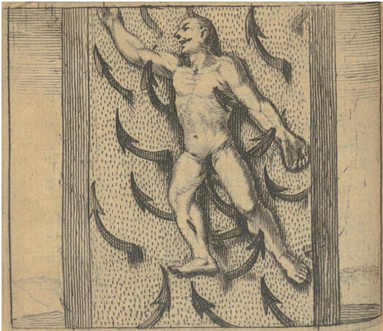
Fig. 2 : Le supplice de la gange, Pierre-Martin de La Martinière, L'heureux esclave , op. cit., p. 154

Guy Turbet-Delof intègre cette scène aux aventures « très fantaisistes 43 » narrées par La Martinière, qui correspondraient moins à la reproduction d'une réalité historique qu'à un souci de séduction du lectorat, en se conformant à une image stéréotypée de l'Orient : « Le pal est [...] du petit nombre des accessoires conventionnels qui vous turquisent un décor 44 . » L'Orient apparaît bien comme une (re)création de l'Occident, comme s'emploie à le montrer Edward W. Saïd [p. 82] concernant les représentations du XIX e siècle. Cette scène horrifique n'a-t-elle cependant pour fonction que de satisfaire le goût du lectorat pour les sensations fortes (voir fig. 2 et 3 45 ) ?