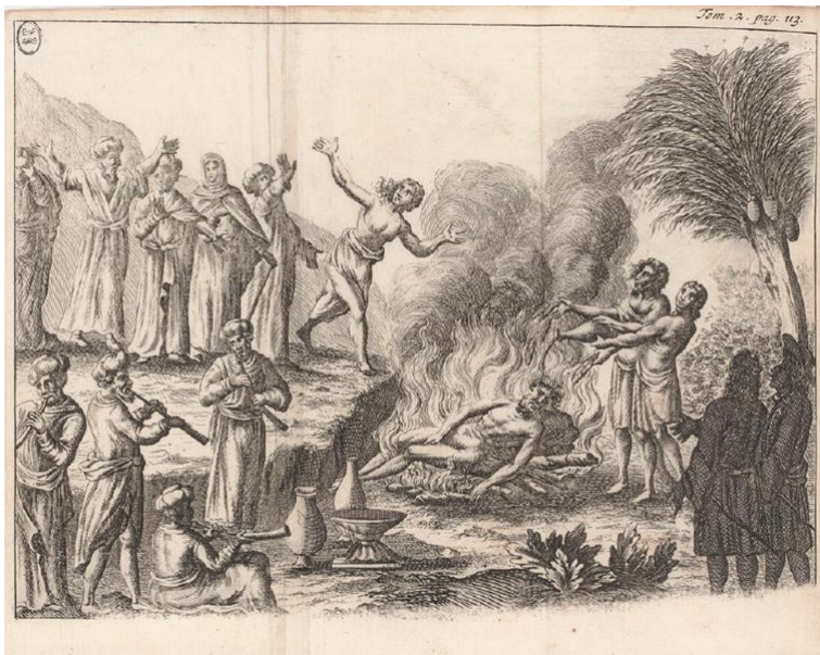
Fig. 4 : Sacrifice d’une veuve hindoue, François Bernier, Voyages , Amsterdam, Paul Marret, 1699, vol. 2, entre les pages 112 et 113