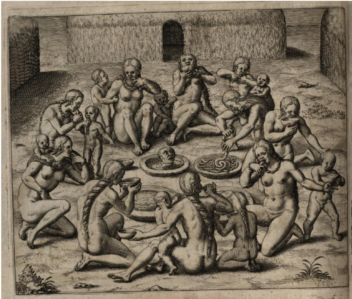
Fig. 2. Théodore de Bry, Americæ tertia pars , Francfort, Johann Wechel, 1592, p. 128 (Paris, (Cologne, Fondation Martin Bodmer, De Bry, 1439, https://bodmerlab.unige.ch/fr/constellations/de-bry/mirador/1072056535?page=160 ).

structure du mythe de la sorcière est bien conservée – avec les motifs de la vieillesse, de la marginalité et de la transgression – et son transfert au Nouveau Monde ne modifie pas fondamentalement son sens. Il semble plutôt que ce mythe européen soit plaqué sur la société brésilienne, à la manière d’une grille de lecture, selon une démarche assimilationniste analysée par Todorov, qui consiste en une « projection de ses propres valeurs [et croyances] sur les autres 49 » (fig. 2).