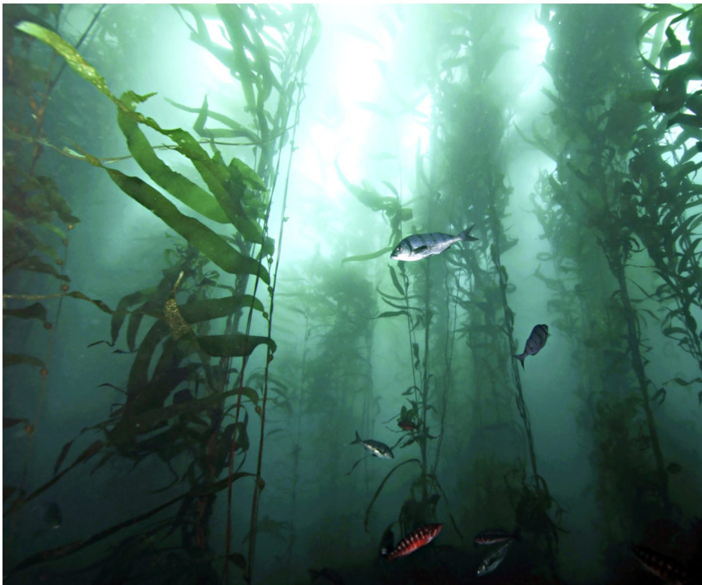
Forêt de Macrocystis pyrifera ancrée sur des blocs couverts d'algues rouges et d'éponges au large de l'île d'Amsterdam. Ces forêts sont l'habitat transitoire de Nemadactylus monodactylus (le "bleu", dont trois spécimens sont visibles ici) et Serranus novemcinctus (le "rouge", en bas du cliché).