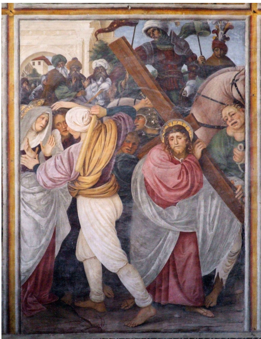
Fig 2. Gaudenzio Ferrari, Montée au calvaire du jubé , détail des Histoires de la vie et de la passion du Christ , fresque, 1513, Église Santa Maria delle Grazie, Varallo Sesia, Italie © wikimedia commons.