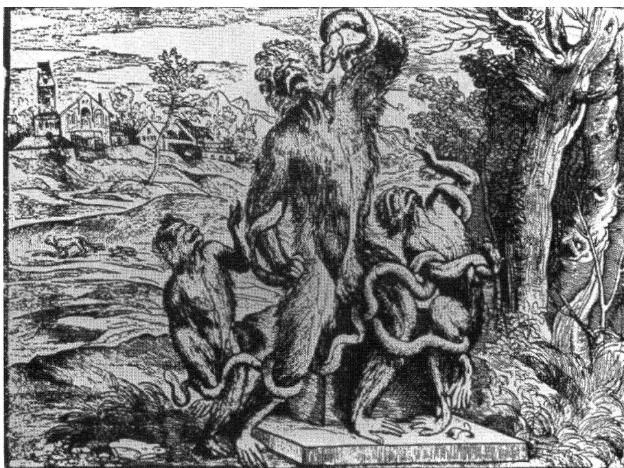
Fig 4. D'après Titien (?), Caricature du Laocoon (Source : article de Michel Hochmann, https://journals.openedition.org/rji/940#bodyftn20 ).

Le choix du Laocoon comme paradigme de la représentation martyrologique traduit donc bien l'ambiguïté de la pensée tridentine sur la figuration artistique de l'horreur : même aux yeux des théoriciens, qui pourtant s'en prévalent, le paradoxe aristotélicien ne saurait à lui tout seul racheter l'abject d'une représentation trop réaliste de la cruauté du martyre. Comment expliquer cette réticence des Italiens à priver les suppliciés vertueux de toute harmonie ?