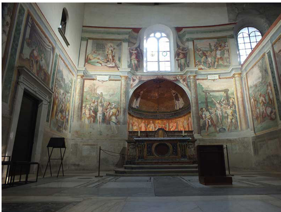
Fig 3. Antonio Tampesta et Pomarancio, Martyrologue, c. 1580, fresque, Église Santo Stefano Rotondo, Rome, Italie