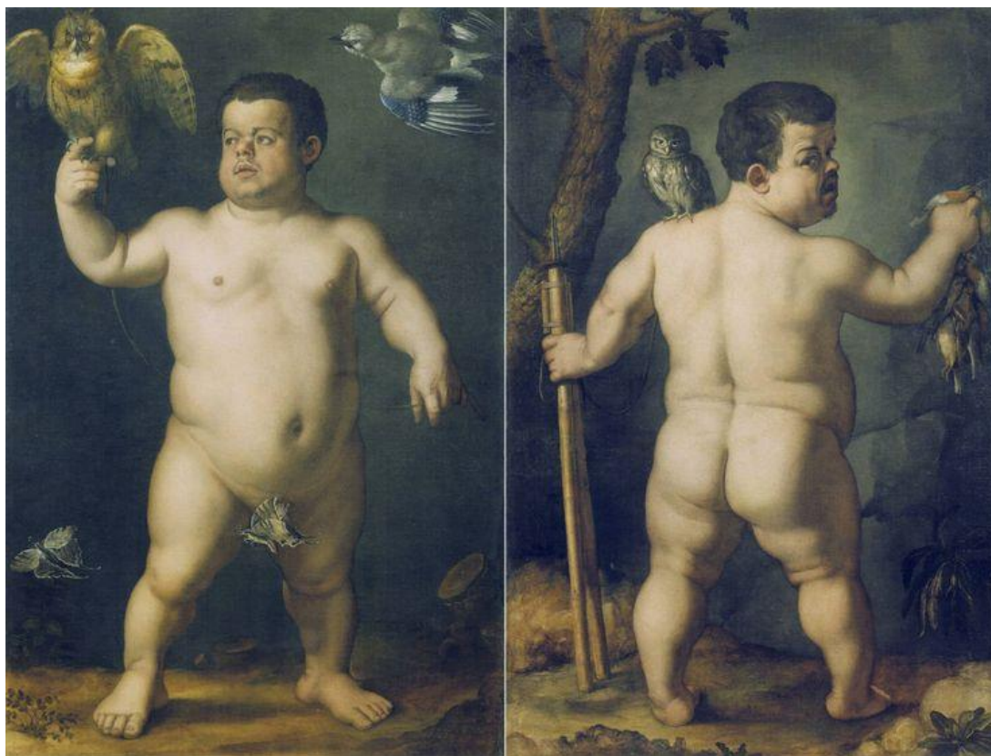
Fig. 1 – Agnolo Bronzino, Doppio ritratto del nano Morgante , ante 1553. Firenze, Galleria degli Uffizi.