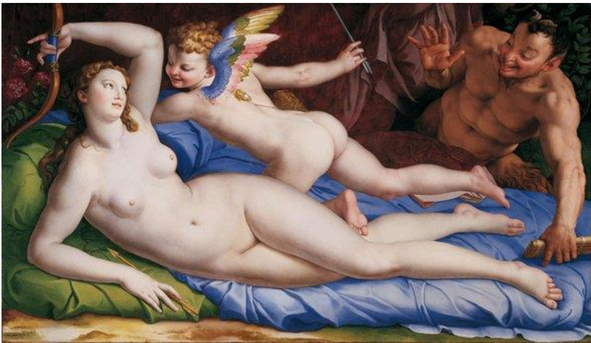
Fig. 8 – Agnolo Bronzino, Veneri e Cupido con satiro , 1553-1555 circa. Roma, Palazzo Colonna.