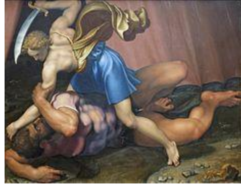
Fig. 3 – Daniele da Volterra, Davide e Golia , 1555 circa. Parigi, Musée du Louvre.