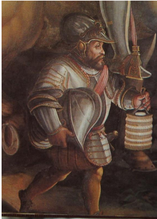
Fig. 6 – Giorgio Vasari, Giovan Battista Naldini, Giovanni Stradano, dettaglio de L'assalto al forte di Siena presso la porta Camilla , 1556 circa. Firenze, Palazzo Vecchio.