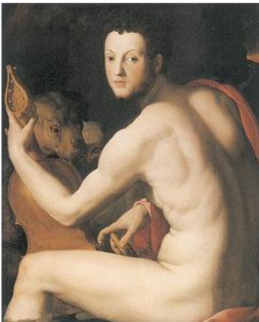
Fig. 4 – Agnolo Bronzino, Ritratto di Cosimo I come Orfeo , 1538-1540 circa. Filadelfia, Philadelphia Museum of Art.