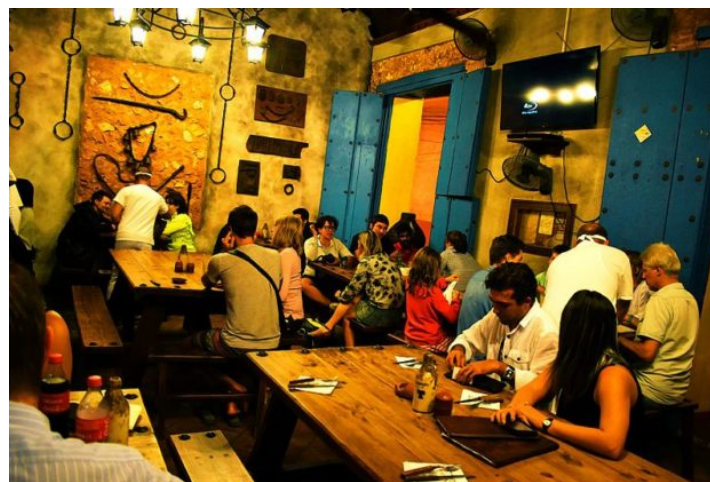
Taberna La Botija, Trinidad, Cuba, 2016.

Les lecteurs attendus de ces carnets sont d'abord, bien entendu, des étudiant.es : inscrit.es en Licence intéressés par une poursuite d'étude dans ce Master , et masterants d'autres universités ,