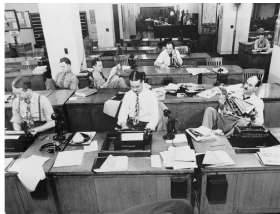
La rédaction du New York Times dans les années 20, source d'inspiration pour les apprentis rédacteurs du carnet !

Enfin, les différents partenaires de l'Université dans le monde économique, associatif ou culturel , par exemple les institutions hébergeant les stages prévus dans le cadre du master, ou les futurs employeurs de ces jeunes diplômés, y verront une passerelle entre les mondes du travail, de l'enseignement et de la recherche.