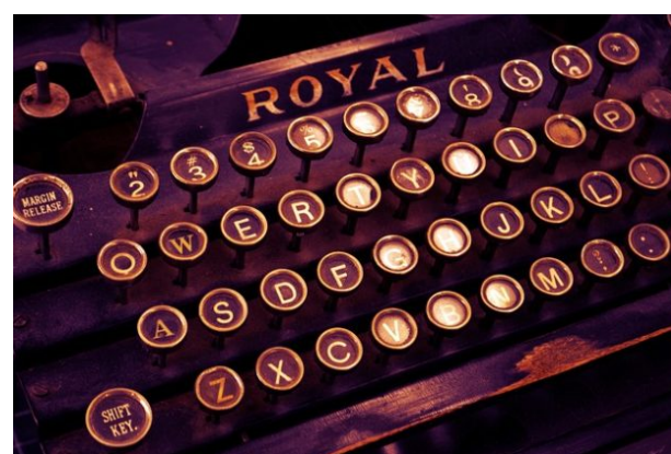
Du livre à l'écran, il n'y a que quelques touches... (source:

Une catégorie de billets méthodologiques rend compte de ces premiers pas d'apprentis-chercheurs: premières immersions en archives, démêlés avec un sujet difficile, conseils méthodologiques issus de l'expérience des "masterant.es"... La lecture de ces billets peut être riche d'enseignements pour les (futurs) étudiants de master comme pour leurs enseignants !