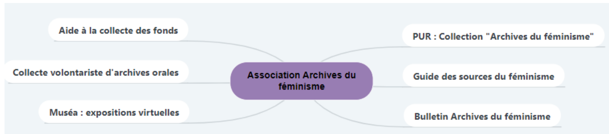
Figure 1 : L'association Archives du féminisme mène un travail de sensibilisation, de valorisation et de collecte considérable

C'est alors que l'historienne Christine Bard, maîtresse de conférences depuis 2015 à Angers, intervient. Elle fonde le 24 juin 2000 une association loi de 1901, Archives du Féminisme 2 dont la raison d'être est de coordonner les efforts des archivistes, chercheuses et militantes pour mieux préserver les archives des associations et des militantes féministes.