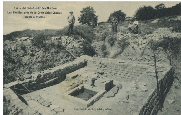
Fig. 2. Alise-Sainte-Reine. Cartes postales des fouilles de la Société des sciences de Semur (en haut) et d'Espérandieu à la Croix-Saint-Charles (en bas).

équivalent à 10 % (2 303 F) des recettes annuelles 9 . Mais les cartes postales mettant en scène les fouilles deviennent un enjeu de pouvoir dans le cadre de la querelle entre Espérandieu et la Société des sciences, du fait de la visibilité qu'elles donnent aux découvertes des deux chantiers qui se font désormais concurrence sur le Mont Auxois. Face aux cartes postales des fouilles de la Société des sciences de Semur, marquées Pro Alesia , l'équipe d'Espérandieu se lance dans l'édition de ses propres cartes postales, preuve de l'importance de ces images photographiques dans l'histoire archéologique du Mont Auxois au début du xx e siècle (fig. 2). Les collaborateurs d'Espérandieu abordent la question dans les courriers qu'ils échangent :