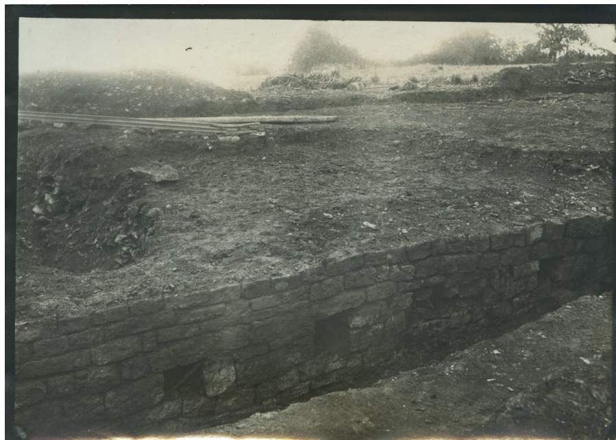
Fig. 1. Murus gallicus de la Croix-Saint-Charles et ses fiches de fer.