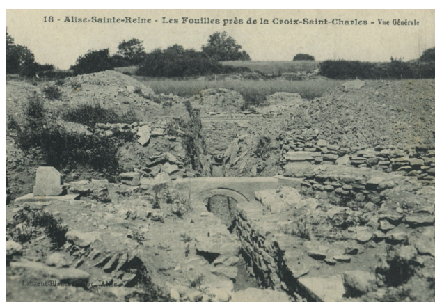
Fig. 6. Fouilles de la Croix-Saint-Charles. Carte postale de l'édifice hexagonal au sud des thermes.

Si cette carte postale confirme qu'en 1911 la base de pilastre a été volontairement placée au niveau de l'édicule hexagonal, un examen plus général du fonds photographique des fouilles d'Alise au palais du Roure permet de se rendre compte, d'une part, que ce n'était pas la première