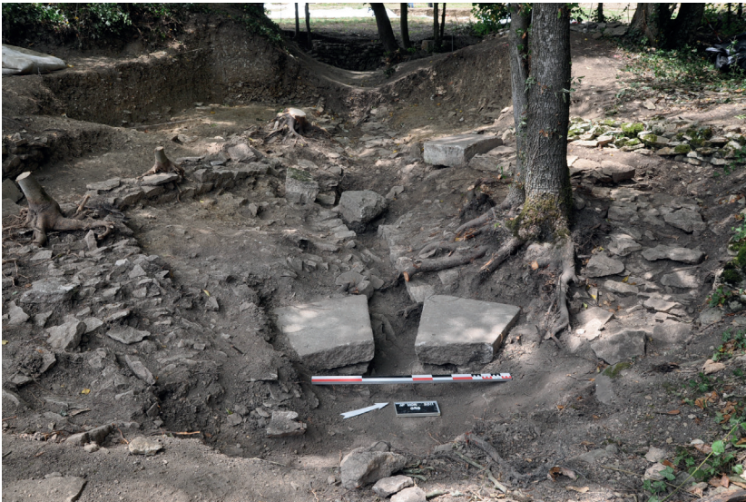
Fig. 7. Remise au jour en 2011 de l'édifice hexagonal au sud des thermes et de la base de pilastre.