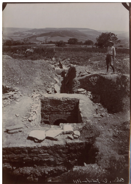
Fig. 5. Zone au sud des thermes de la Croix-Saint-Charles. Photographie réalisée le 20 juillet 1911.