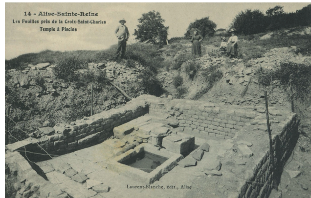
Fig. 2. Alise-Sainte-Reine. Cartes postales des fouilles de la Société des sciences de Semur (en haut) et d'Espérandieu à la Croix-Saint-Charles (en bas).

équivalent à 10 % (2 303 F) des recettes annuelles 9 . Mais les cartes postales mettant en scène les fouilles deviennent un enjeu de pouvoir dans le cadre de la querelle entre Espérandieu et la Société des sciences, du fait de la visibilité qu'elles donnent aux découvertes des deux chantiers qui se font désormais concurrence sur le Mont Auxois. Face aux cartes postales des fouilles de la Société des sciences de Semur, marquées Pro Alesia , l'équipe d'Espérandieu se lance dans l'édition de ses propres cartes postales, preuve de l'importance de ces images photographiques dans l'histoire archéologique du Mont Auxois au début du xx e siècle (fig. 2). Les collaborateurs d'Espérandieu abordent la question dans les courriers qu'ils échangent :