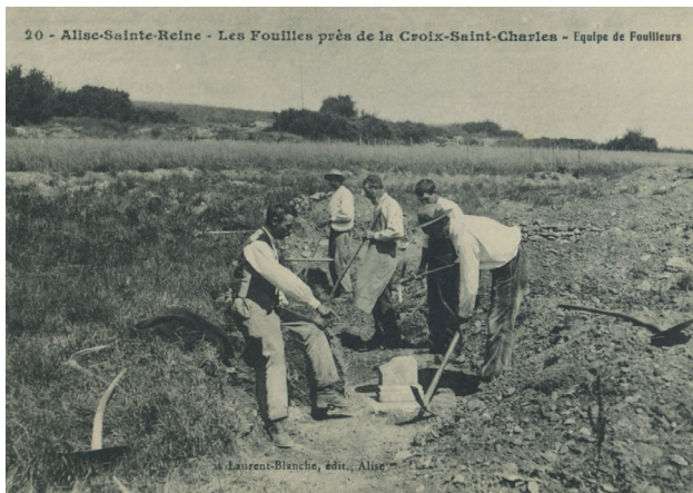
Fig. 8. Fouilles de la Croix-Saint-Charles. Carte postale mettant en scène la découverte d'une base de pilastre.