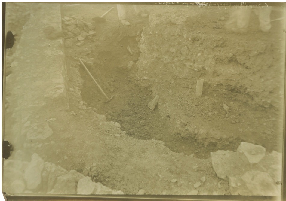
Fig. 10. Fouilles de la Croix-Saint-Charles. Cliché de fouilles réalisé dans la galerie périphérique du temple d'Apollon Moritasgus.

sûr, mais surtout l'angle de prise de vue, et plus encore les terres de déblais trop proches ne permettent pas une vision correcte (fig. 10).