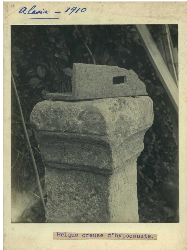
Fig. 4. Exemple de prise de vue d'objet archéologique réalisée sur le terrain.

Dans les rapports annuels et les articles d'étape, les photographies d'objets sont souvent détournées, à la main et aux ciseaux. Le fond de la prise de vues n'a donc aucune importance. Inversement, les archives photographiques du palais du Roure livrent plusieurs clichés avant détournement qui témoignent de la façon dont les prises de vue d'objets