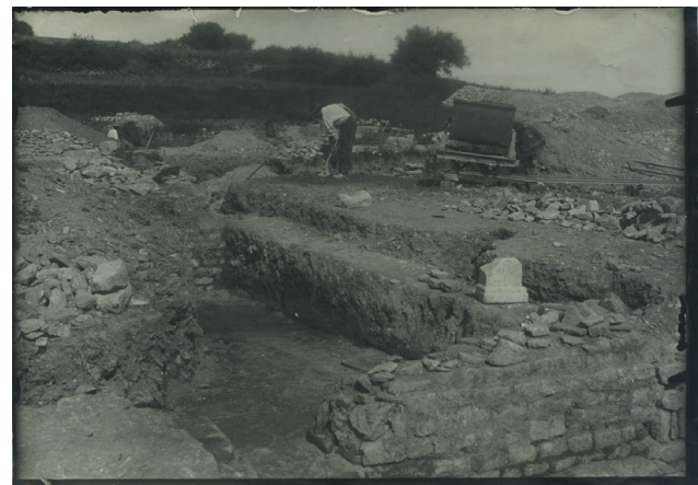
Fig. 9. Fouilles de la Croix-Saint-Charles. Cliché de fouilles réalisé dans les thermes.

confiance absolue à l'image, pourtant censément plus objective que toute autre forme de documentation. Elle peut se prêter à toutes sortes de manipulations ou n'avoir de valeur qu'anecdotique, quand sont réalisés de véritables « portraits de groupe » d'ouvriers. Ils montrent du moins l'estime qu'Espérandieu a pour eux (il en fait mention dans ses rapports). Ces clichés ont aussi, à la marge, valeur de témoignage en documentant les techniques de fouilles employées : emploi des wagonnets Decauville et gestion des déblais, avec l'érection de murets de soutènement en général assez soigneusement réalisés, et l'amoncellement de tas au plus près de la fouille, tandis que la baraque de fouille apparaît parfois à l'arrière-plan.