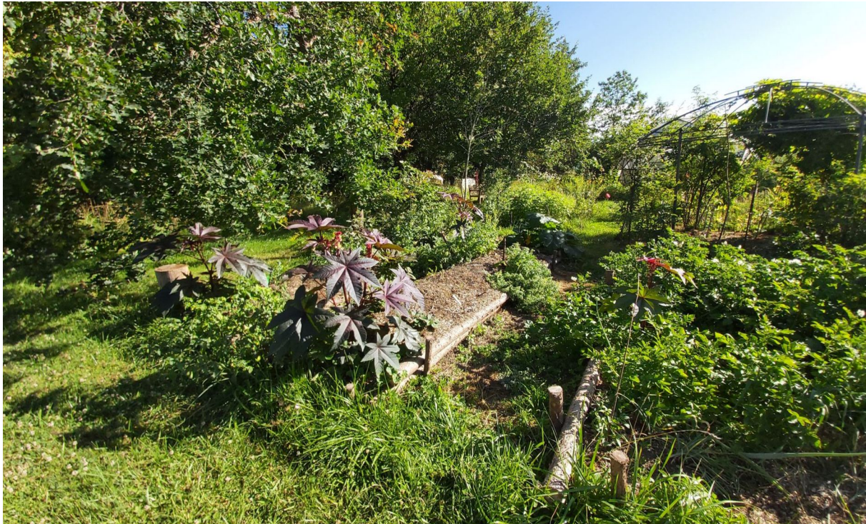
Photographie de l'auteur, Drôme, 2020.