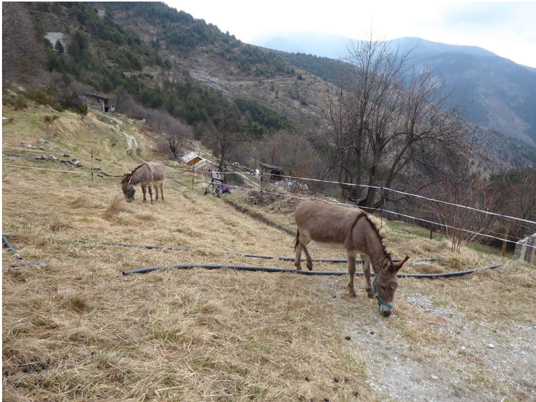
Photographie de l'auteur, 2021.