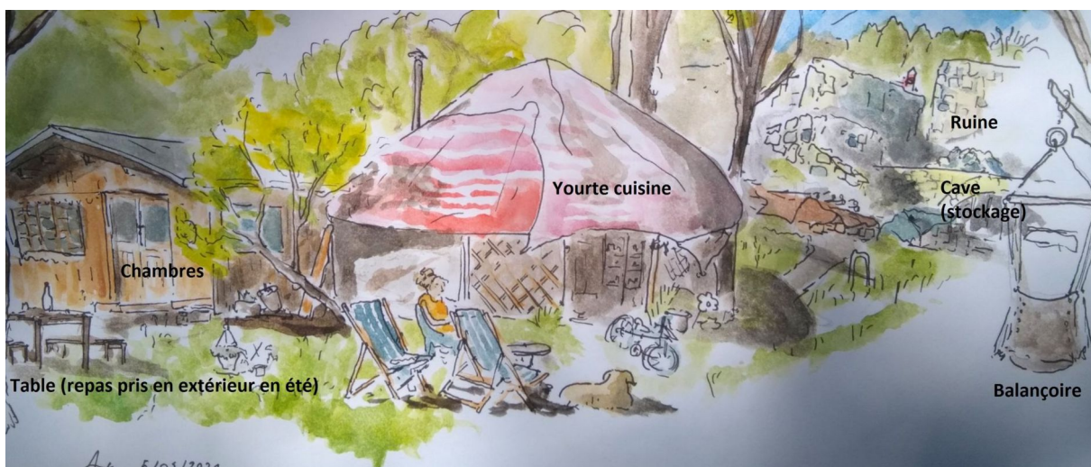
Aquarelle de l'auteur, 2021.

Bien que ce ne soit pas une règle exclusive, ce sont plutôt ces derniers qui vont insister sur la place laissée au travail d'entités naturelles, mais aussi sur la naturalité de leur travail et de leurs activités. À l'inverse un rapport professionnel au travail, ancré dans des exigences marchandes plus poussées que sur un lieu visant à l'autonomie vivrière, contribue à une mise à distance de ces idées et au choix d'actions plus interventionnistes, passant par exemple par un certain degré de mécanisation. Un maraîcher professionnel peut ainsi plus difficilement se permettre de perdre une production qui correspond à un investissement et à des attentes de la part des clients (qui réclament un éventail varié de fruits et légumes à chaque saison : une