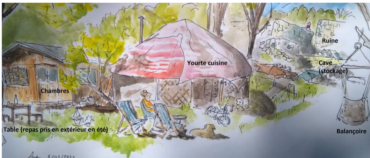
Aquarelle de l'auteur, 2021.

Bien que ce ne soit pas une règle exclusive, ce sont plutôt ces derniers qui vont insister sur la place laissée au travail d'entités naturelles, mais aussi sur la naturalité de leur travail et de leurs activités. À l'inverse un rapport professionnel au travail, ancré dans des exigences marchandes plus poussées que sur un lieu visant à l'autonomie vivrière, contribue à une mise à distance de ces idées et au choix d'actions plus interventionnistes, passant par exemple par un certain degré de mécanisation. Un maraîcher professionnel peut ainsi plus difficilement se permettre de perdre une production qui correspond à un investissement et à des attentes de la part des clients (qui réclament un éventail varié de fruits et légumes à chaque saison : une