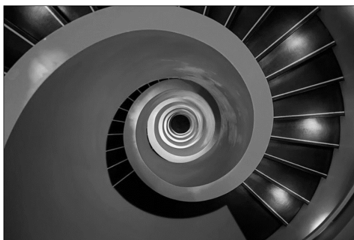
Figure 2 – Un escalier, une fractale ou les deux? 14

Nous conserverons cette image du kaléidoscope, outil permettant d'observer différentes compositions d'un système dynamique complexe. Nous conserverons également la représentation symbolique des systèmes dynamiques de l'acquisition et de l'autonomie dans l'apprentissage des langues en tant que fractales, organisées selon des principes hors de notre échelle familière de perception, et mises en mouvement par différents sous-systèmes en interaction. Pour illustrer notre transposition de ces images au contexte de la formation en langues-cultures en master MEEF, nous proposons d'observer cette image d'un escalier à la conception fractale.