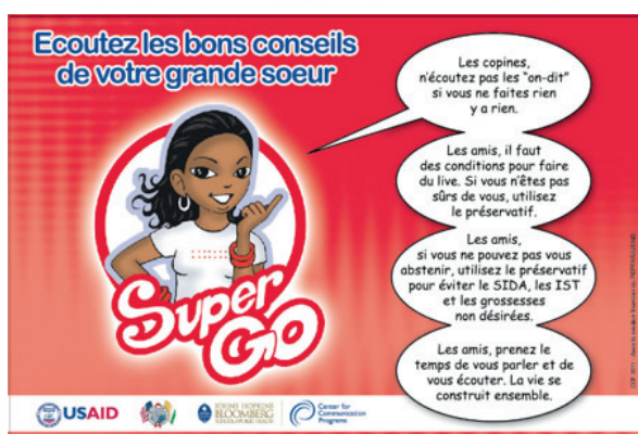
Exemples de messages à destination des adolescent.e.s en Côte d'Ivoire

L'étude des documents des programmes et les entretiens avec leurs responsables à Abidjan montrent que les messages centraux de prévention à destination des adolescent.e.s sont, malgré les différents acteurs initiant ces campagnes, assez semblables dans leur contenu. On y prône l'abstinence avant toute chose, alors même que les adolescent.e.s ont une sexualité active ; puis l'utilisation du préservatif et autres méthodes contraceptives, tout en prônant la fidélité