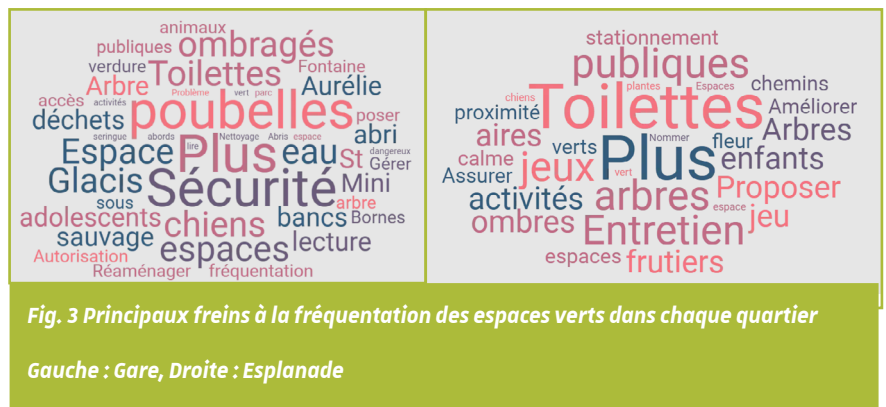
Fig. 3 Principaux freins à la fréquentation des espaces verts dans chaque quartier

de la Gare, des craintes fondées sur un sentiment d'insécurité (routière, présence de certains publics) ou des conflits d'usage entre les différents publics des espaces verts (familles / adolescents, groupement d'hommes / consommateur d'alcool / de drogues) freinent fortement la venue des habitants du quartier dans ces espaces. Des solutions sont cependant envisageables autour de la dotation du quartier Gare d'un véritable parc de proximité à partir d'un réaménagement interne et des abords permettant de faciliter l'accès au parc du Glacis ou la création de véritables espaces verts éphémères sur la voirie qui à termes pourrait se pérenniser et homogénéiser la répartition des espaces verts dans le quartier. Outre ces aménagements lourds, il est également possible de jouer sur la complémentarité des espaces verts et places publiques par exemple, avec une éventuelle spécialisation des activités dans ces lieux à des moments particuliers de la journée ou de la semaine.