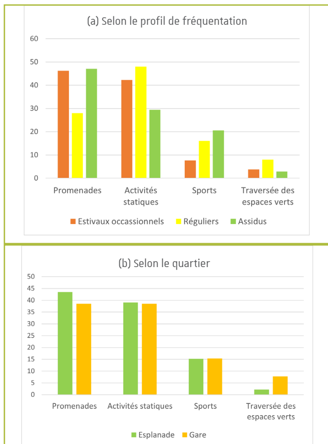
Figure 4 Pratiques d'activités dans les espaces verts

cours des entretiens avec les acteurs des centres socio-culturels qui proposent aux résidents des quartiers de plus en plus d'activités physiques modérées dans les espaces verts de proximité. D'autres leviers pour encourager la pratique physique en déployant des équipements ou en s'appuyant sur les tracés des Vitaboucles (Circuits d'activité physique proposés par l'Eurométropole), peuvent également être réfléchis en