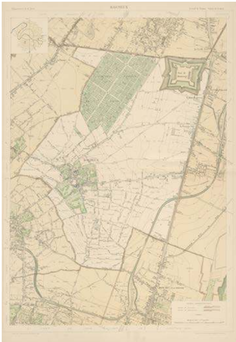
Fig. 1 : Plan de Bagnex, 1894-1900 (Archives départementales des Hauts-de-Seine, 5FI/Bag 3). Le cimetière parisien de Bagnex est ouvert en 1886.