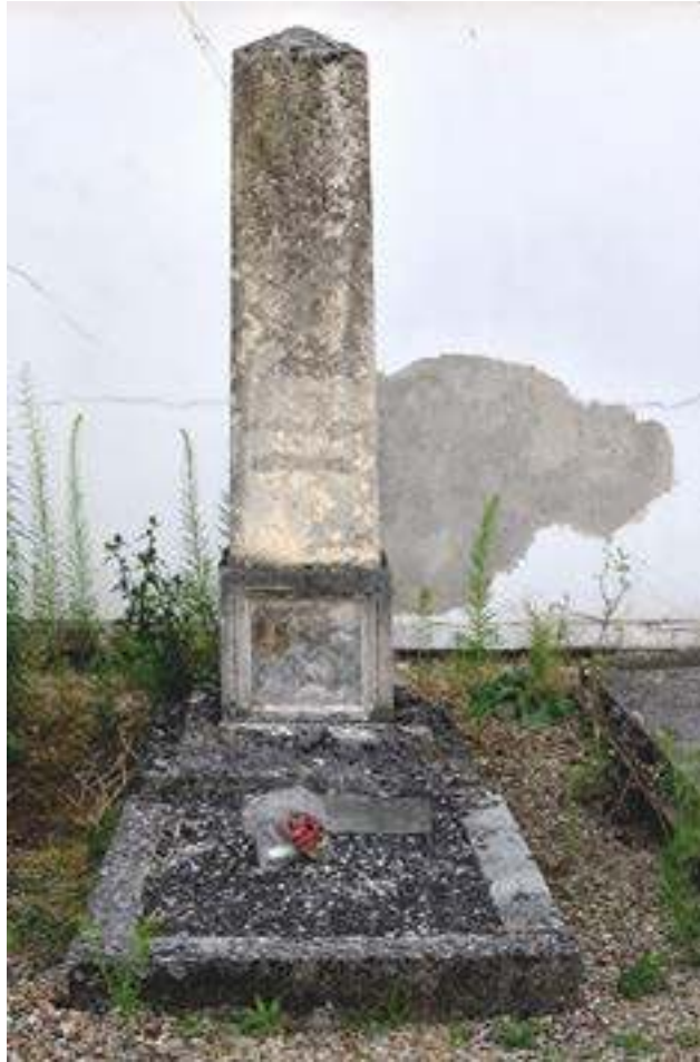
Fig. 3 : La tombe de Jeanne Moyaux au cimetière municipal de Bagnaux (photographie de Françoise Monfrin, 4 juillet 2018). Crédits photographiques : Françoise Monfrin.

Des funérailles au tombeau, l'hommage à la petite fille est avant tout celui rendu par la communauté. Elle est distinguée par-delà la mort par la monumentalité de sa tombe qui s'offre aux regards de tous dans l'espace du cimetière.