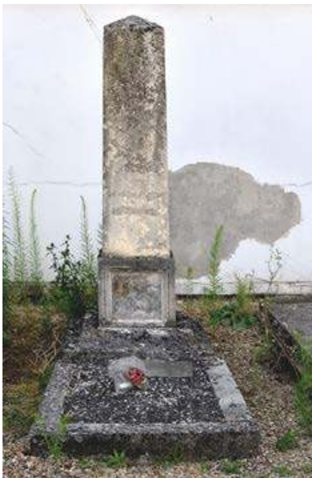
Fig. 3 : La tombe de Jeanne Moyaux au cimetière municipal de Bagnaux (photographie de Françoise Monfrin, 4 juillet 2018). Crédits photographiques : Françoise Monfrin.

Des funérailles au tombeau, l'hommage à la petite fille est avant tout celui rendu par la communauté. Elle est distinguée par-delà la mort par la monumentalité de sa tombe qui s'offre aux regards de tous dans l'espace du cimetière.