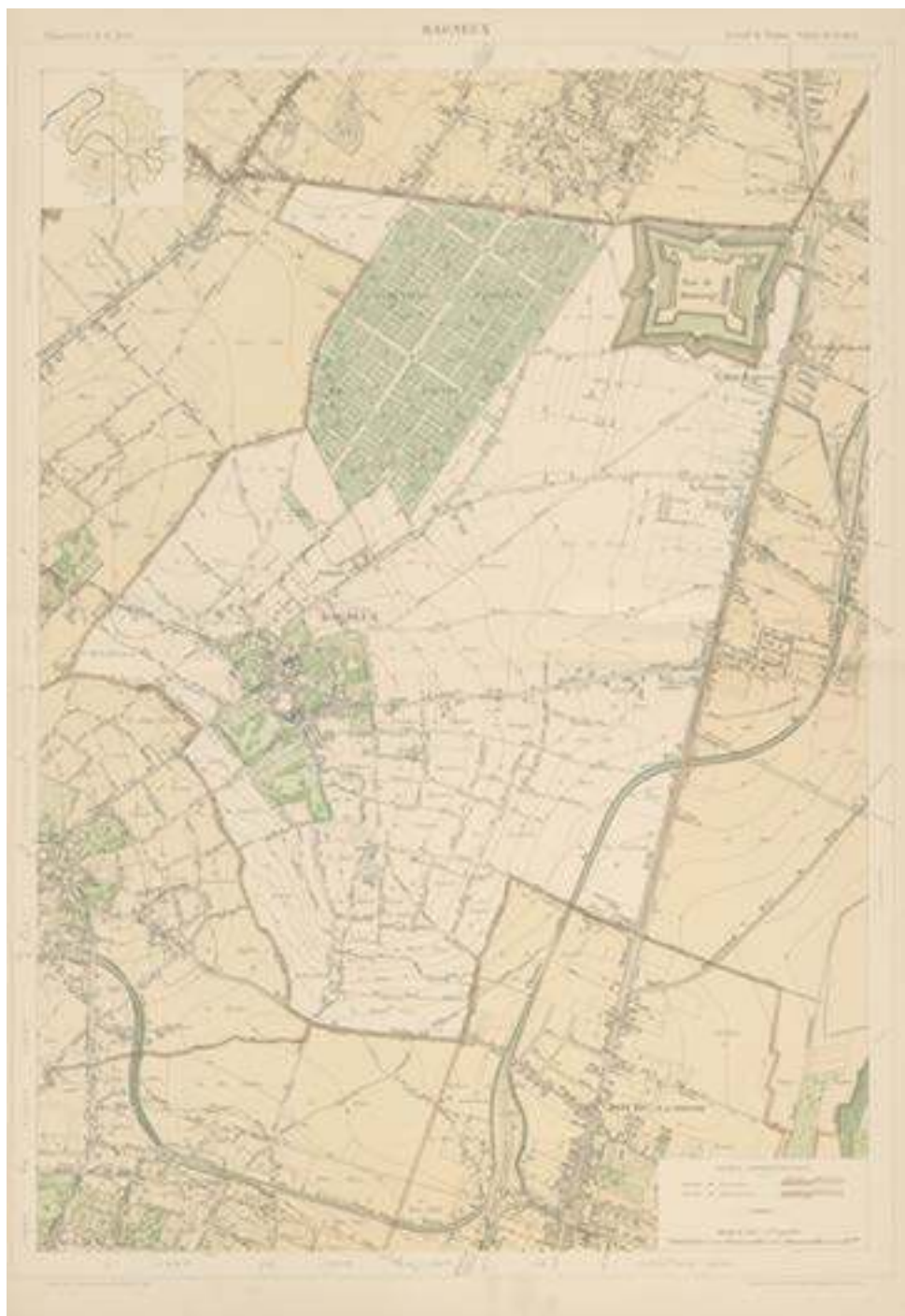
Fig. 1 : Plan de Bagneux, 1894-1900 (Archives départementales des Hauts-de-Seine, 5FI/Bag 3). Le cimetière parisien de Bagneux est ouvert en 1886.