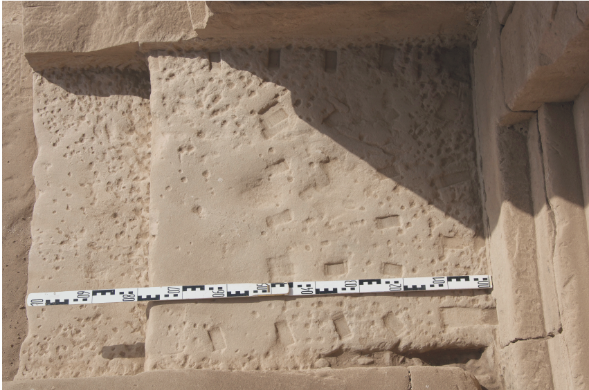
Fig. 9 Palier du mammisi « romain » avec le détail du réseau de cavités définissant sa planimétrie finale (© Mission archéologique de Dendara, P. Zignani).

centrale ne correspond pas à l'expansion de l'espace que l'on a pu mettre en évidence dans les sanctuaires où réside une divinité 28 . À l'intérieur du mammisi, la largeur en plan des passages centraux est constante 29 . L'état d'inachèvement du bâtiment a permis d'approfondir la manière antique de contrôler la forme architecturale, tant au regard du ravalement, de la planimétrie, que de la précision de la taille des éléments, y compris des colonnes 30 .