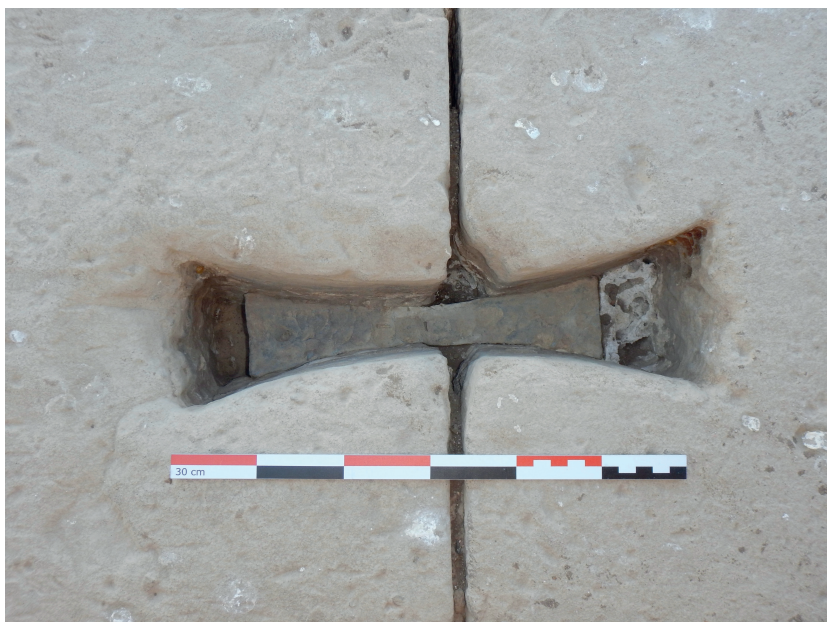
Fig. 8 Élévation ouest du mammisi romain, détail d'une agrafe en plomb.