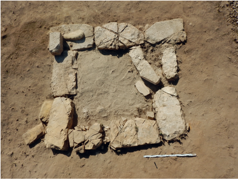
Fig. 5 Quadrilatère de blocs associés à la chapelle de Montouhotep, état avant la fouille.