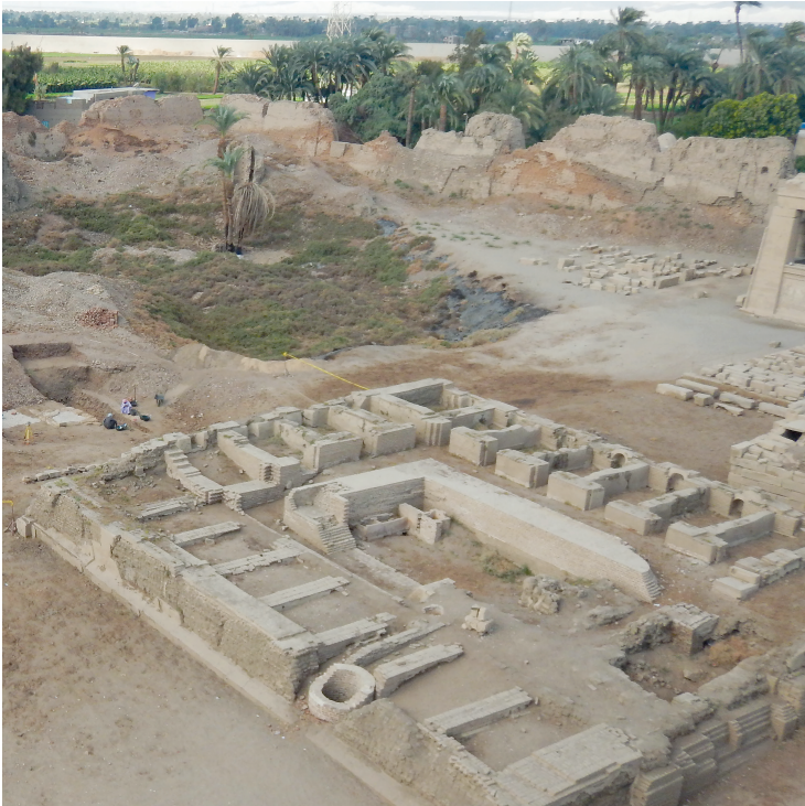
Fig. 3 Un sanctuaire provisoire ?.

au projet de cour du temple d'Hathor. Ce dernier, longtemps assimilé à un établissement curatif, a été appelé – appellation reprise unanimement – « sanatorium » 18 , puis associé à un « tinctorium » 19 . Ces associations nous questionnaient sur l'exigence de pureté qu'implique le sacré et la relation de proximité avec des activités relativement malsaines ou pouvant générer de la peste. Elles viennent d'être remises en cause par l'interprétation de Georges Castel dont l'analyse morphologique du bâti et de son altitude montre que cette structure serait le lieu du culte, en quelque sorte un temple provisoire, pendant le renouvellement du temple d'Hathor. En effet, dans l'univers religieux pharaonique, il est impossible qu'un culte soit interrompu pour cause de chantier 20 .