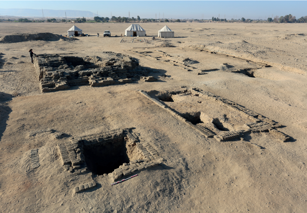
Fig. 11 Vue générale du secteur de Nyibounésou (IV e dynastie) en cours de fouille.