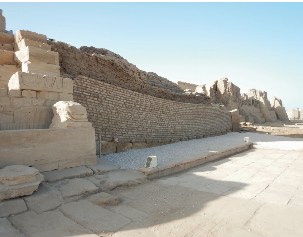
Fig. 4 Restauration en cours du massif de l'enceinte à l'ouest de la porte d'Hathor.

(Sous la conduite de Matthieu Vanpeene, avec la collaboration de Joachim le Bohmin)