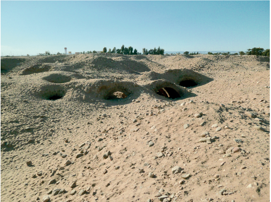
Fig. 10 Vue des sommets des voûtes des catacombes d'animaux affleurant le sol désertique, état avant la fouille.

Plus d'un siècle après la fouille de ce secteur par Petrie, une première campagne de trois semaines menée en 2019 dans le secteur occidental de la nécropole a permis de fouiller les vestiges du camp de base de l'archéologue britannique 33 . Les travaux ont aussi contribué à réévaluer la description et la chronologie relative de ces catacombes telles que publiées par Petrie, en montrant notamment l'existence de structures antérieures 34 .