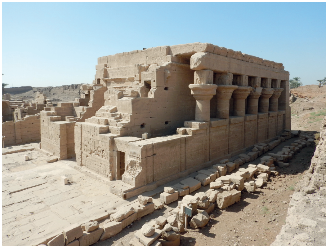
Fig. 6 Côté nord du mammisi romain.