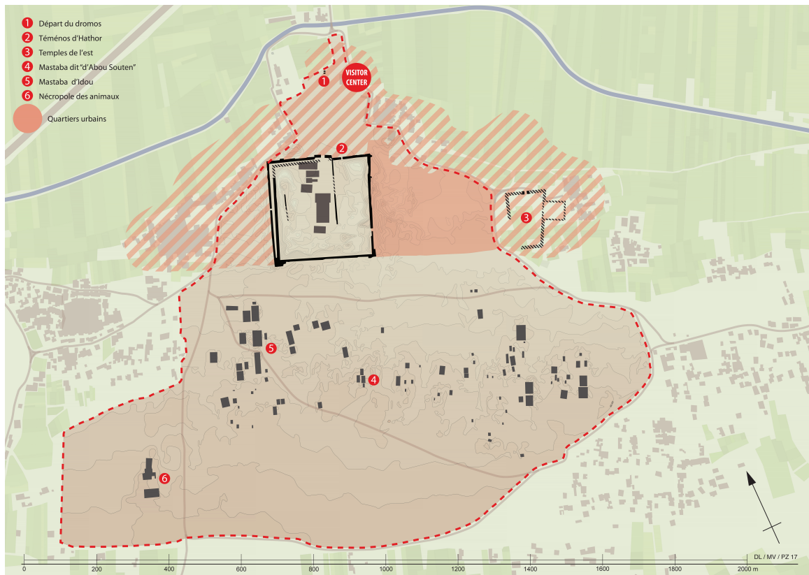
Fig. 1 Carte du site archéologique (© Mission archéologique de Dendara, Ifao).