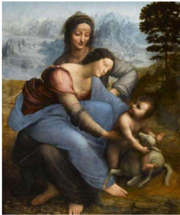
La Vierge, l'Enfant Jésus et sainte Anne - Léonard de Vinci (1503-1519)

possibles ne viendraient pas de la méthode de la psychanalyse, mais des « incertitudes » et des « lacunes du matériel que la tradition nous transmet au sujet de cette personne » 1 . Cet écrit sur de Vinci révèle cependant que l'enjeu pour Freud est avant tout psychanalytique : il s'agit davantage de comprendre l'homme et son travail créateur que de s'en tenir à l'artiste et à l'œuvre d'art. De là, pourrait apparaître un dernier biais de lecture : les œuvres qui intéressent Freud sont bien celles qui vont dans le sens de ses interprétations, ou qui entrent dans sa grille de lecture, comme en témoigne son agacement face à la nouvelle de Schnitzler « La prédiction » : la lecture laisse « un sentiment d'insatisfaction, une sorte de mauvaise humeur » 2 , soit l'inverse d'un « effet pur », quand l'écrivain « nous trompe en nous promettant la réalité commune et en allant nonobstant au-delà d'elle » 3 . Il est alors particulièrement révélateur que le psychanalyste ait un mouvement de rejet face au fantastique d'une œuvre, qui plus est de celui qu'il a évité « par une sorte de crainte de rencontrer [s]on double » 4 .