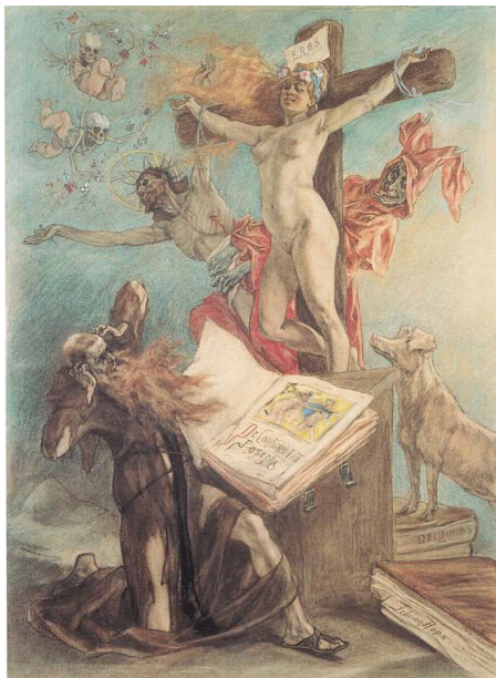
La Tentation de Saint Antoine – Félicien Rops (1878)

L'art sert la science, et Freud peut prendre appui sur Œdipe roi ou sur L'Homme au sable pour exposer ses théories. On comprend alors que, du point de vue du contenu, Freud prenne davantage des exemples littéraires, ou que des exemples picturaux soient choisis pour leur symbolisme, comme lorsqu'il écrit à propos du thème de la tentation de Saint Antoine : « Seul Rops lui a fait prendre la place du Sauveur lui-même sur la croix ; il paraît avoir su que le refoulé, lors de son retour, surgit de l'instance refoulante elle-même » 2 . Là encore, il y a un « savoir » qui permet une bonne mise en scène, mais qui reste peu certain et plutôt le fait d'une sensibilité artiste que d'une saisie claire et rationnelle.